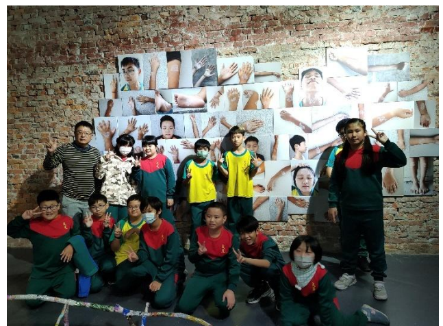
學生作品到蕭壟展出，師生一同參觀