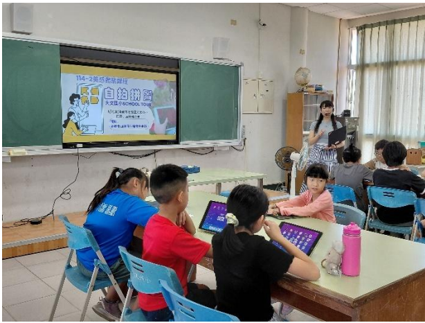
美感體驗課-藝術家到校