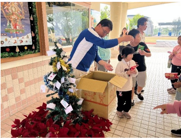
聖誕節布置、發禮物