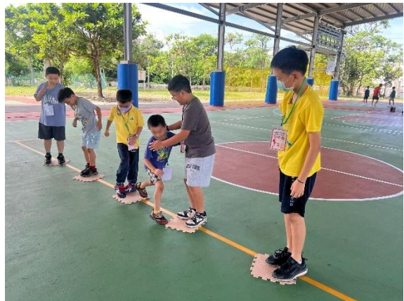
南大環教營-戶外活動