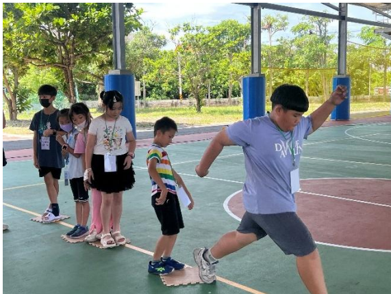
南大環教營-戶外活動