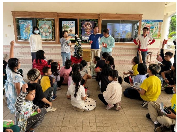
聖誕節布置、發禮物