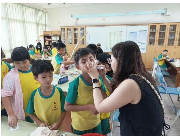
藝術家到校身體彩繪