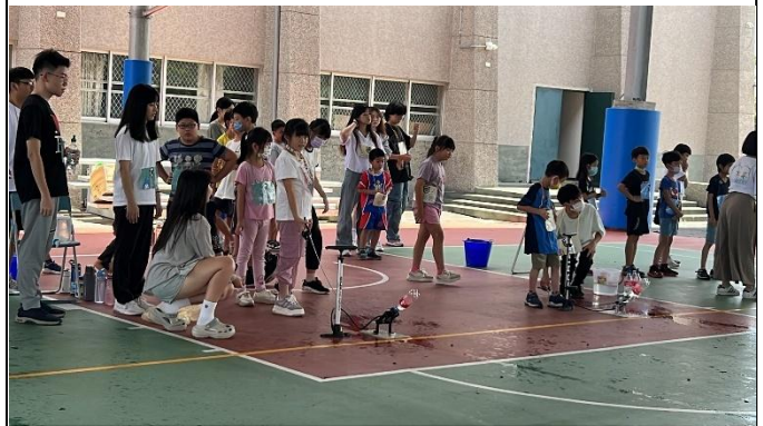
台科大成長營-水火箭