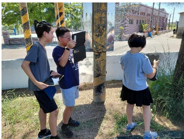
到校園蒐集拼貼素材