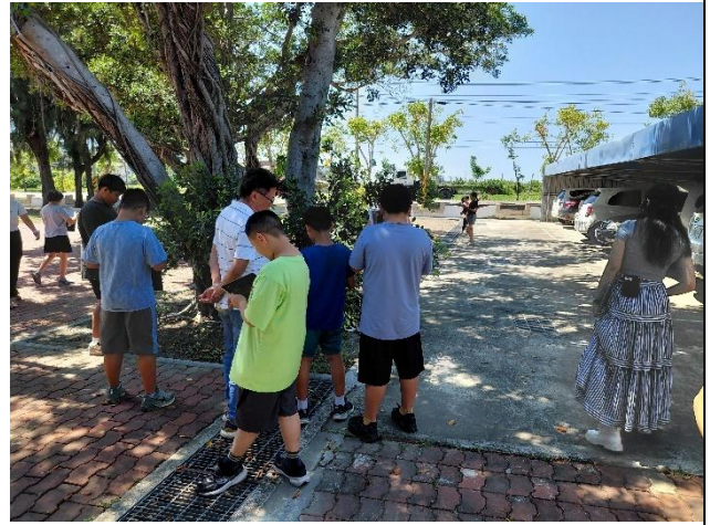
到校園蒐集拼貼素材