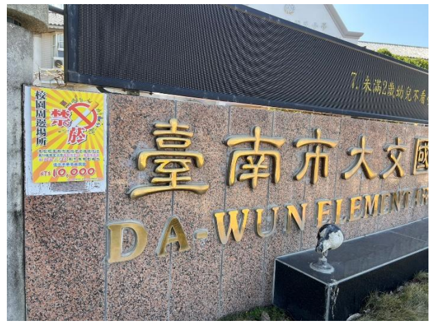
校門口及校內張貼無菸環境標語