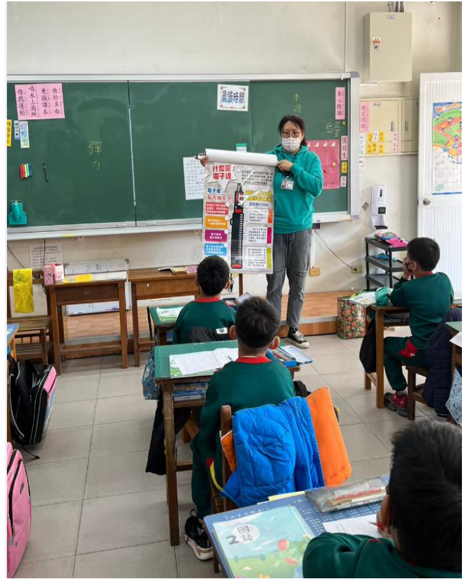
衛生所電子菸宣導