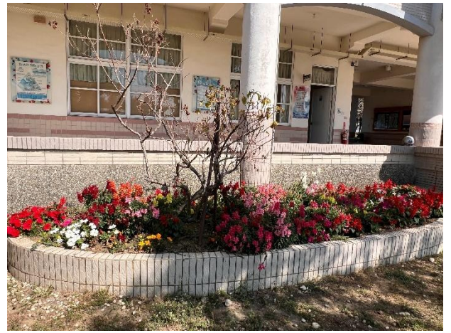
學生種花美化校園