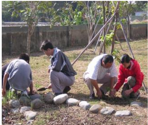
老師幫忙掘樹穴，由學生來種樹