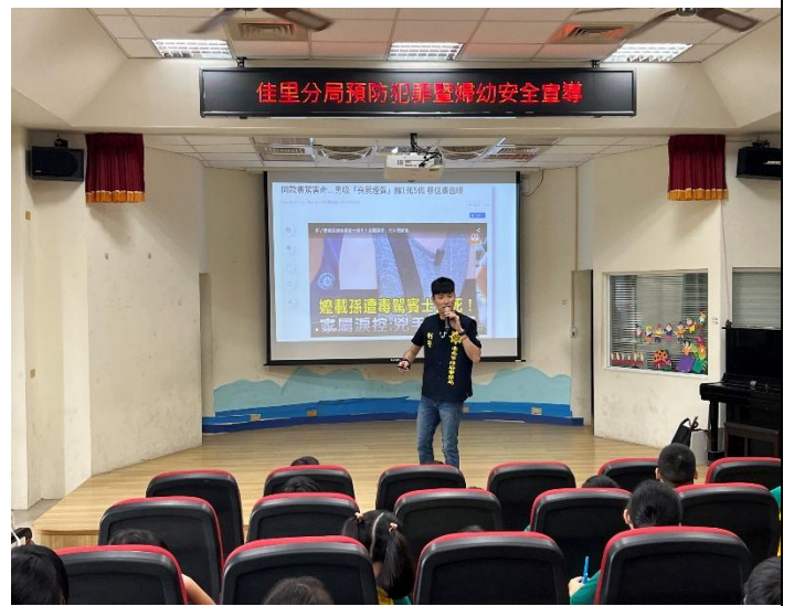
結合地方單位辦理菸害及電子菸防制宣導