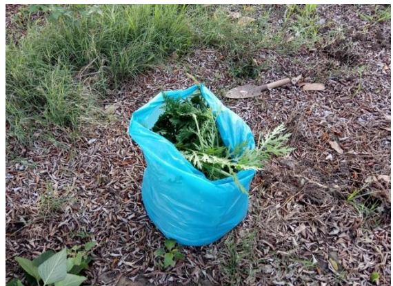
校園入侵有害植物-銀膠菊，老師宣導如何防治，及移除的注意事項