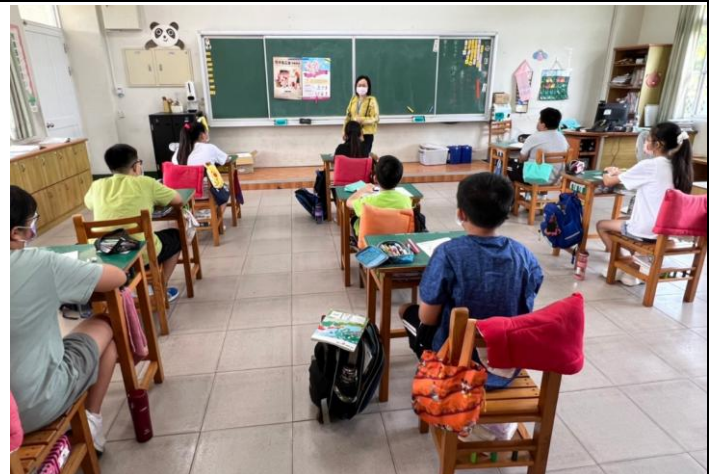
結合民間單位辦理反毒暨愛滋教育宣導