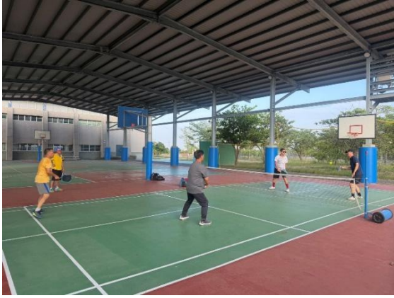
說明：教職員成立運動團隊(匹克球)