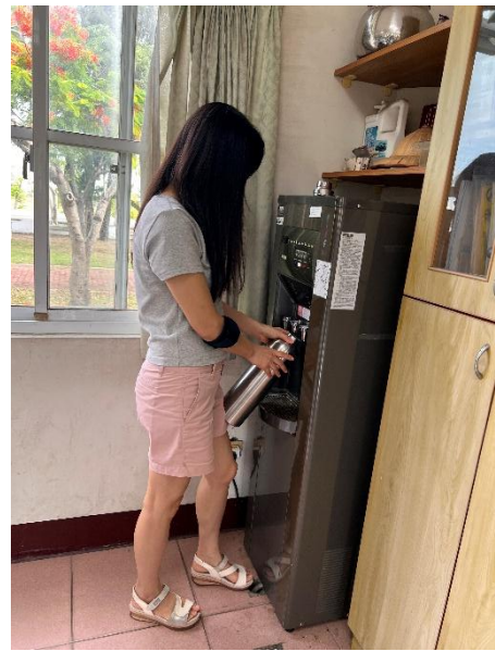
說明：平時喝足白開水