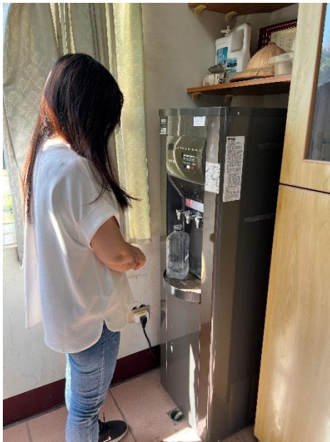
說明：平時喝足白開水