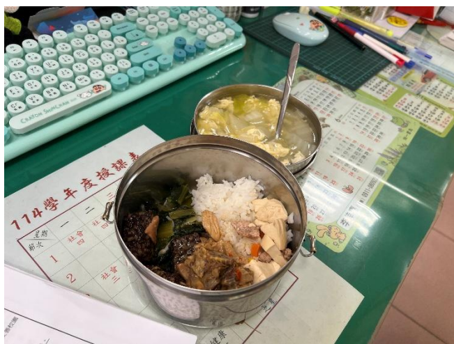
說明：平時多吃蔬果