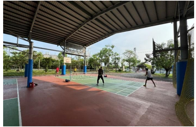
說明：教職員成立運動團隊(匹克球)