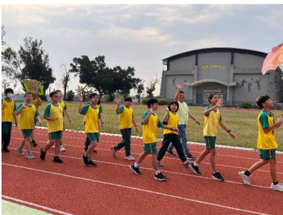
運動會結合標語進場