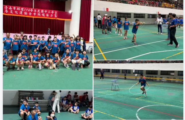
健康體位-普及化跳繩