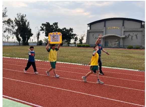
運動會結合標語進場