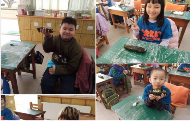
飲食教育課程-做壽司