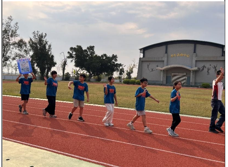
運動會結合標語進場