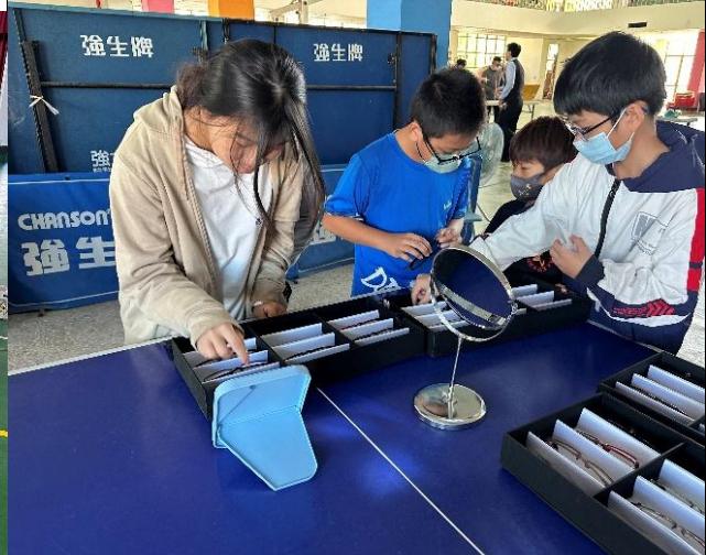
說明：弱勢學生配鏡活動