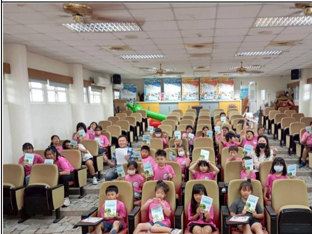
說明：辦理教職員工學生健康體適能健康管理活動