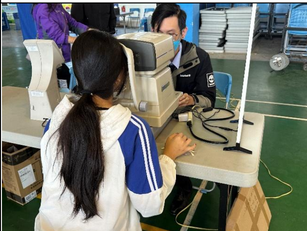
說明：弱勢學生配鏡活動