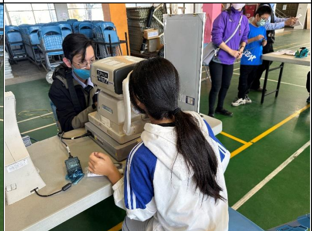
說明：弱勢學生配鏡活動