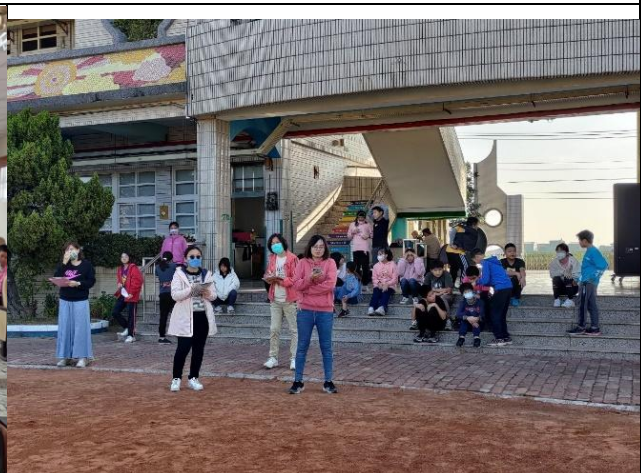
說明：辦理教職員工學生健康體適能健康管理活動