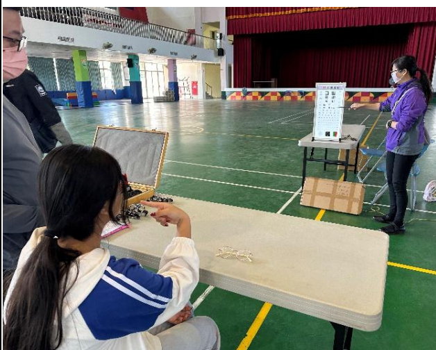
說明：弱勢學生配鏡活動