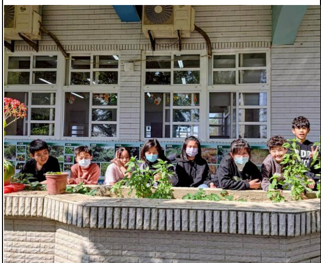
說明：種植植物，協助綠化校園