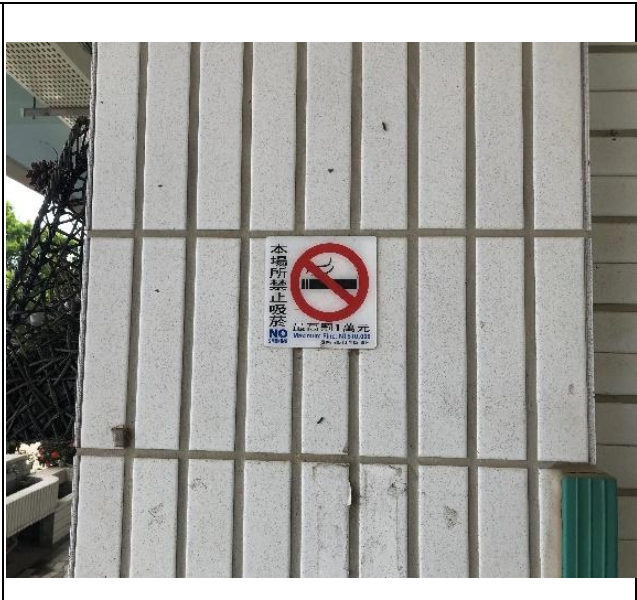
說明：校內張貼禁菸標示