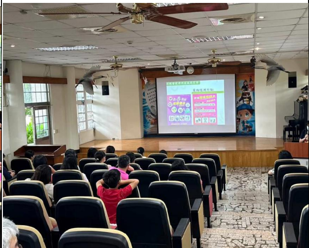
說明：藥物濫用防制宣導