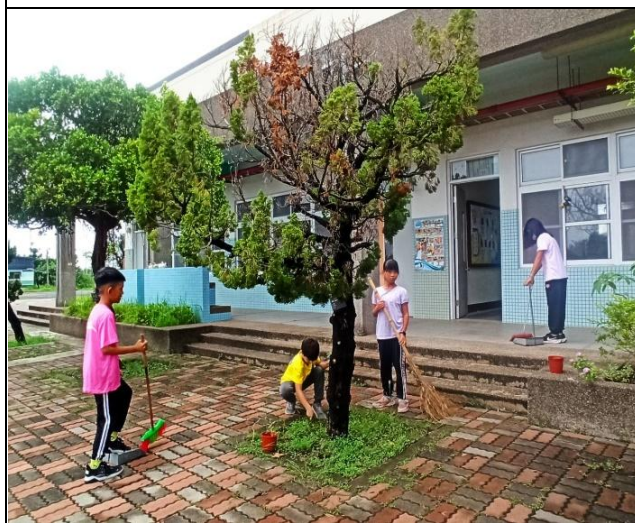
說明：學生協助美化校園