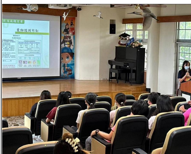
說明：藥物濫用防制宣導