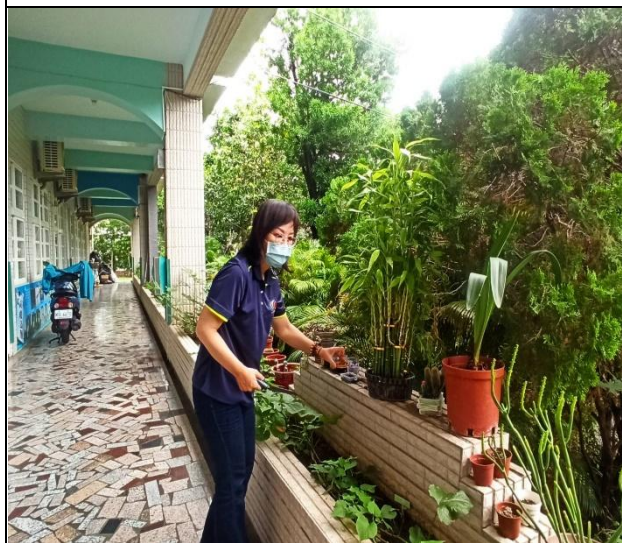
說明：種植植物，協助綠化校園