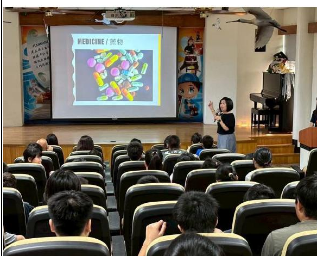
說明：藥物濫用防制宣導