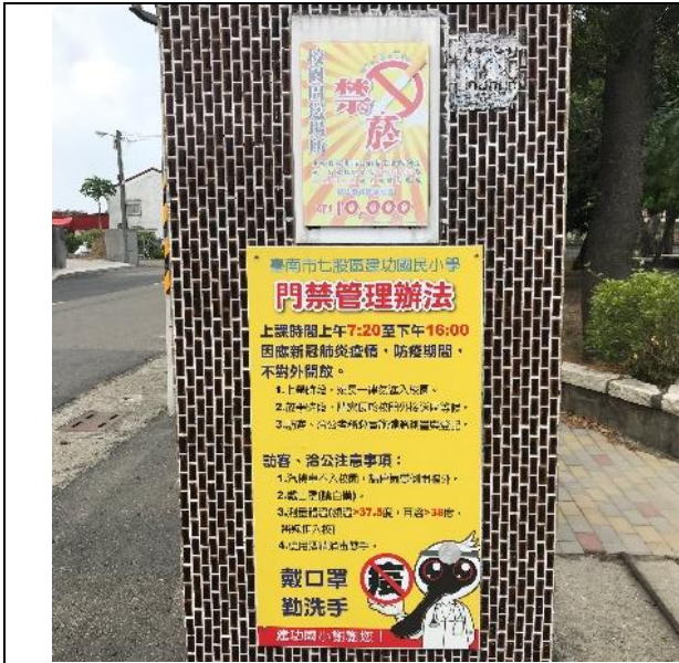
說明：校門口張貼禁菸標示