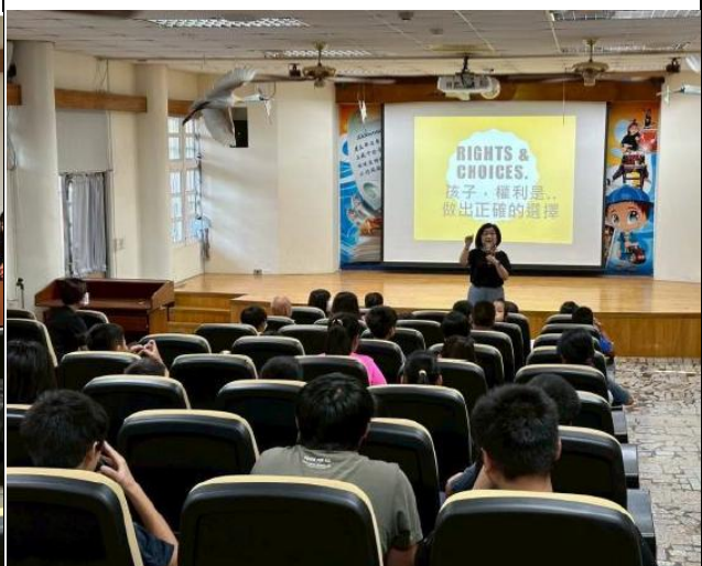
說明：藥物濫用防制宣導