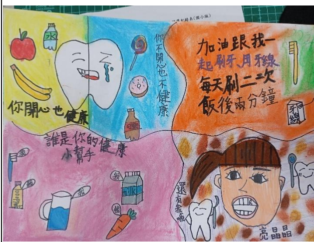
說明：學生親手設計並繪製創意倡議海報