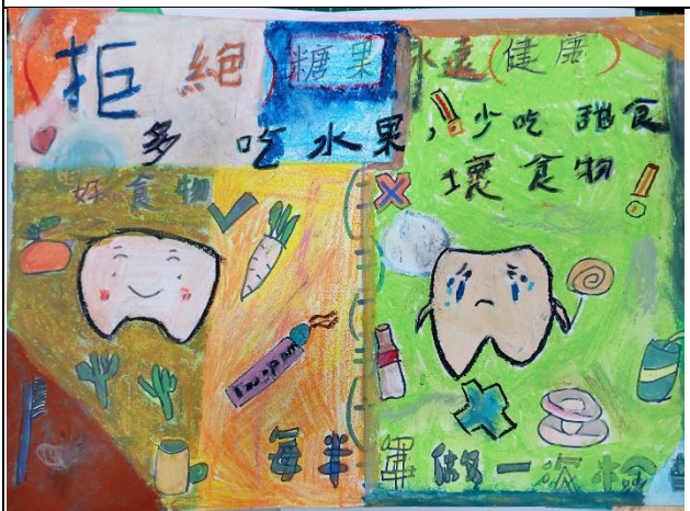
說明：學生親手設計並繪製創意倡議海報