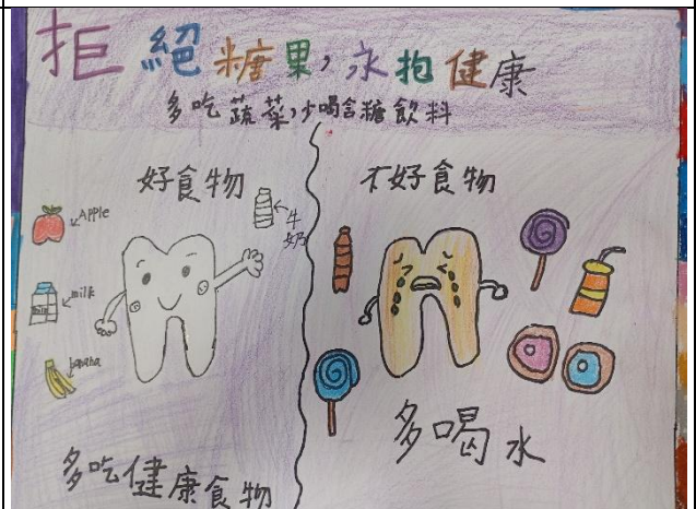
說明：學生親手設計並繪製創意倡議海報