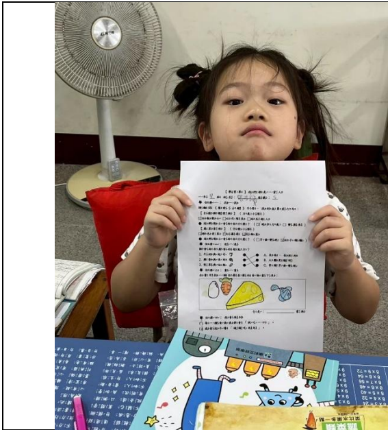
說明：學生透過學習單設計健康的一餐，並實踐後分享