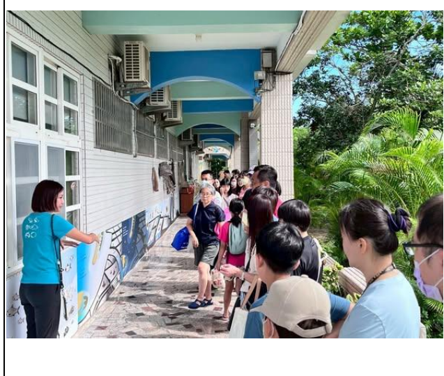
說明：9月食農遊學地圖