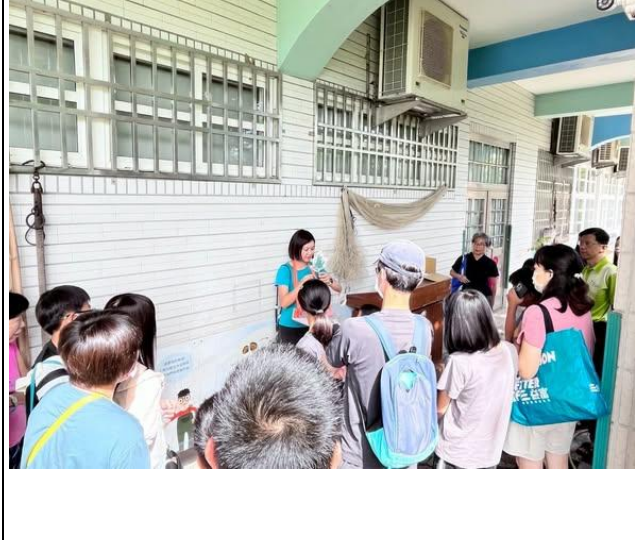
說明：9月食農遊學地圖