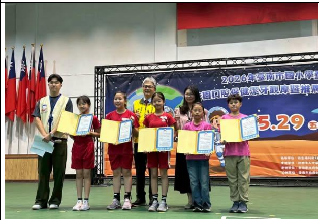
說明：2026臺南市國小學童潔牙觀摩競賽