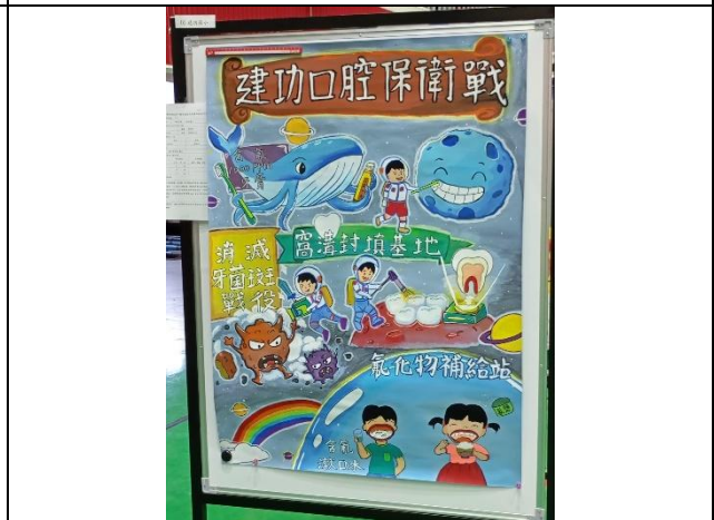
說明：2026臺南市國小學童潔牙觀摩競賽