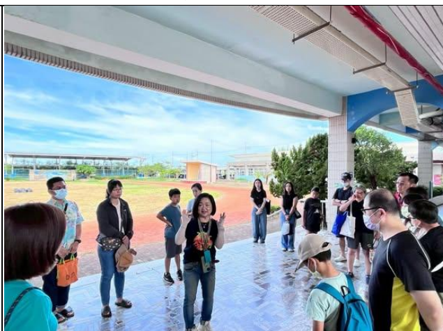
說明：9月食農遊學地圖