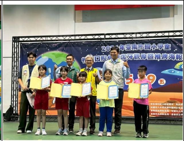
說明：2026臺南市國小學童潔牙觀摩競賽