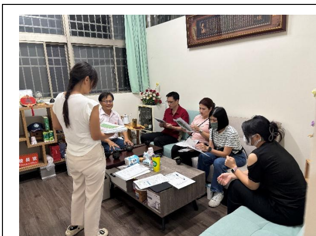
說明：召開家長委員會報告行事曆的健康促進相關活動，討論各項健促活動辦理所需資源