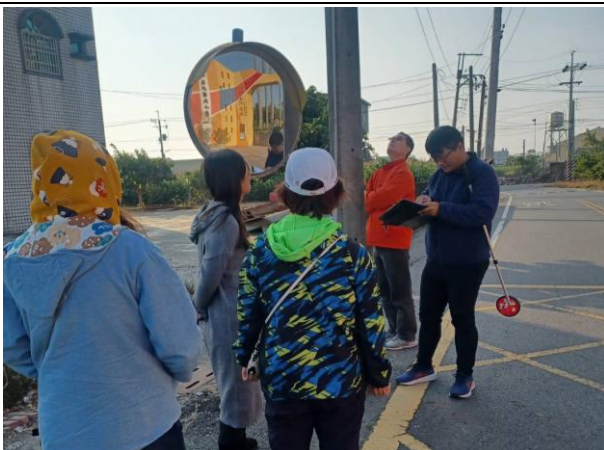
說明：與警察局、公所、交通局進行交通會勘