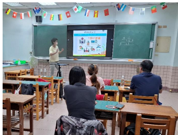
說明：期初班親會進行健康促進議題推廣