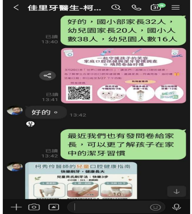
說明：與牙醫師線上討論講座內容與方向