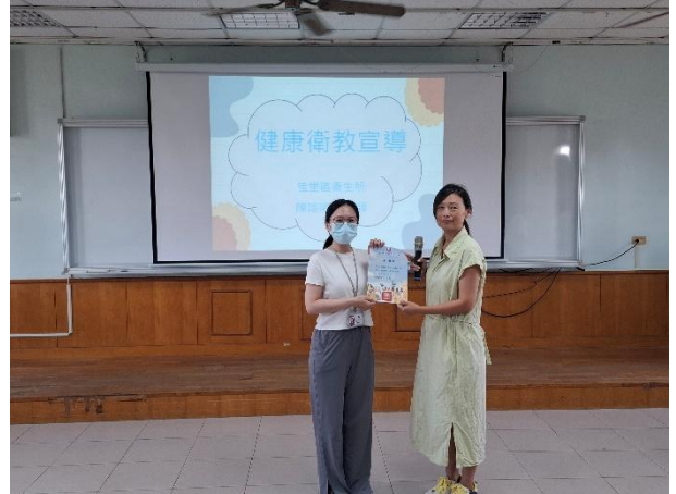
說明：邀請衛生所健康衛教講座