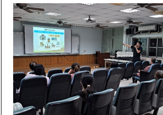
說明：期初班親會進行健康促進議題推廣