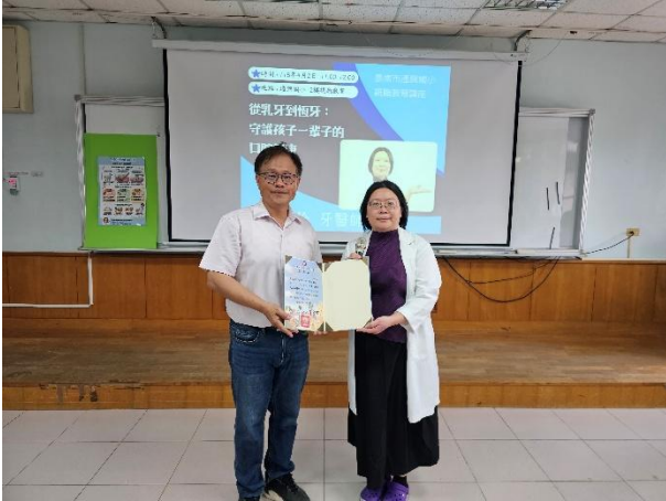
說明：與佳里區牙醫師合作辦理親職講座