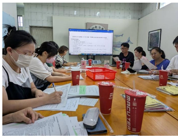
說明：期初校務會議進行健康促進計畫提案