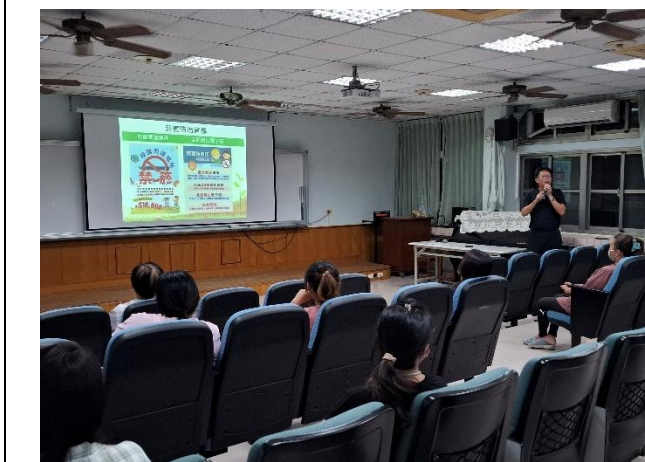
說明：期初班親會進行健康促進議題推廣