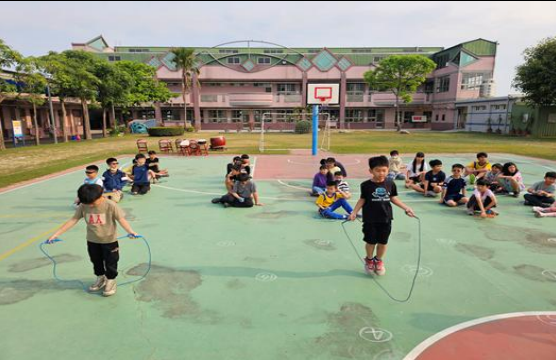
說明：全校跳繩比賽