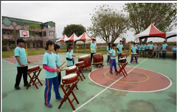
說明：課後社團(太鼓)