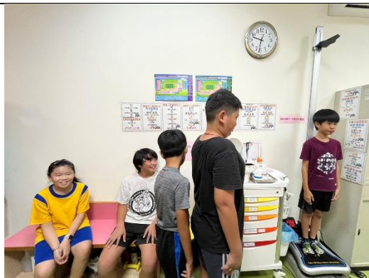
說明：保健中心每學期測量身高體重