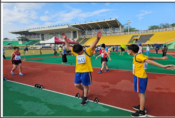
說明：學生參加全市田徑比賽