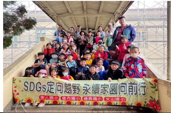
說明：結合鄰近學校辦理定向越野活動