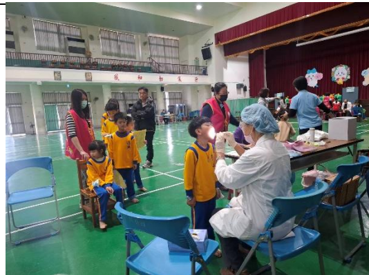
說明：一年級四年級學生進行健康檢查