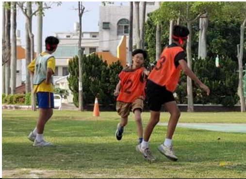
說明：運動會大隊接力