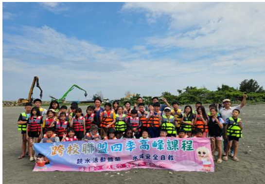
說明：結合鄰近學校辦理四季高峰課程