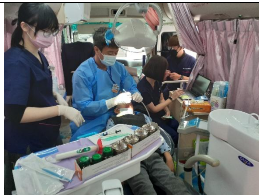
說明：申請口腔巡迴車窩溝封填服務