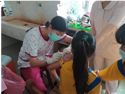
說明：學生在學校進行流感疫苗接種