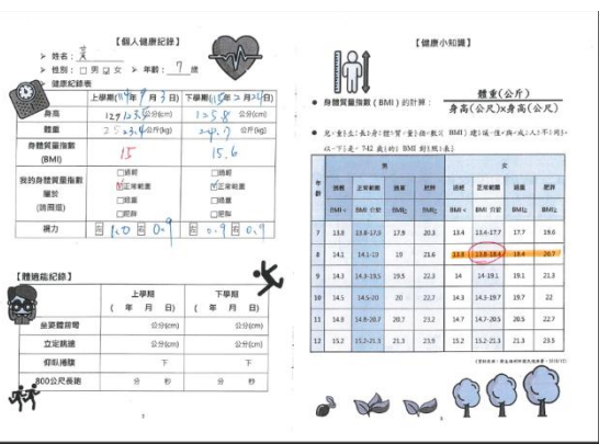
說明：健康護照每周紀錄健康行動