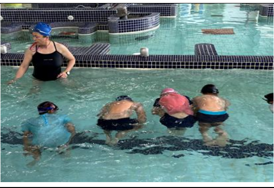
說明：游泳體適能檢測