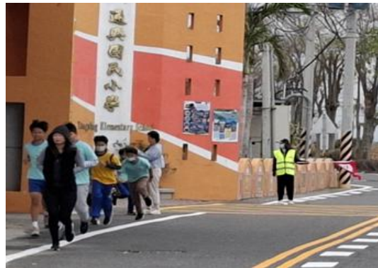
說明：主任帶領全校村跑活動(每月1次)