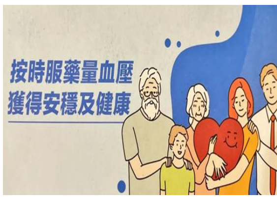
說明：提供教職員工健康諮詢(如高血壓)