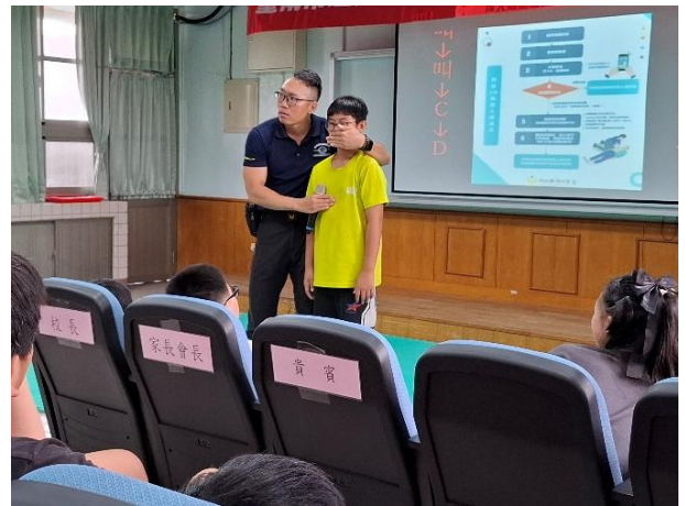
說明：心肺復甦術口訣為「叫、叫、C、D」。