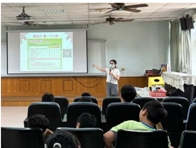
說明：衛生所到校衛教宣導(心情溫度計)