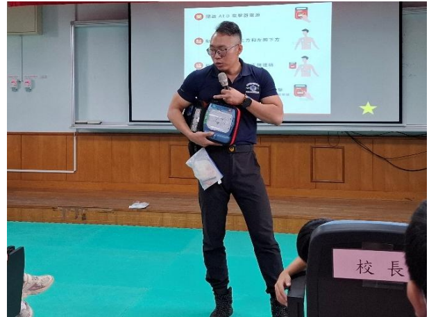
說明：急救員跟學生介紹 AED 的使用方式