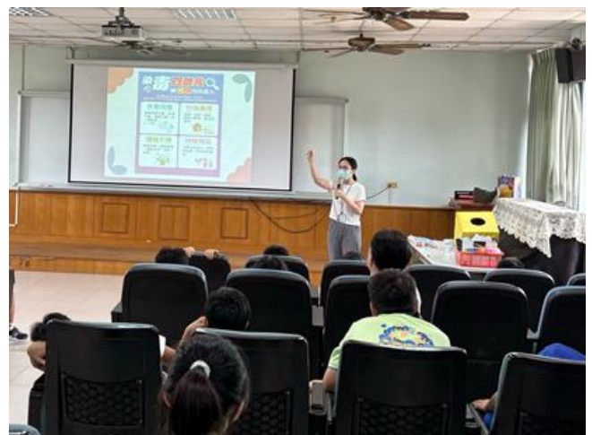
說明：衛生所到校衛教宣導(反毒)