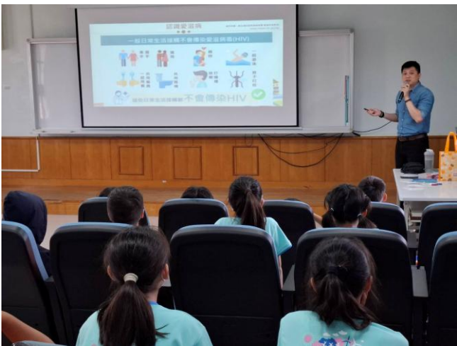
說明：講師宣導日常生活不會傳染愛滋的行為