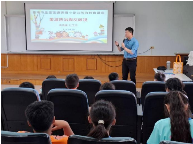
說明：台灣關愛協會講師到校宣導