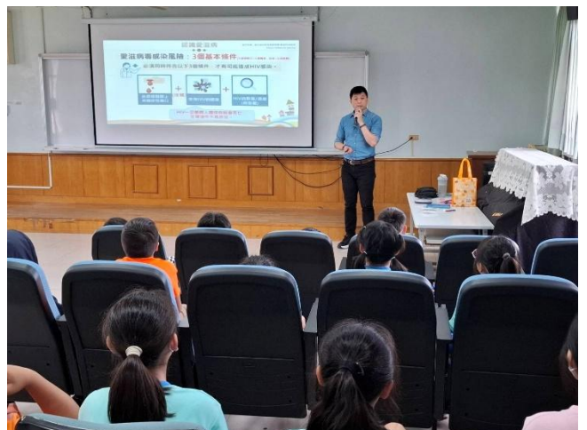
說明：講師宣導傳染愛滋的途徑