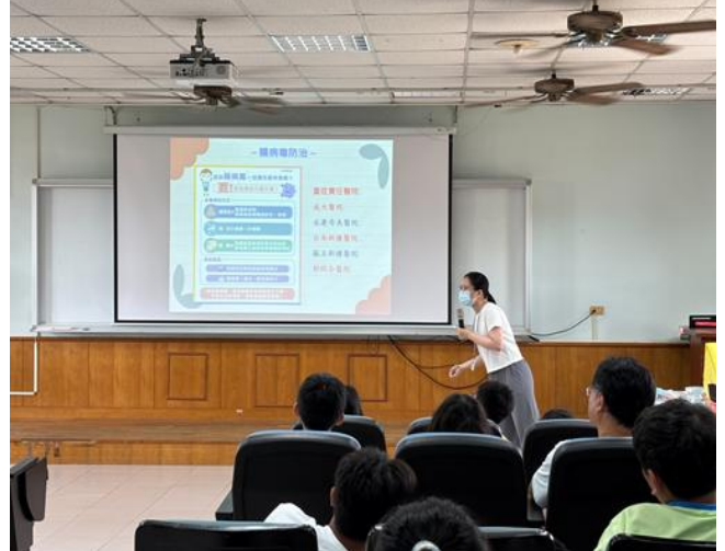
說明：衛生所到校衛教宣導(腸病毒防治)