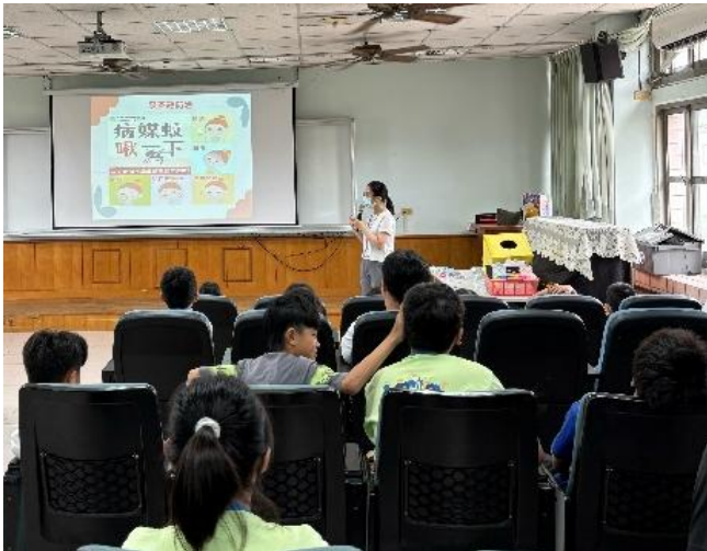
說明：衛生所到校衛教宣導(登革熱防治)