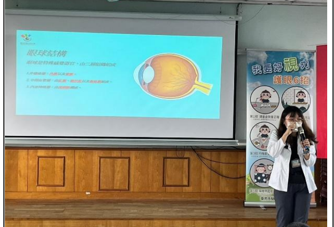
說明：眼科醫師宣導視力保健的重要與方法