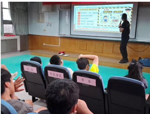
說明：消防員教學生打電話119如何報案