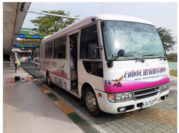
說明：口腔保健巡迴車到校進行口腔保健服務