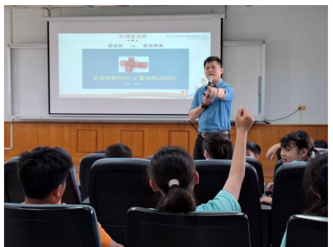
說明：講師宣導愛滋病與愛滋病毒的關係