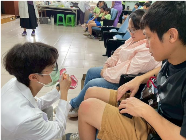
說明：牙醫用口腔模型向家長示範貝氏刷牙