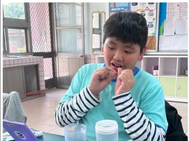
說明：高年級使用牙線刮除牙菌斑