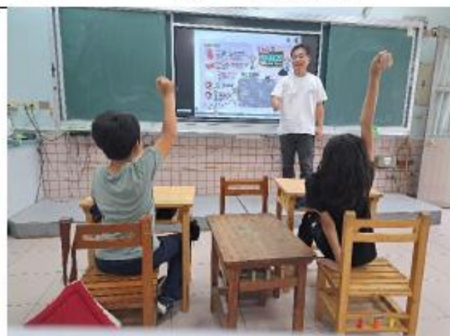
說明:四年級~油脂與堅果主題海報教學