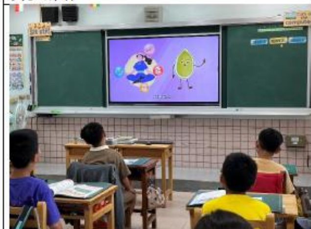
說明:三年級~吃出營養好健康