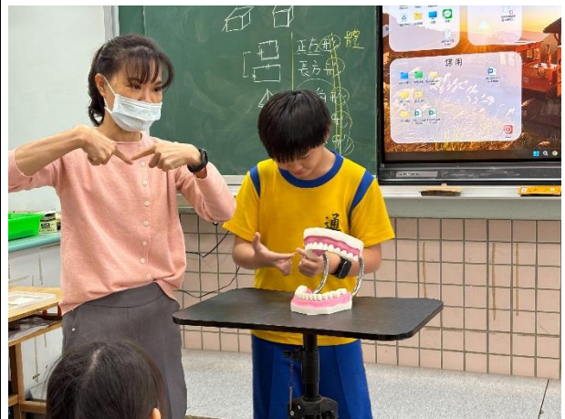
說明：高年級使用牙線刮除牙菌斑