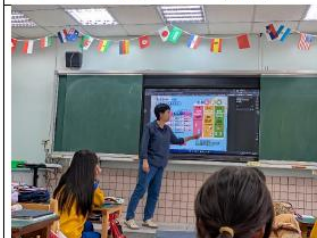
說明:五年級~乳品主題海報教學