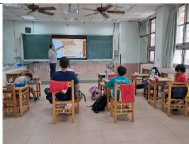
說明:六年級~全台最大花生產地-農會設加工廠自產自銷