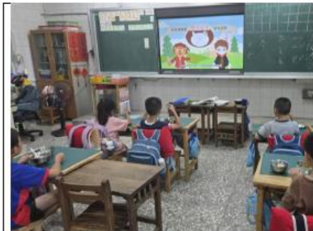
說明:一年級~食品身份證