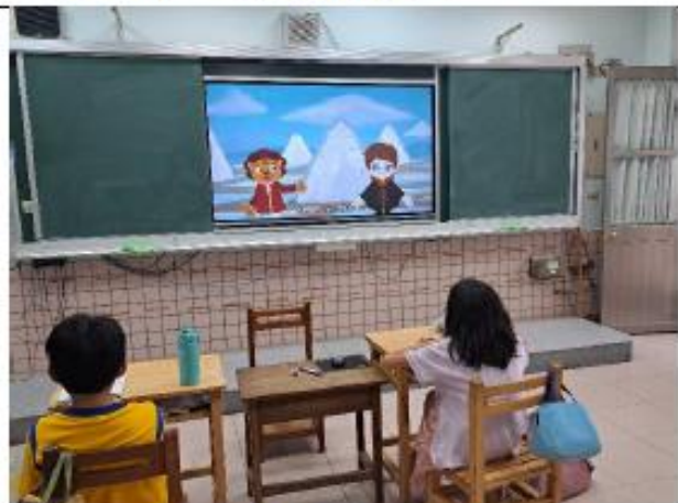
說明:四年級~在地食材與標章