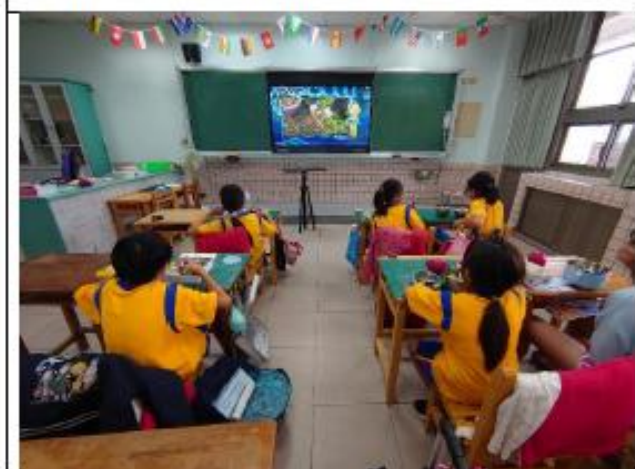
說明:五年級~如果果實種子是用來買賣交易的貨幣