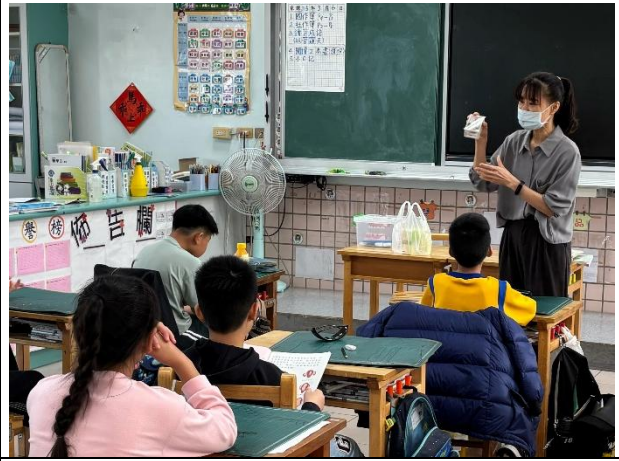
說明：中年級認識飲料中的糖分