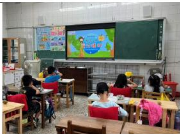
說明:二年級~神奇的魔法種籽