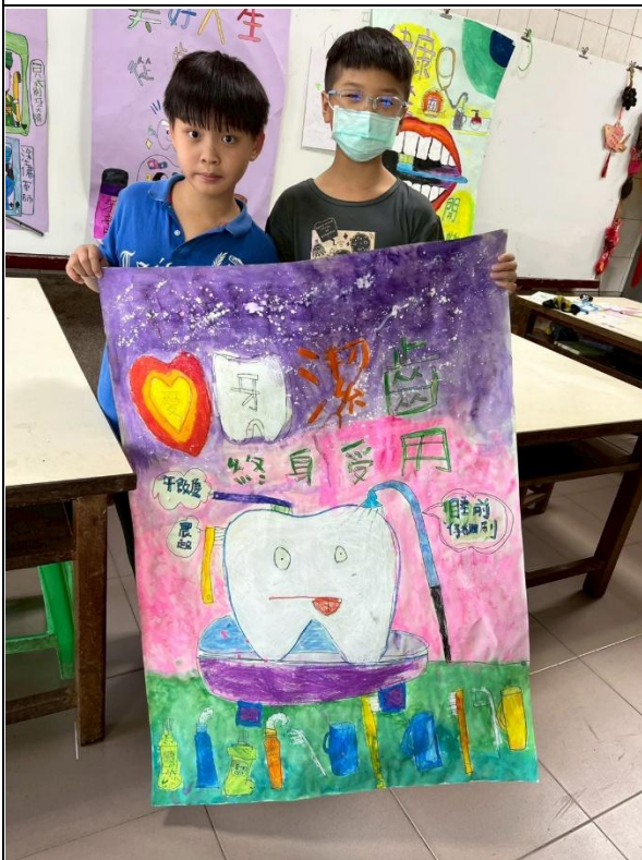
說明：高年級創作口腔宣導海報