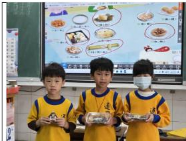
說明:一年級~米食主題海報教學