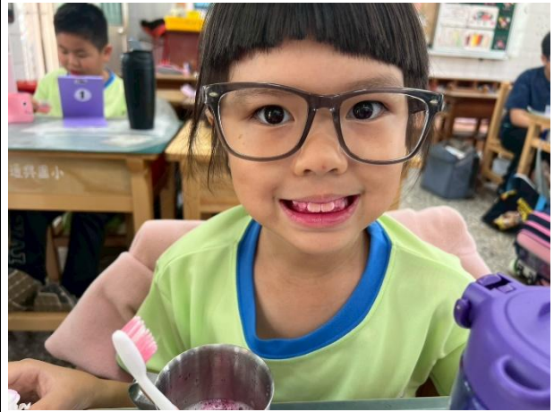
說明：使用顯示劑觀察刷牙的情形