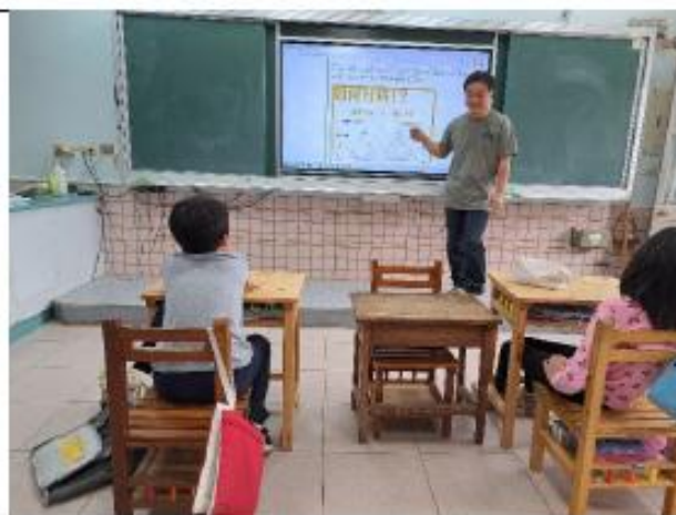
說明:四年級~蔬菜天然辛香料—廚房三大魔法師