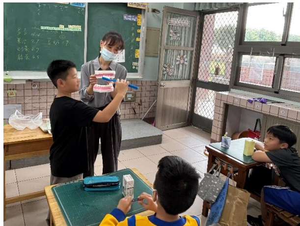
說明：中年級練習貝氏刷牙法