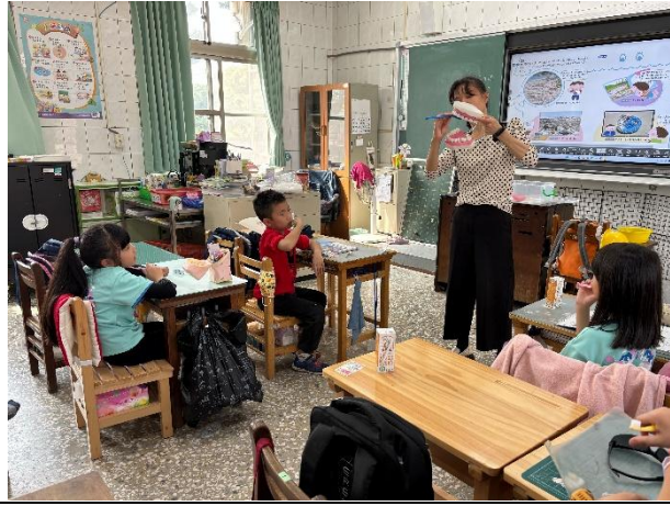
說明：低年級小熊包力刷牙記繪本