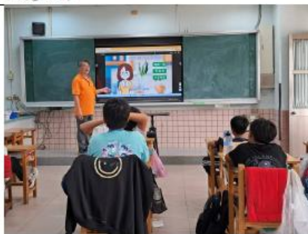
說明:六年級~小小標章大學問