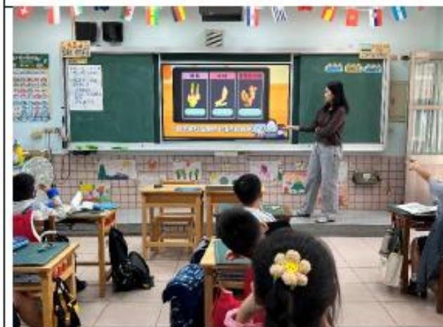
說明:三年級~薑薑好的健康味