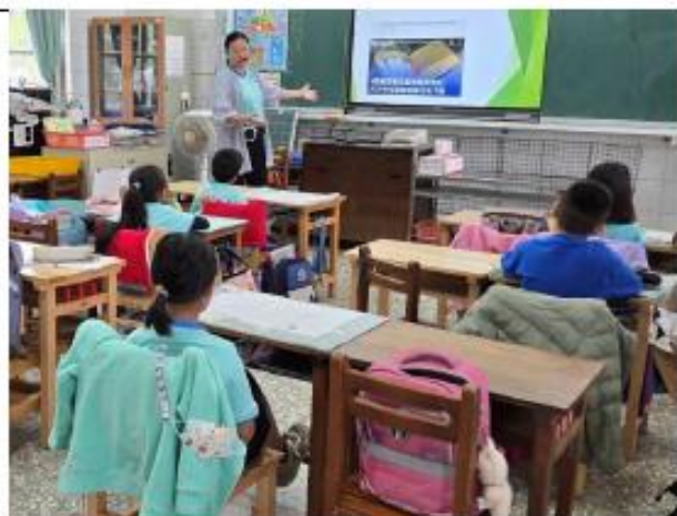
說明:二年級~食安問題