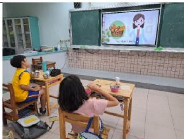
說明:四年級~營養滿分堅果怎麼挑?