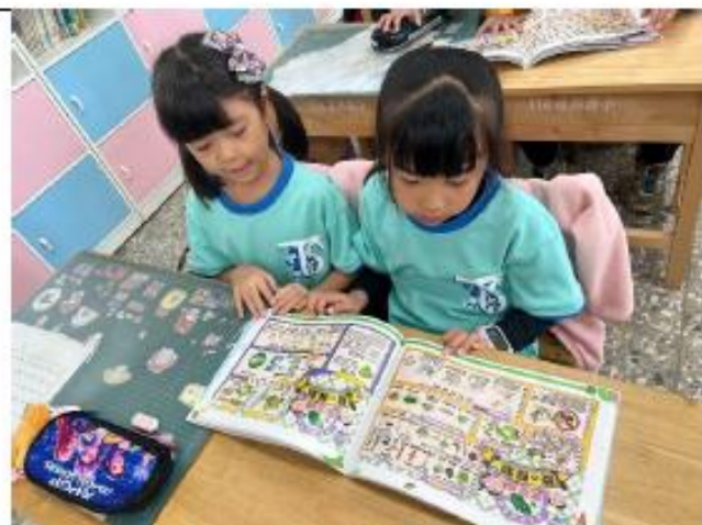
說明:二年級~蔬菜主題海報教學