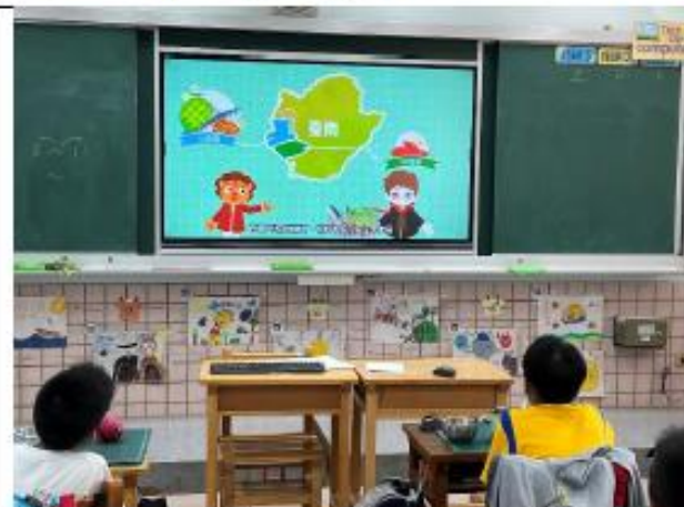
說明:三年級~在地食材與標章