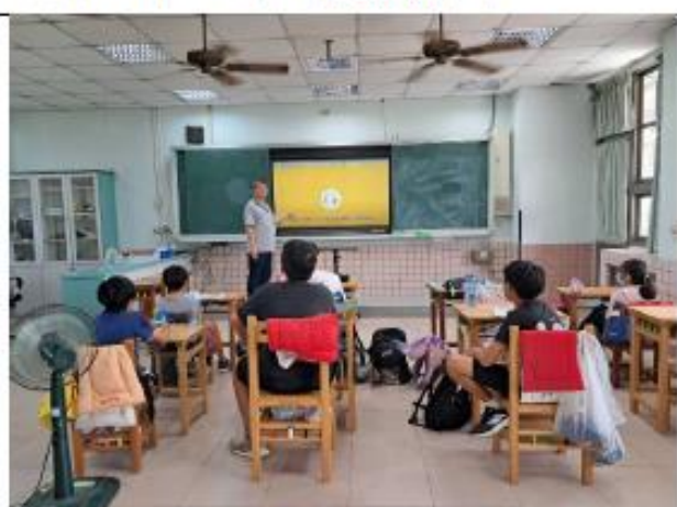
說明:六年級~食品標章與健康