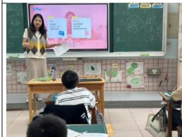
說明:三年級~乳製品主題海報教學