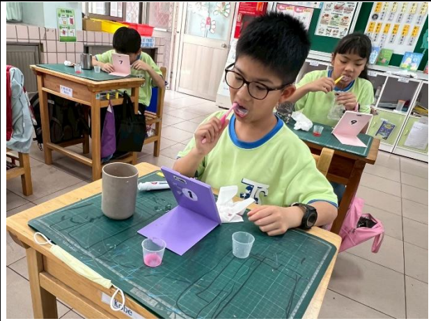
說明：學生看著鏡子將牙齒刷乾淨