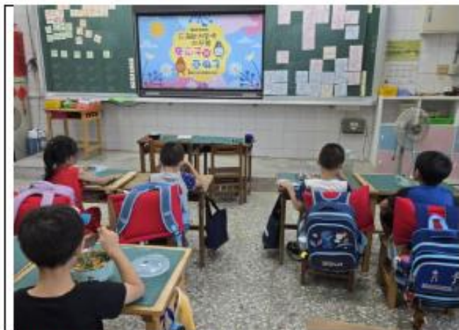
說明:一年級~充滿歐情的早餐—葵花籽與亞麻籽