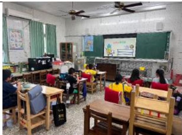
說明:二年級~我的午餐標章