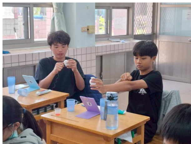
說明：高年級使用牙線刮除牙菌斑