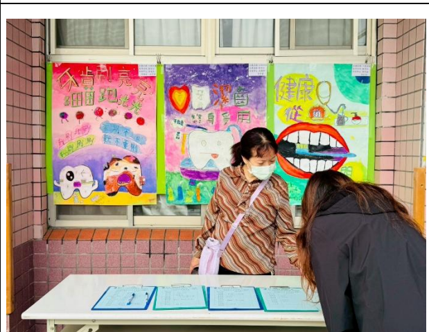
說明：成果發表會展示口腔宣導海報