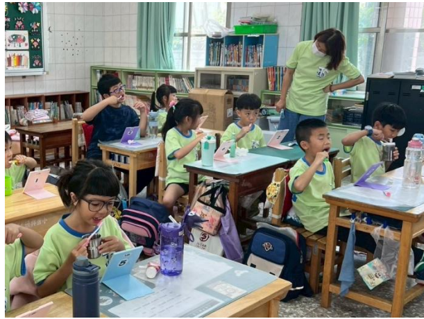
說明：老師觀察學生潔牙狀況