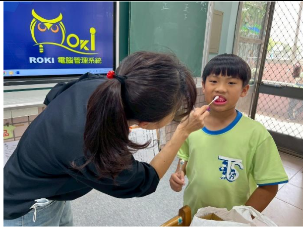
說明：護理師提醒需要加強的區域