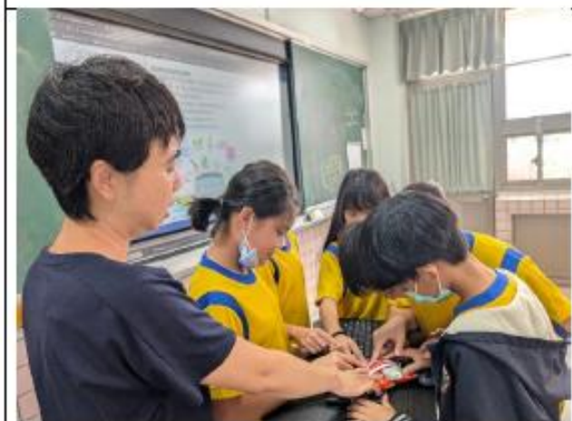
說明:五年級~認識食品添加物