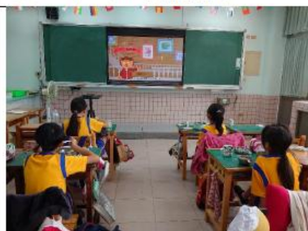
說明:五年級~食品標章與健康