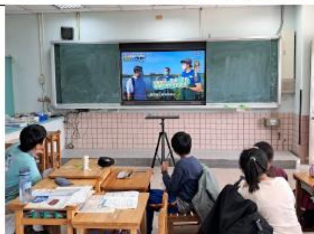
說明:六年級~魚類主題海報教學