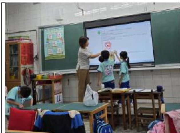
說明:一年級~小小標章，大大學問