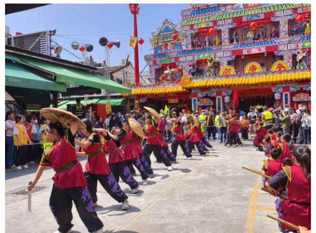
丙午香科五朝王醮蕭壠刈香~金唐殿(主廟)