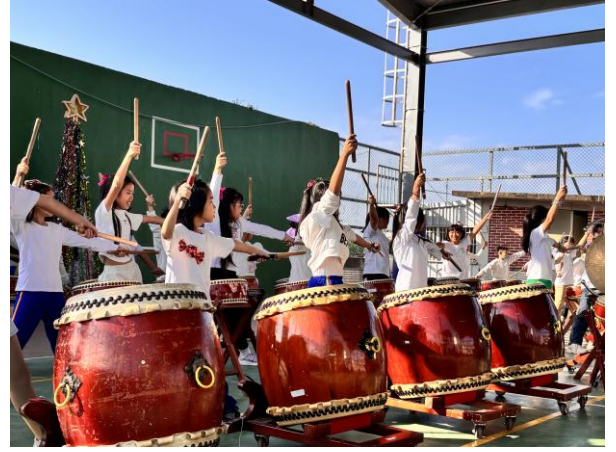
校內成果展演(114年12月23日)