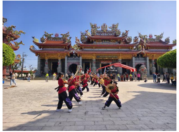
丙午香科五朝王醮蕭壠刈香~永昌宮