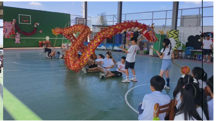
115 年 5 月 8 日母親節成果展