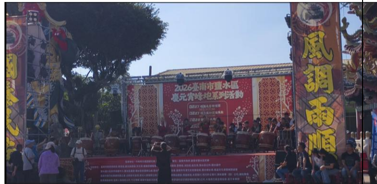
115年3月2日 台南囝仔仙拚仙太鼓演出