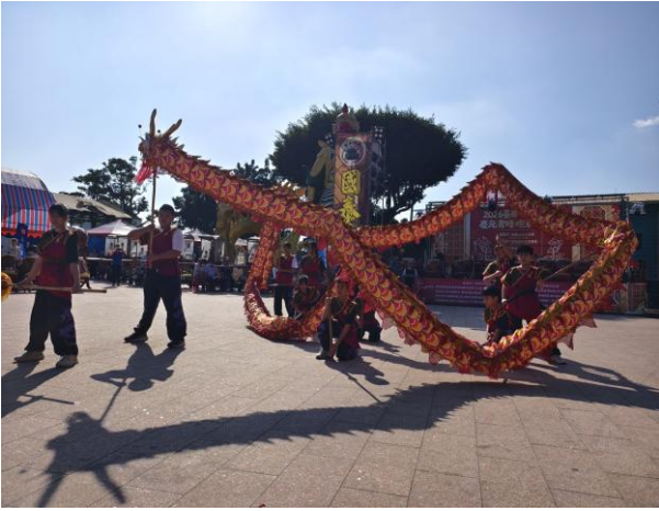
115 年 3 月 2 日台南囝仔仙拚仙舞龍演出