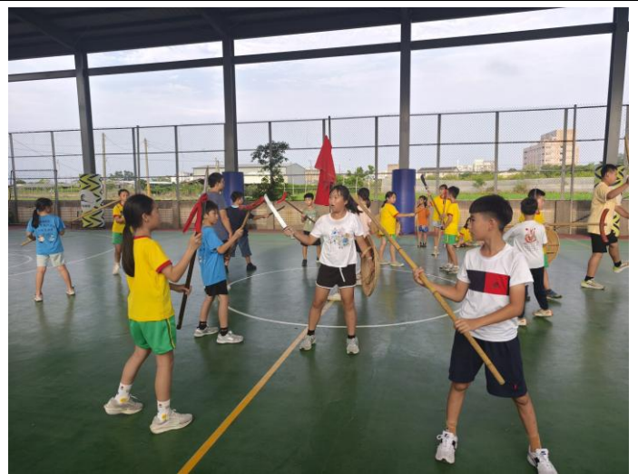
八卦陣基本動作指導