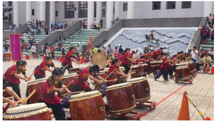
太鼓演出畫面(114年11月8日)