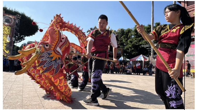
115 年 3 月 2 日台南囝仔仙拚仙舞龍演出