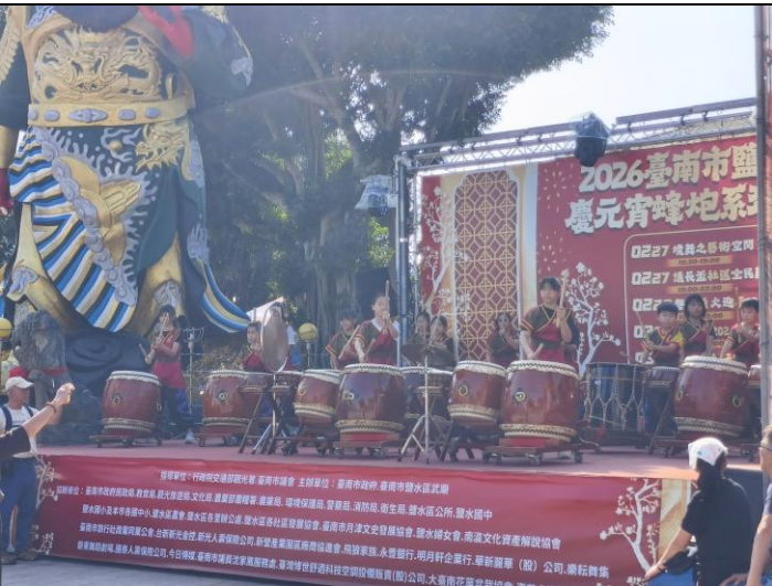
115年3月2日 台南囝仔仙拚仙太鼓演出