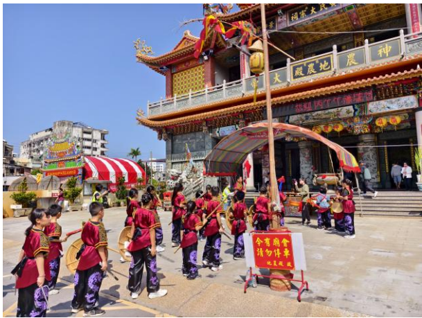
丙午香科五朝王醮蕭壠刈香~地農殿