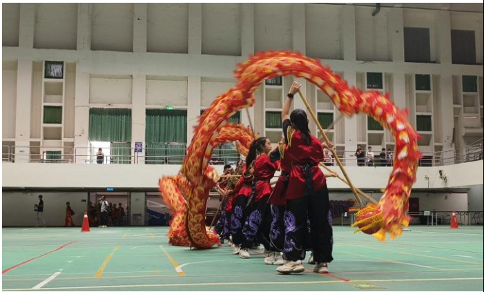
舞龍演出畫面(114 年 11 月 8 日)