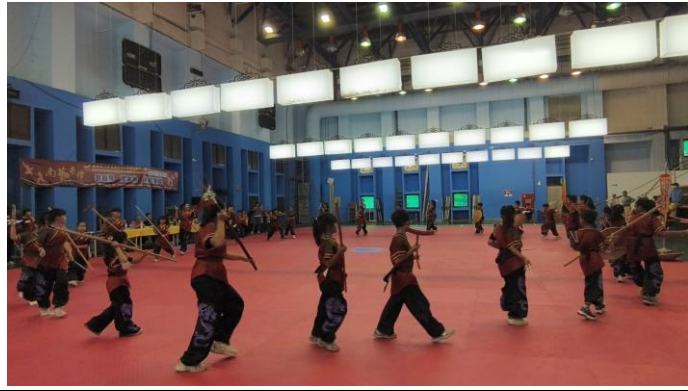
宋江演出畫面(114 年 11 月 8 日)