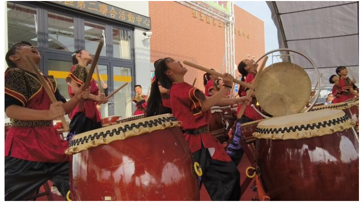
佳里聯合活動中心開幕(114年12月20日)