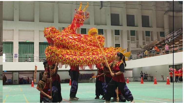
舞龍演出畫面(114 年 11 月 8 日)