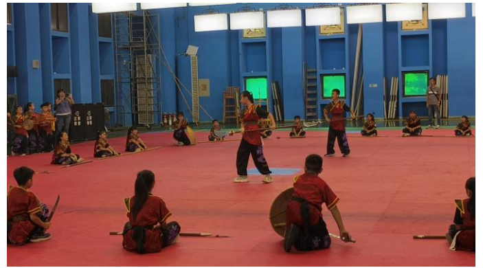
參加台南市 114 年度傳統藝術比賽國小組 傳統藝陣宋江陣特優(114 年 11 月 8 日)