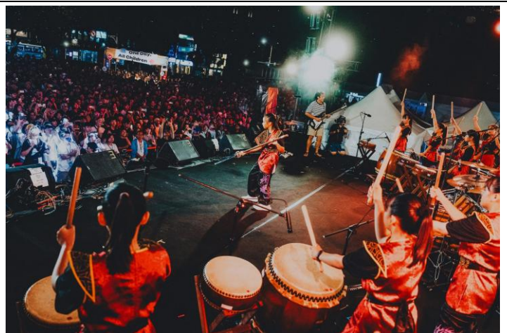
太鼓結合宋將演出(114年9月21日TFT有感節)