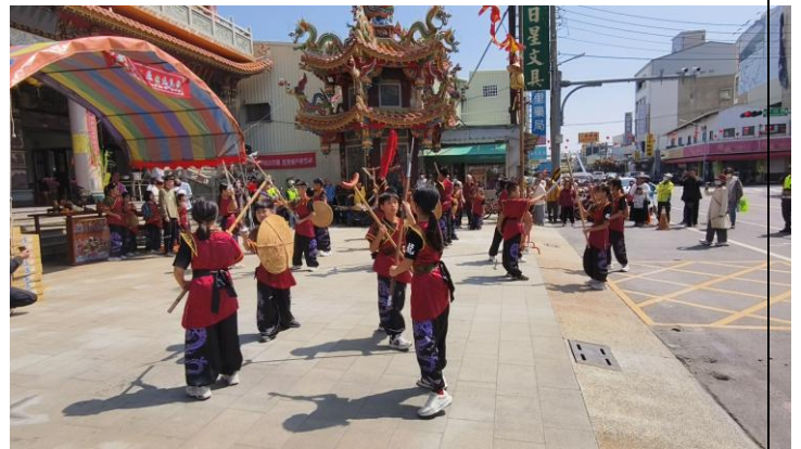
丙午香科五朝王醮蕭壠刈香~地農殿