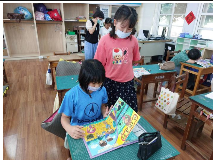
學生觀賞自己做的繪本