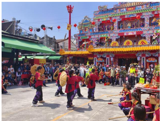
丙午香科五朝王醮蕭壠刈香~金唐殿(主廟)