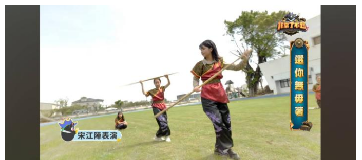
參加公視台語台拍攝