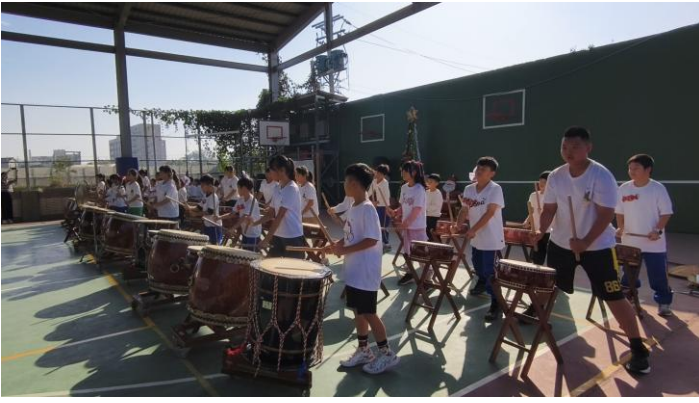
校內成果展演(114年12月23日)