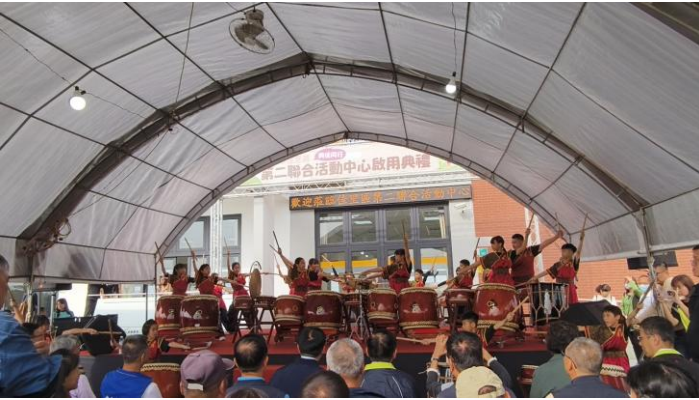
佳里聯合活動中心開幕(114年12月20日)