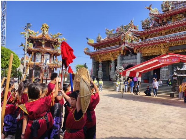
丙午香科五朝王醮蕭壠刈香~永昌宮