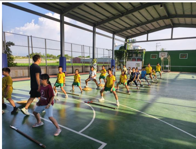
蜈蚣陣基本動作指導