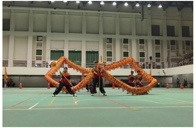
參加台南市 114 年度傳統藝術比賽國小組 舞龍優等(114 年 11 月 8 日)