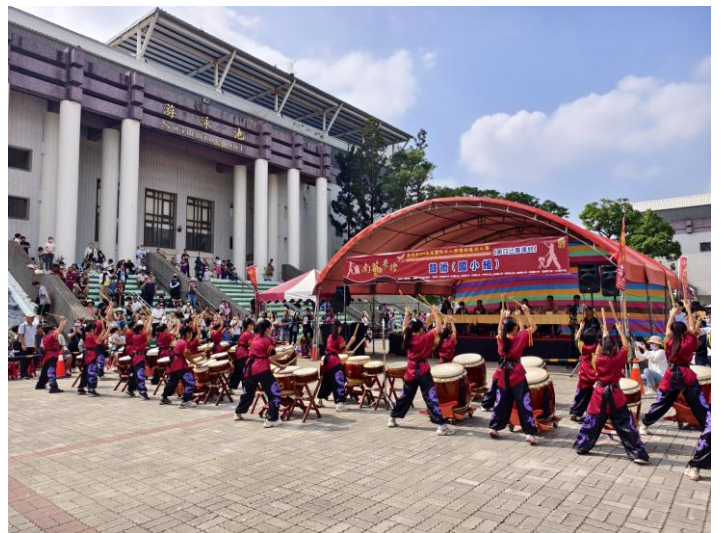
參加台南市114年度傳統藝術比賽國小組鼓術優等(114年11月8日)