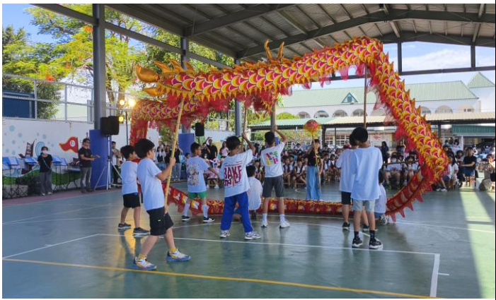
115 年 5 月 8 日母親節成果展