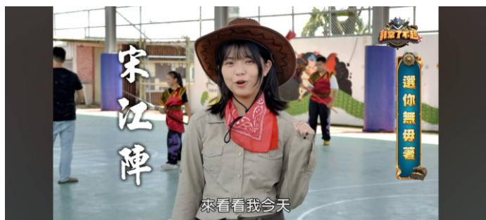
參加公視台語台拍攝