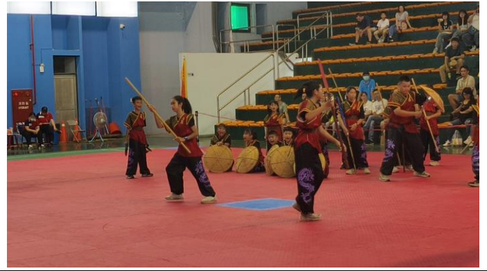
宋江演出畫面(114 年 11 月 8 日)