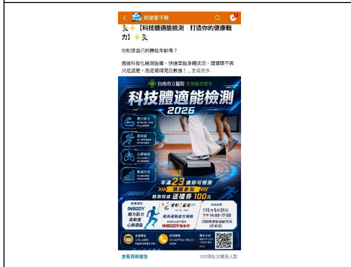
體適能檢測活動宣導