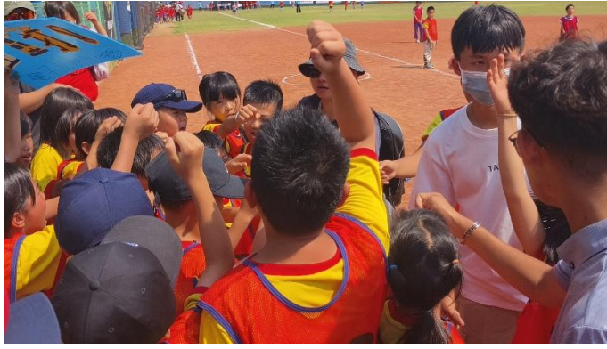
精彩畫面~上場前的吶喊!