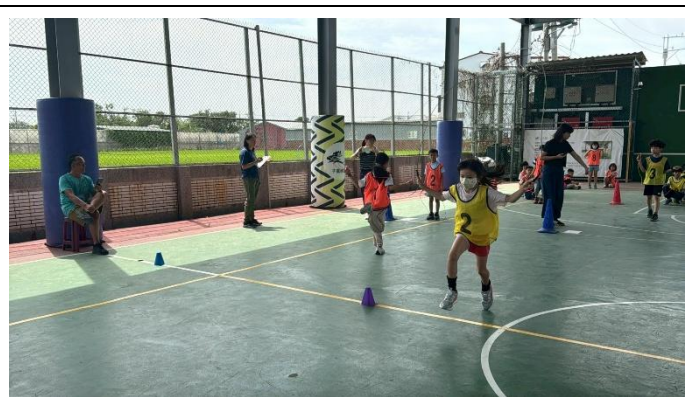
學生們挑戰自己的極限