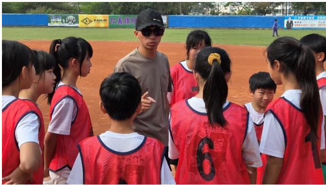
比賽時教練的精神喊話