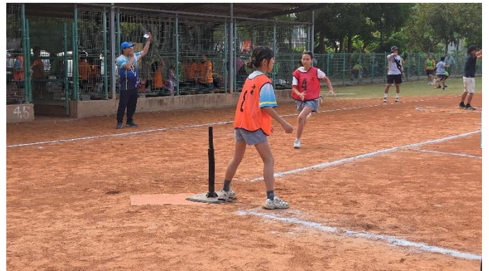
即將衝回本壘得分!