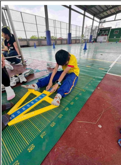
說明：坐姿體前彎測驗