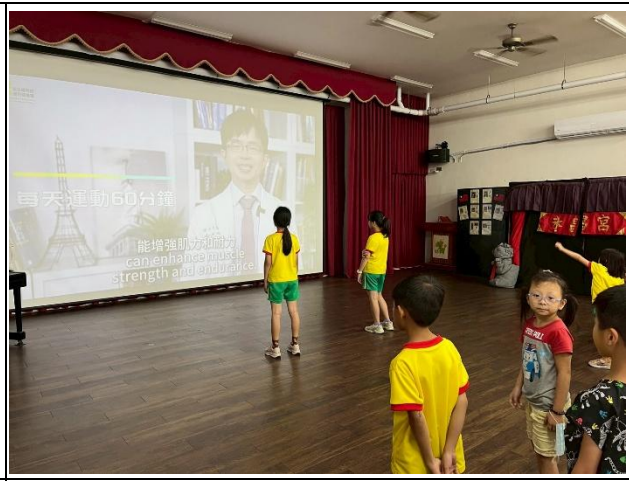
說明：每天運動60分鐘，可以增強肌力和耐力