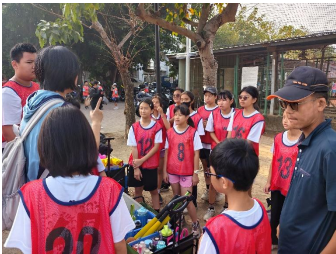
上場前的精神喊話