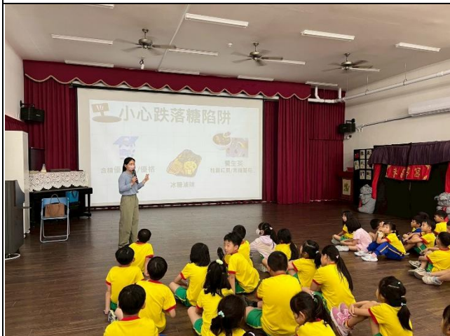
說明：小心跌落糖陷阱而攝取過多的糖份