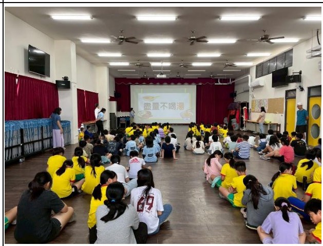
說明：盡量少喝糖，減少鹽分攝取