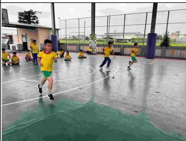
說明：耐力漸速折返跑