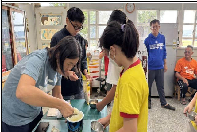
說明：參與活動獲得獎品~黃豆冰淇淋