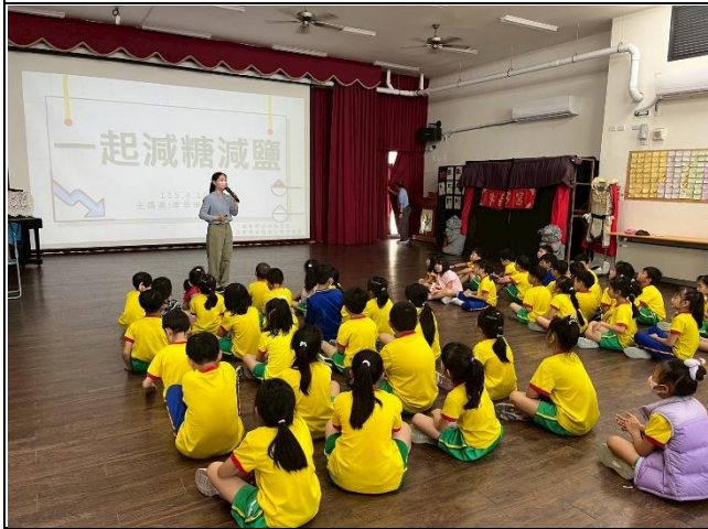
說明：衛生所到校進行減糖減鹽宣導