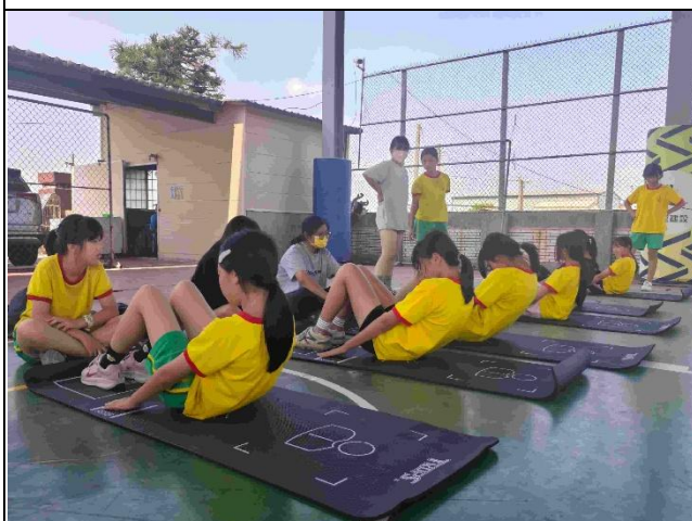
說明：仰臥捲腹測驗