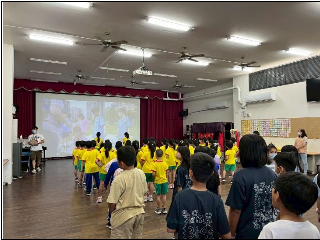
說明：有時間多到戶外運動、走走