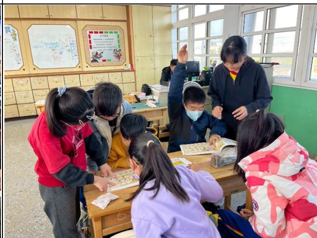
說明：入班推動餐前五分鐘專書