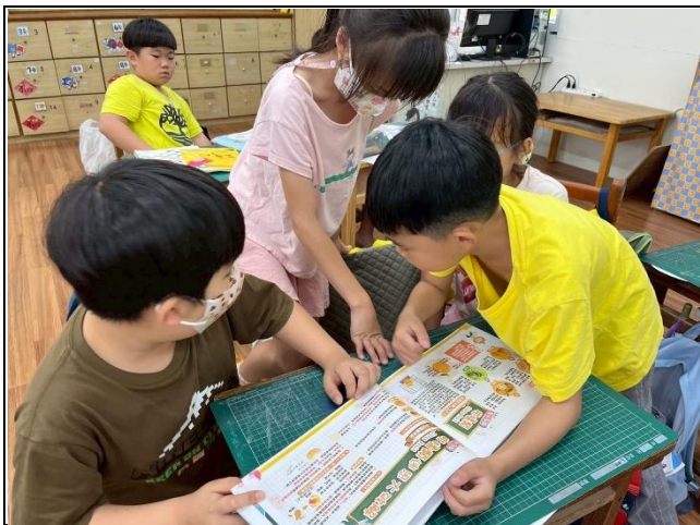
說明：入班推動餐前五分鐘專書