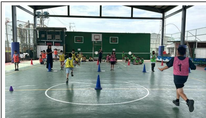
精彩畫面~上場前的吶喊!