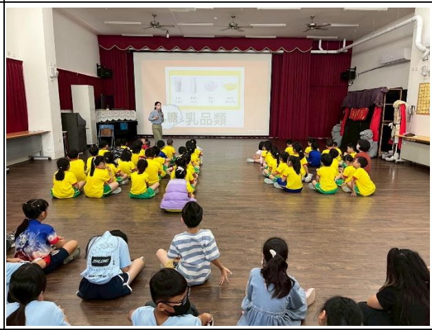
說明：乳品類含有乳糖