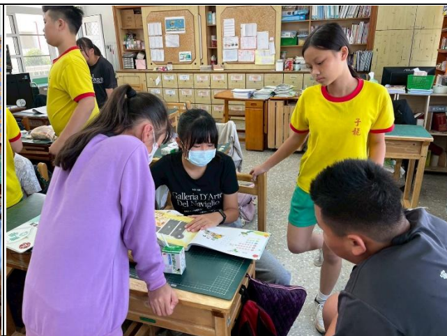
說明：入班推動餐前五分鐘專書