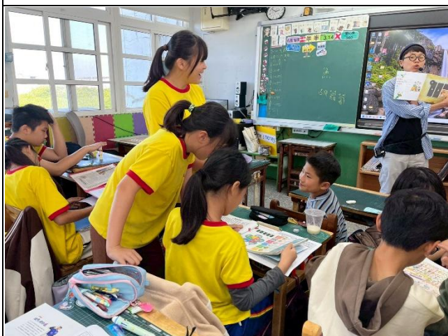
說明：入班推動餐前五分鐘專書