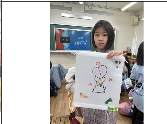
說明：參與活動獲得獎品~自畫紅蘿蔔束口袋