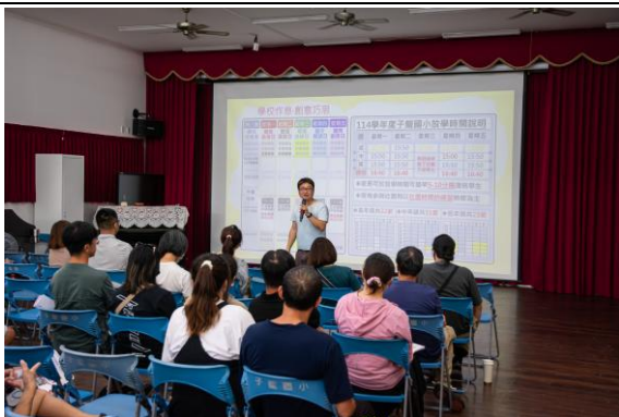
利用班親會向家長宣導學校健促的規劃