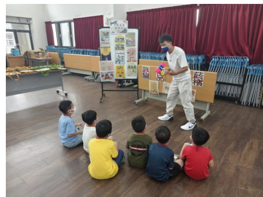
進行反菸癮、反霸凌宣導