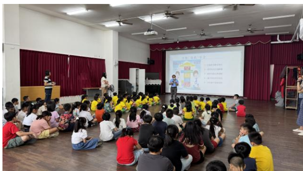
114學年度第一學期友善校園宣導~遊戲安全