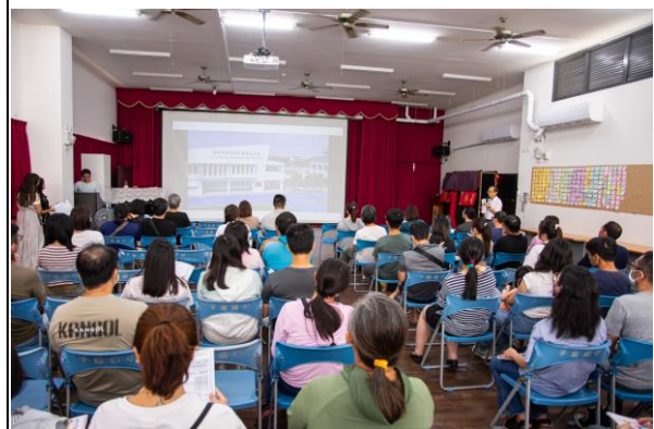
校長向家長介紹學校環境