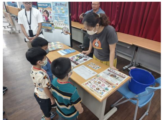
保健室為孩子進行衛教宣導