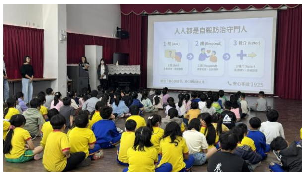
114學年度第二學期友善校園宣導~自殺防治守門人(心理衛生)