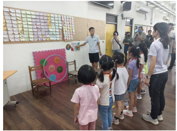
迎新關卡佈置~健康促進