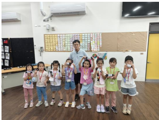
贈送小朋友每人一條跳繩