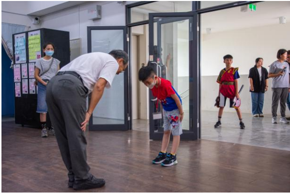
有禮貌的向校長敬禮