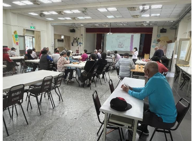
說明：邀請護理師蒞校為社區民眾講解醫病溝通的方式與重要性