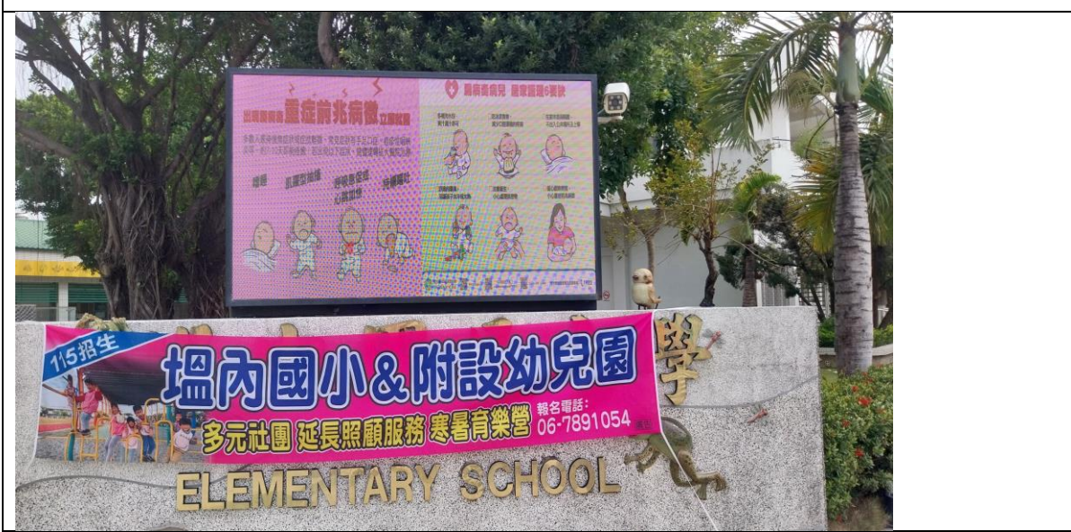
說明：透過校門口電視牆宣導防治腸病毒資訊