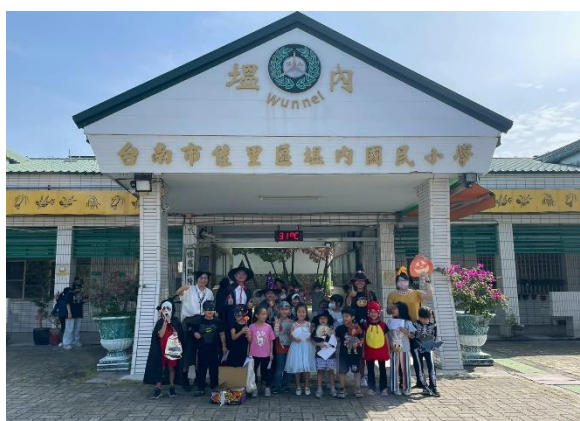
萬聖節活動，師生裝扮進行闖關活動