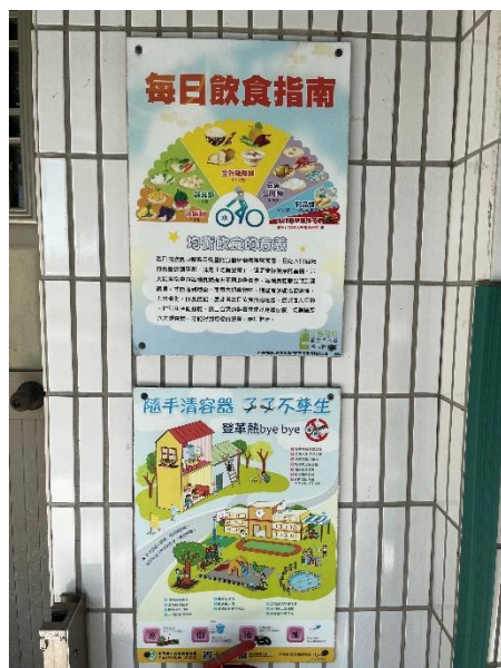
走廊張貼各項海報，提醒學生健康飲食、預防登革熱、節能減碳等資訊