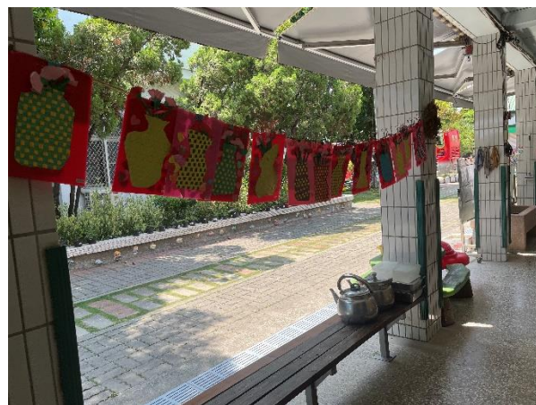
配合母親節，在教室外面布置海報、展示母親節卡片