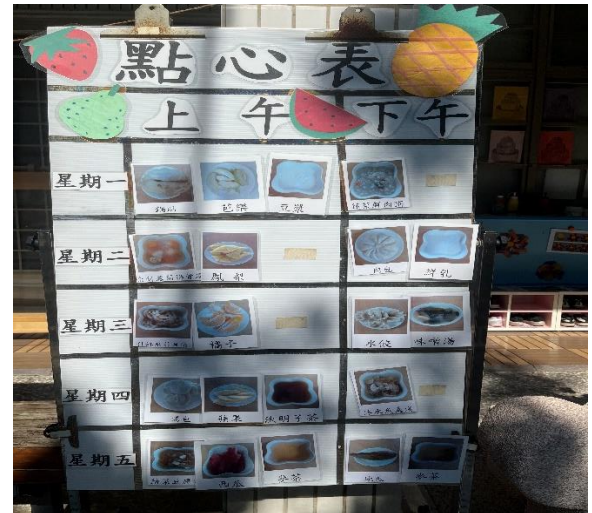
幼兒園利用看板在教室前面張貼午餐菜單及點心表