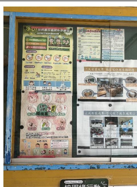
學校中廊張貼腸病毒防治海報