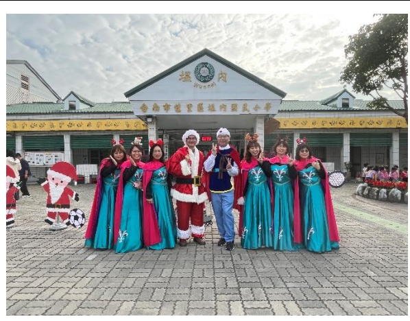
配合聖誕節，學校老師扮演相關角色與學生同歡