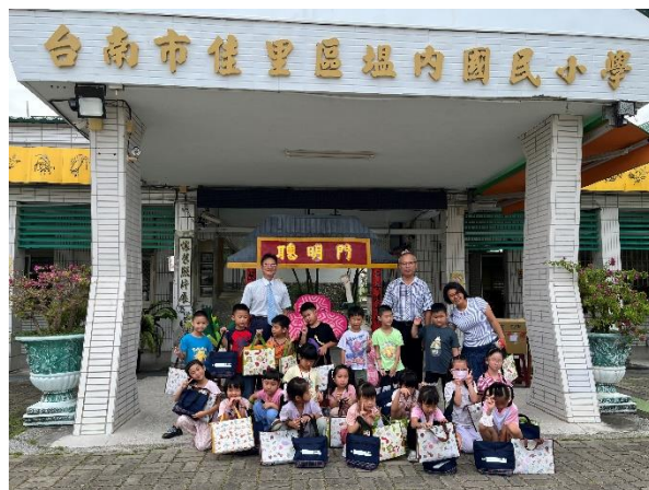
新生入學敲鑼後領取入學禮，並於聰明門前與校長合影；最後全班合影