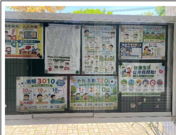
學校布告欄張貼健促議題海報，提醒學生實踐健康生活