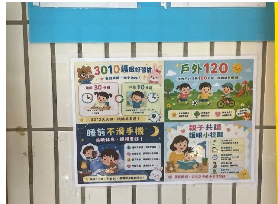
教室前走廊張貼保留遠視儲備、健促議題宣導海報