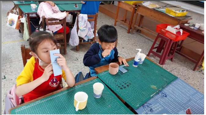
說明：學生藉由鏡子觀察自己的刷牙情形