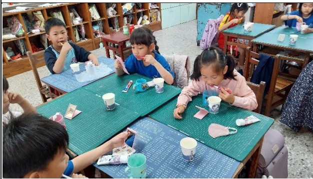
說明：全班練習潔牙方式