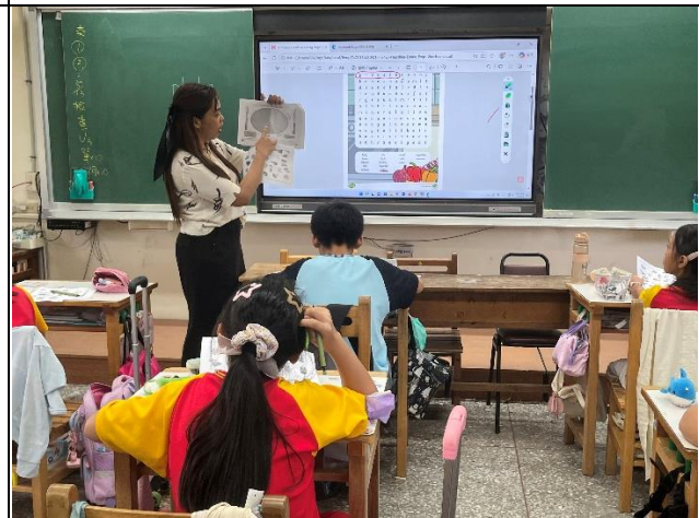
說明：外師指導學生習寫學習單，完成健康餐盤