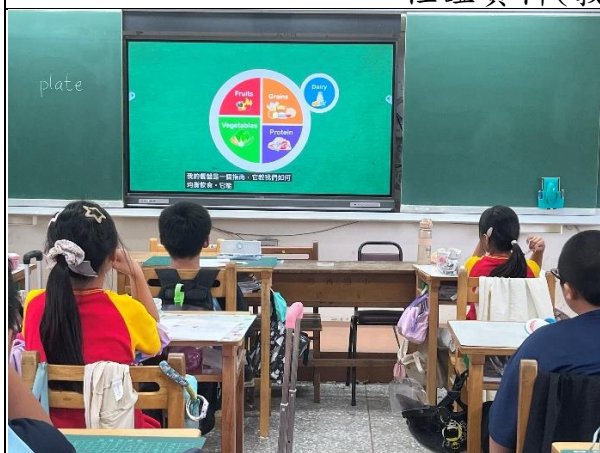
說明：健康餐盤包含五大類食物