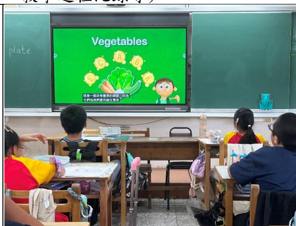
說明：蔬菜營養豐富，一定要多吃