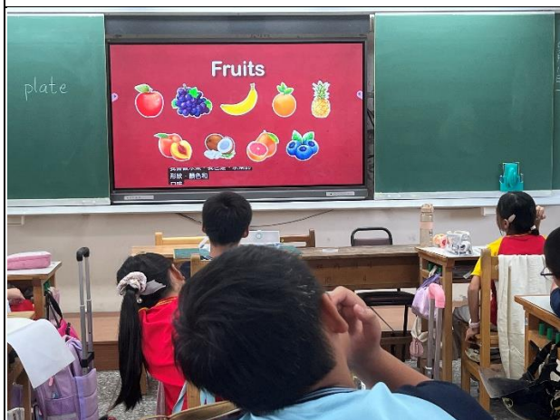
說明：圖文並茂理解單字意義