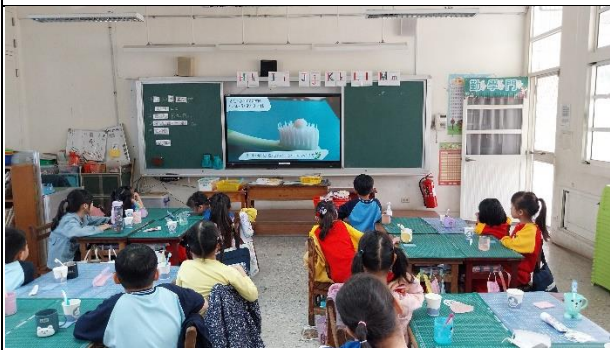
說明：指導學生牙膏的用量