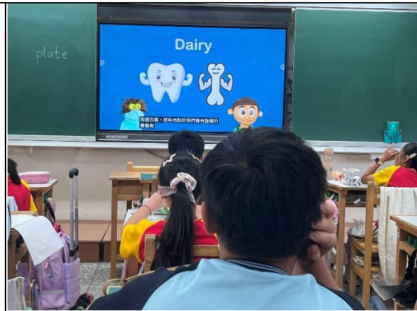
說明：學生不僅認識乳品類，更知道乳品類對身體的功能