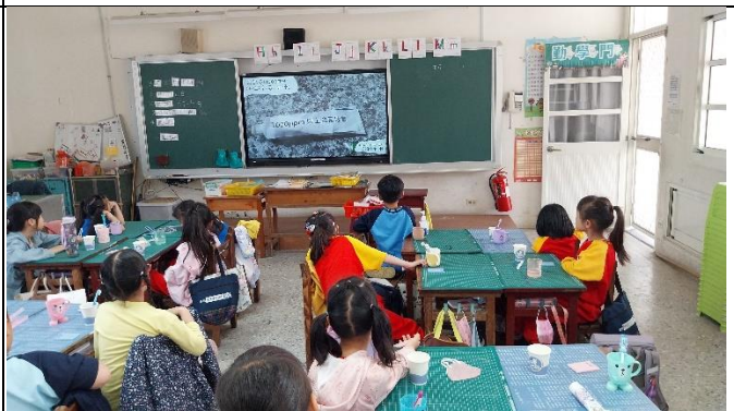
說明：透過影片讓學生了解潔牙需使用含氟牙膏