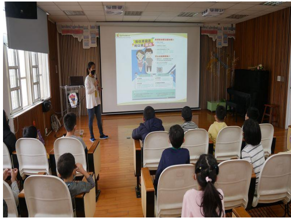
說明： 如何預防愛滋病及篩檢方式