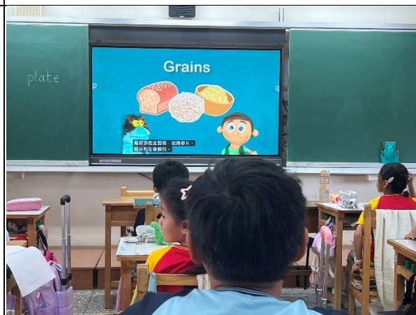
說明：全穀雜糧類是我們的主食