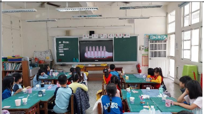
說明：指導學生牙刷刷頭大小及刷毛的選擇