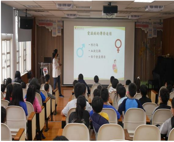
說明： 說明愛滋病成因及傳染途徑