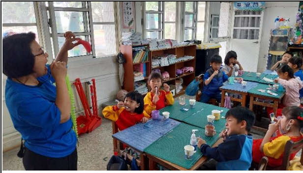
說明：教師示範潔牙要領