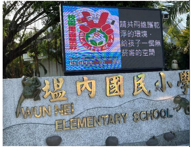
說明：營造無菸校園—校門口及通道禁菸標誌