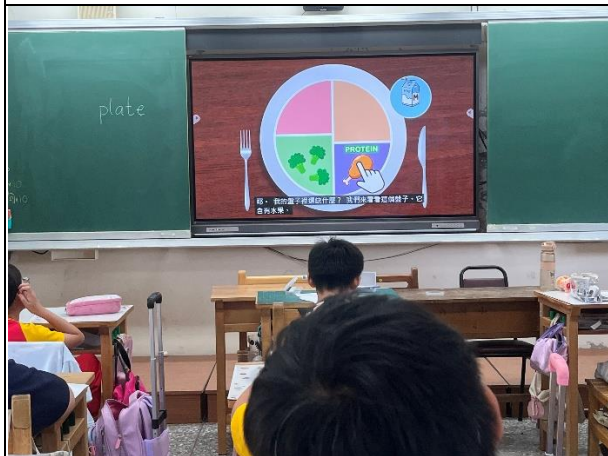
說明：請學生說出餐盤中缺少哪一類食物