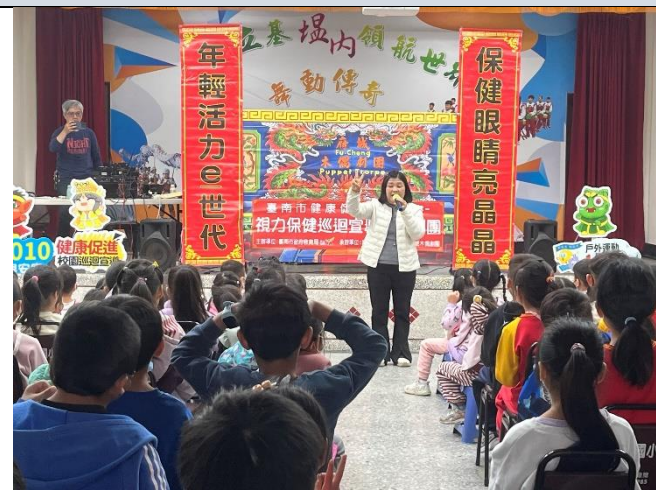
照片說明：歡迎府城木偶劇團蒞校宣導