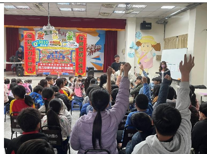
照片說明：有獎徵答踴躍舉手回答