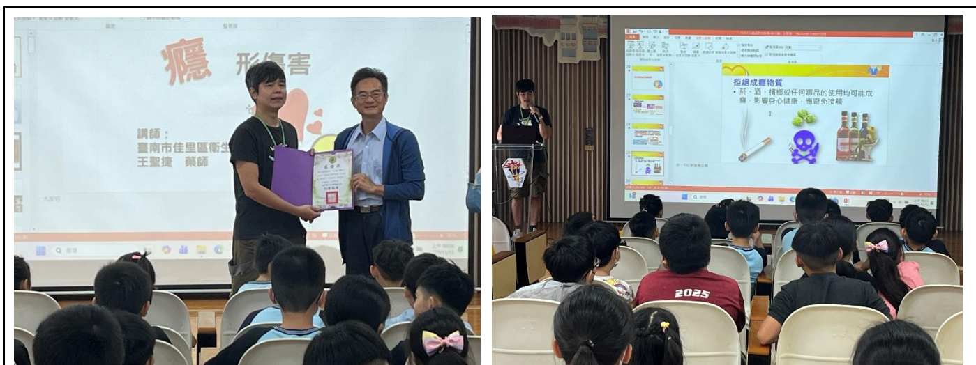
說明：衛生所藥師蒞校進行反毒宣導活動