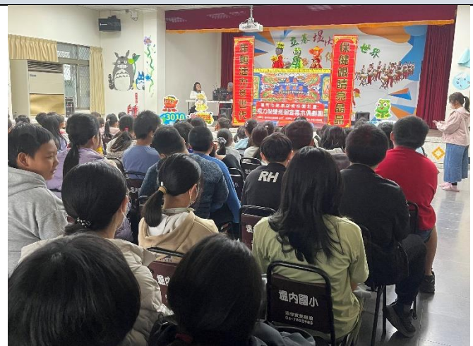
照片說明：學生專注觀賞演出