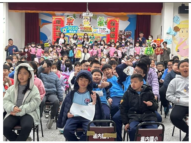
照片說明：表演結束全體大合照