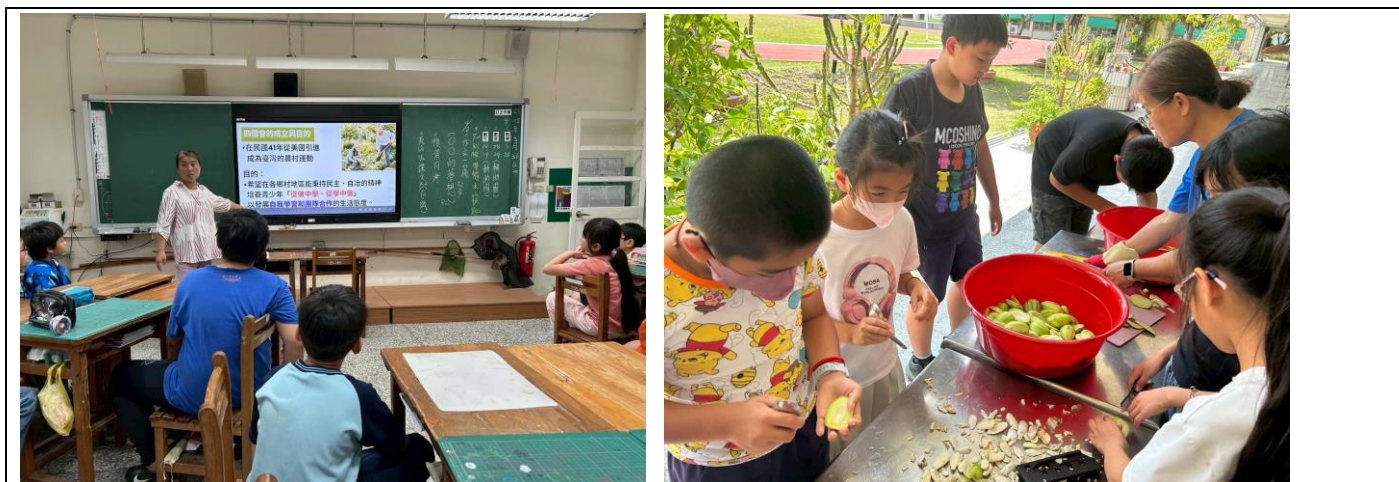
說明：佳里區農會的四健會配合學校特色，進行芒果青製作教學