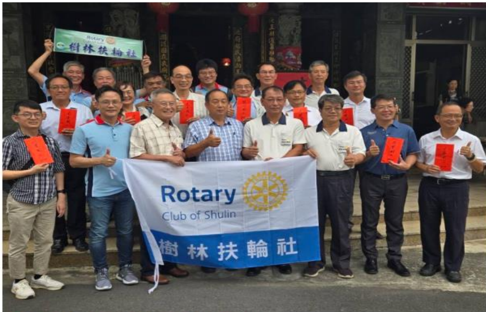
佳里池安宮連續20年捐贈獎學金幫助學童

【記者田進山／台南報導】佳里區玉勅池安宮座落在佳里區忠孝東路上，主祀神尊為池府千歲及文昌帝君。基地規模不大，但在六安里東勢角及各地信眾的護持下，與歷任主任委員用心經營願務，辦理多元的社會服務，委監成員團結和諧，幫助民眾排難解疑，深得地方的敬重與肯定，曾榮獲台南市政府獎勵之宗教團體參與社會服務績優社團，榮獲市長頒贈獎狀，以資鼓勵。