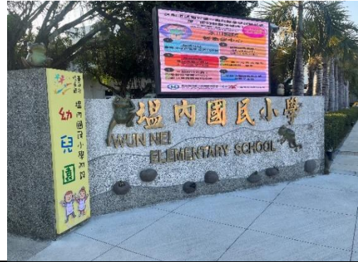
說明：學校透過電視牆向社區民眾進行各項健康促進、衛生相關議題宣導