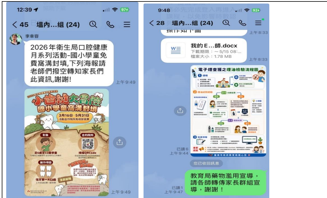
說明：透過學校賴群組發布健康訊息，請導師將訊息轉達到各班家長群組