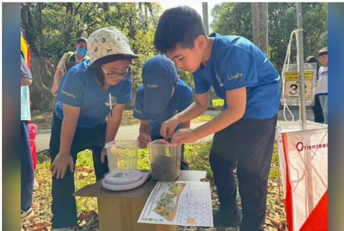
走出戶外共學，南市樹人國小等4所偏區小學推廣定向越野上了寶貴一課。