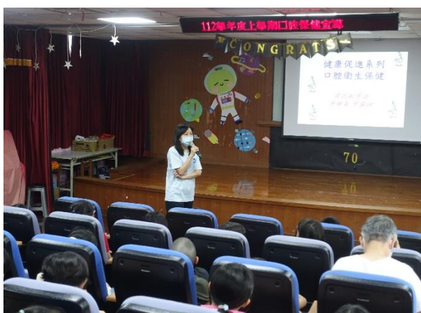
說明：校護向家長宣導「口腔保健」的重要