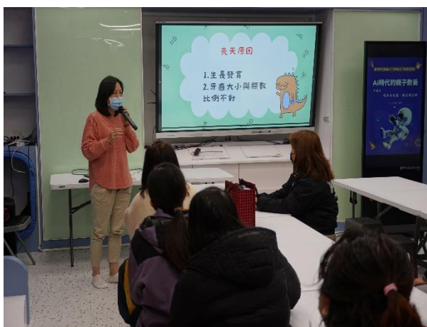
說明：校護向家長宣導「牙齒咬合處置」。