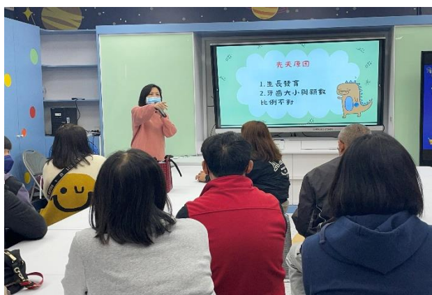
說明：護理師分享牙齒咬合成因。