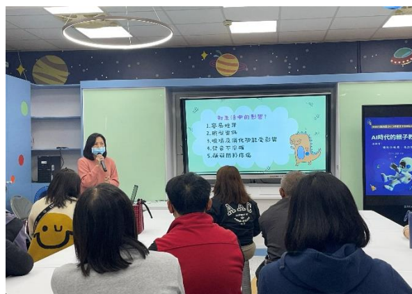
說明：護理師分享牙齒咬合對生活的影響。