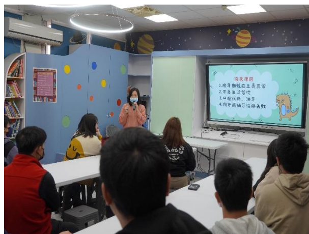
說明：向家長說明牙齒咬合的成因。