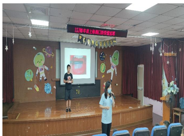
說明：護理師進行口腔衛生保健的宣導。