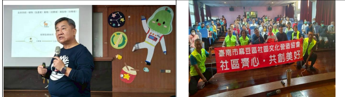
說明：介紹農藥分解