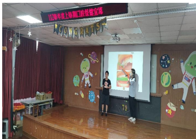
說明：護理師宣導正確刷牙的方式。