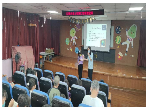
說明：護理師透過教具向家長說明刷牙方式