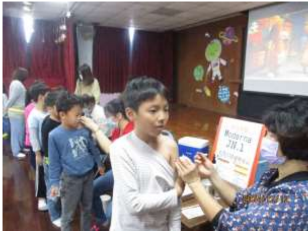
說明：113.12.12 國小部學生施打 Moderna JN.1 疫苗