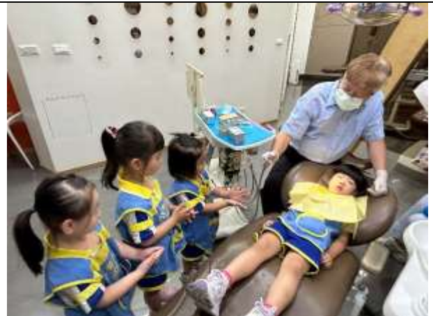
說明：1150428_幼兒園小班幼兒體驗牙科治療