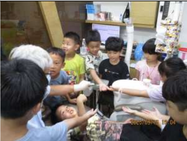
說明：1140916_一年級新生參觀體驗牙科診所