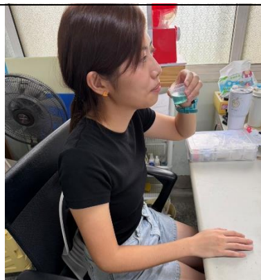
說明：導師們一起參與每週漱口水使用