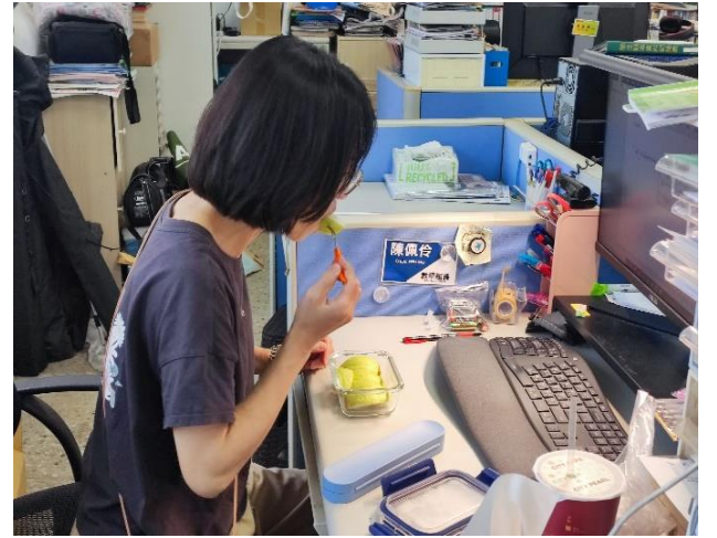
說明：導師成為學生榜樣-自帶水壺、喝足白開水