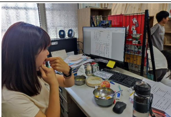
說明：高年級導師於飯後使用牙線潔牙