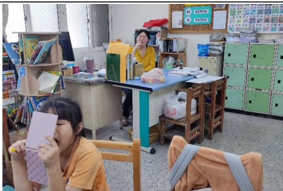
說明：三年級導師與學生一起在位置上潔牙