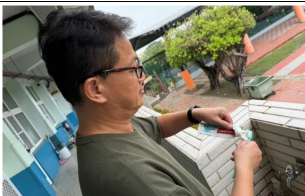
說明：校長餐後潔牙並使用含氟牙膏