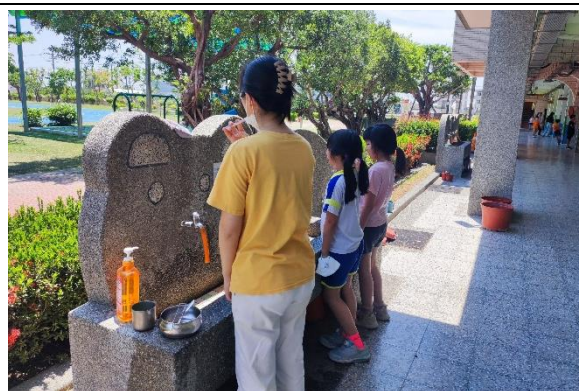
說明：低年級導師於洗手台進行飯後潔牙