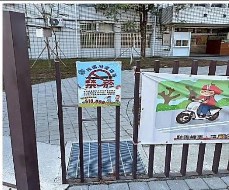
說明：校園提供家長或社區民眾相關健康資訊