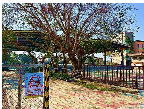
說明：側門門口張貼禁菸標語