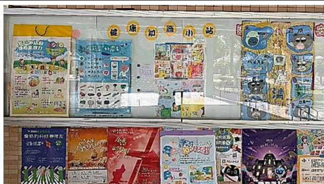
說明：校園提供家長或社區民眾相關健康資訊