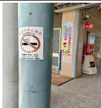
說明：走廊張貼禁菸標語