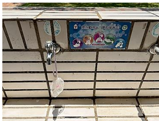
說明：校園提供家長或社區民眾相關健康資訊