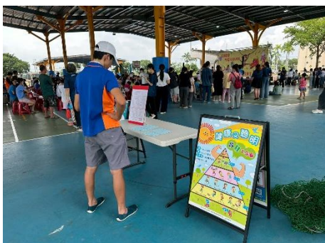
說明：校園提供家長或社區民眾相關健康資訊