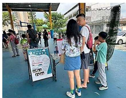
說明：校園提供家長或社區民眾相關健康資訊