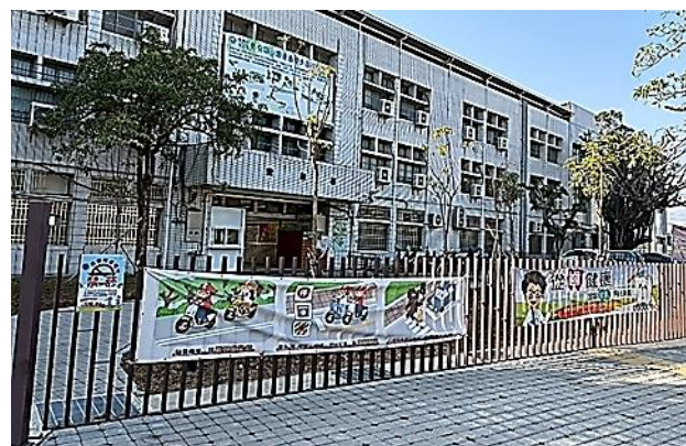
說明：校園提供家長或社區民眾相關健康資訊