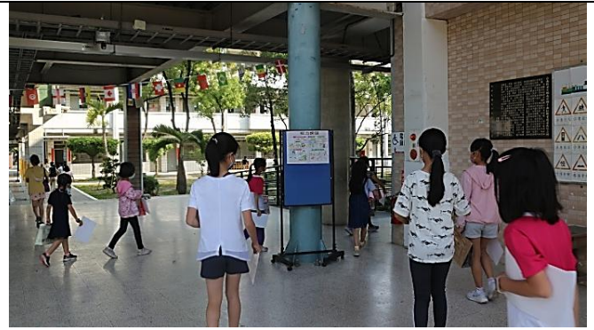
說明：穿堂海報展示，加深學生健康(健康體位、視力、食安、水域安全等)概念