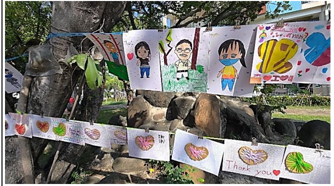
說明：教師節卡片展示，正向鼓勵學生勇敢說出感謝