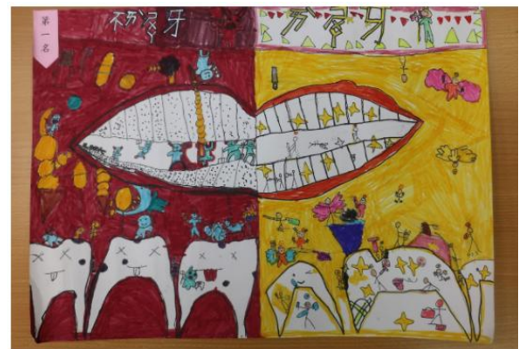
說明：運動會展示健促得獎海報，向家長與學生宣導健康概念