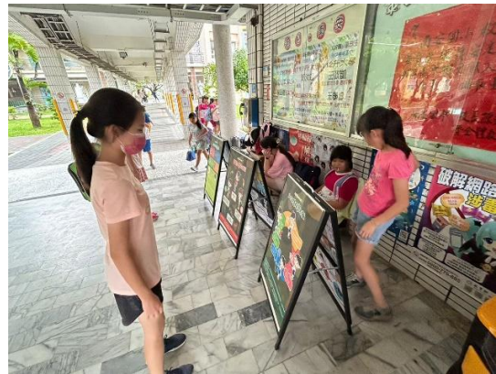
說明：通廊定期更新口腔保健、登革熱防治等健康專欄，學生樂於閱讀與分享