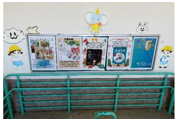
說明：圖書館好書推薦，讓閱讀與健康概念自然融合