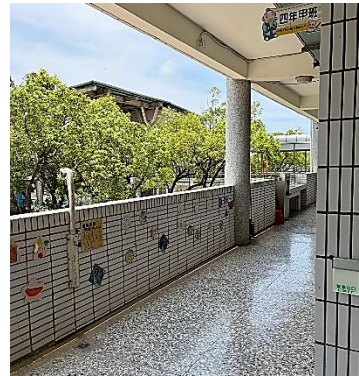
說明：教室外布置-健康5蔬果，營養多更多