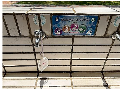
說明：洗手台美化、定期補充肥皂和洗手乳-提醒勤洗手