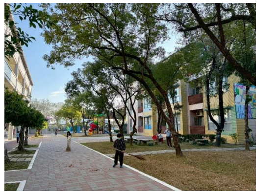
說明：清掃校園 4-東側草皮