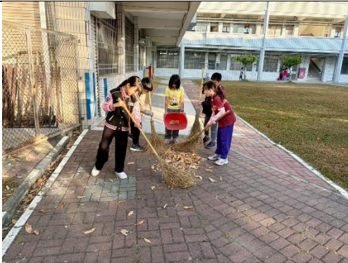
說明：清掃校園 5-水塔旁