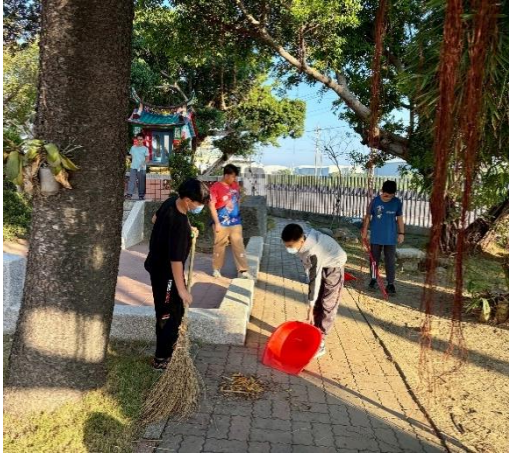
說明：清掃校園 1-小孔廟