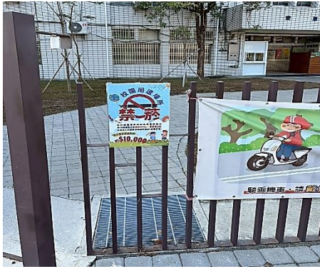
說明：大門口設置禁菸標語