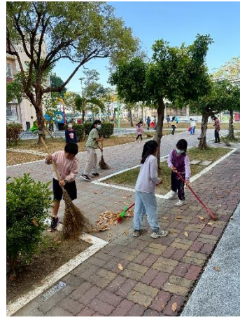
說明：清掃校園 2-西側草皮