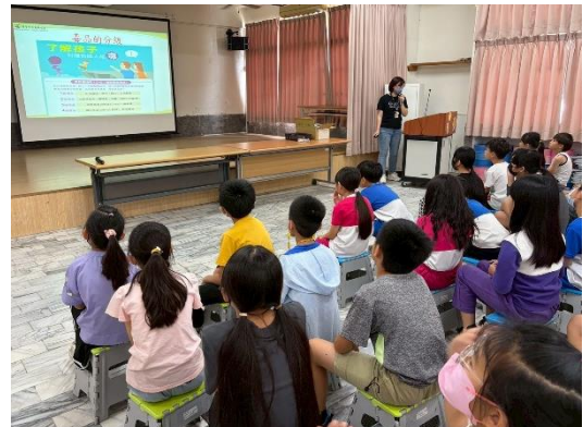
說明：衛生所入校-反毒宣導 2