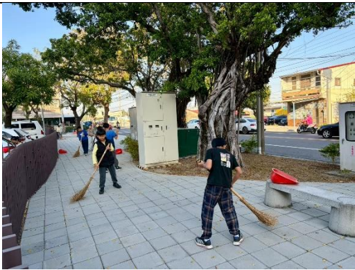
說明：清掃校園 3-通學步道