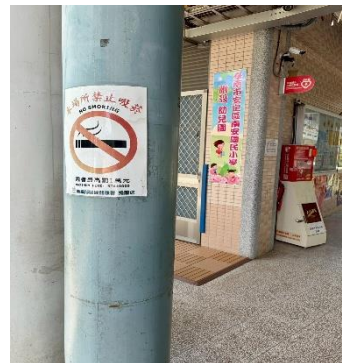
說明：走廊張貼禁菸標語