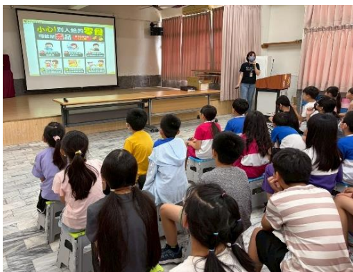
說明：衛生所入校-反毒宣導 1