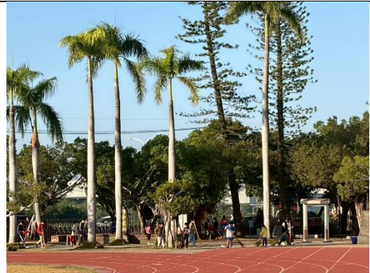
說明：清掃校園 6-椰林大道