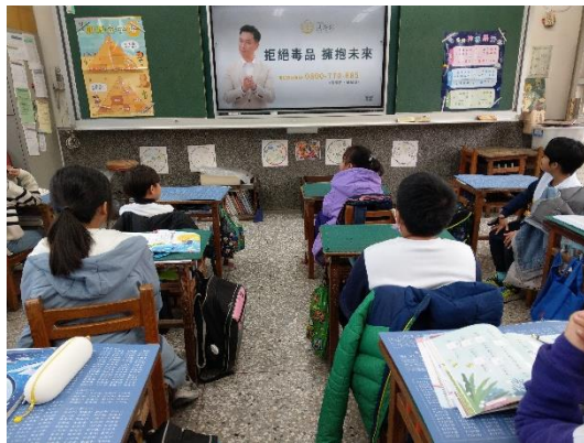
說明：班級-觀看反毒影片