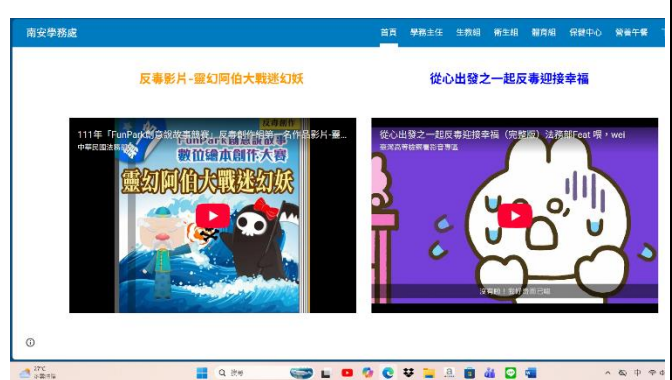
說明：校網-反毒影片宣導