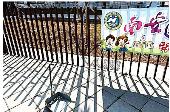
說明：定期巡檢校園菸蒂