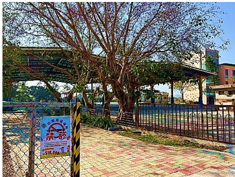
說明：側門門口張貼禁菸標語