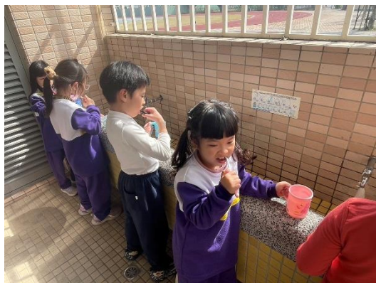
說明：1年級餐後潔牙與漱口水