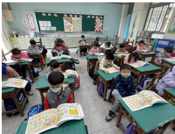
說明：低年級閱讀餐前5分鐘專書