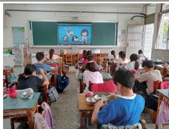
說明：6 年級餐前五分鐘