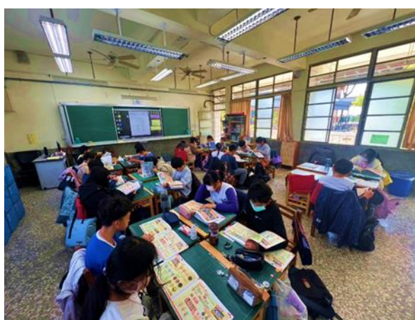
說明：高年級閱讀餐前5分鐘專書