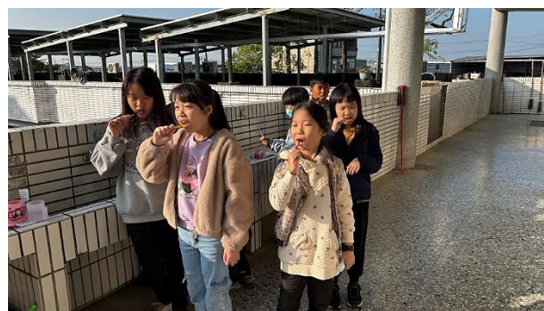
說明：4年級餐後潔牙與漱口水