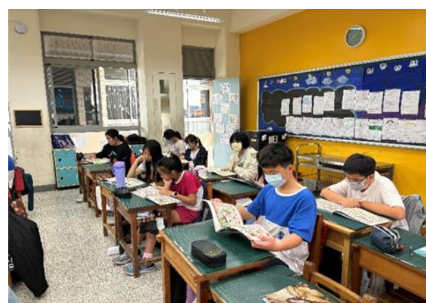
說明：高年級閱讀餐前5分鐘專書