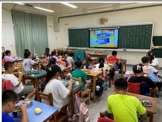
說明：5 年級餐前五分鐘