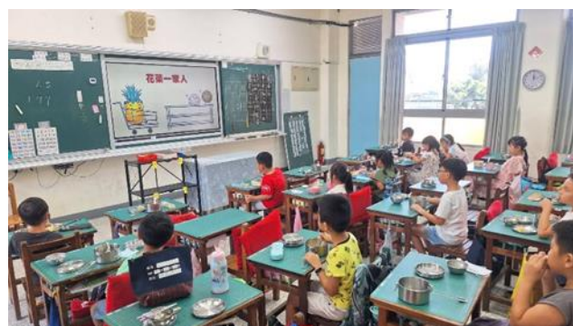
說明：2 年級餐前五分鐘