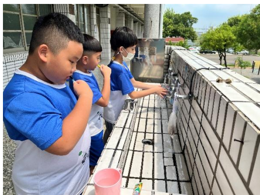
說明：3年級餐後潔牙與漱口水