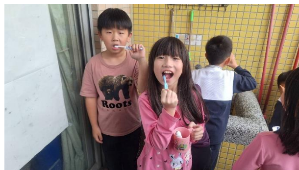
說明：2年級餐後潔牙與漱口水