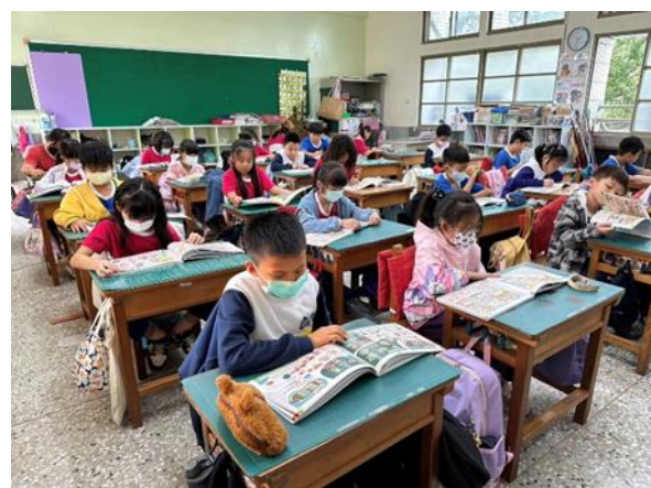
說明：中年級閱讀餐前5分鐘專書