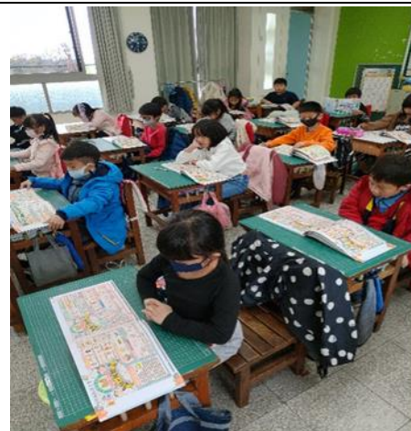
說明：低年級閱讀餐前5分鐘專書