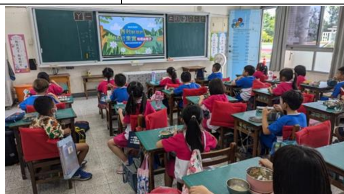
說明：1 年級餐前五分鐘