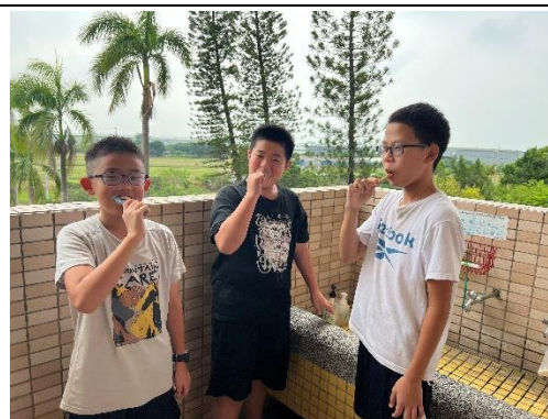
說明：6年級餐後潔牙與漱口水