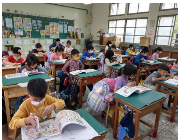
說明：中年級閱讀餐前5分鐘專書