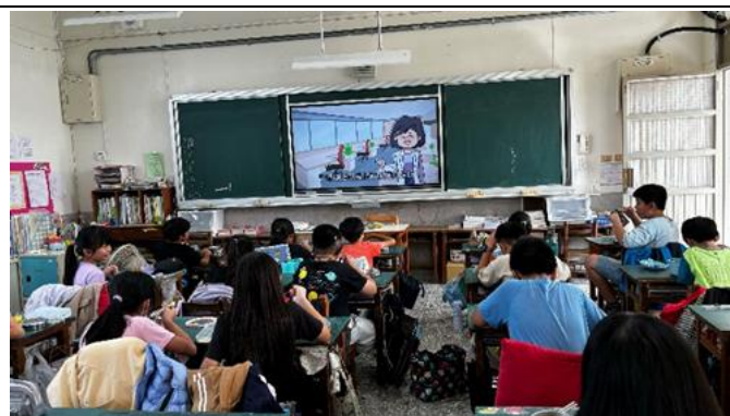
說明：4 年級餐前五分鐘