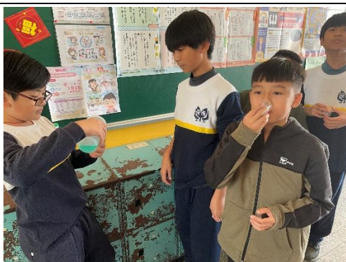
說明：5年級餐後潔牙與漱口水