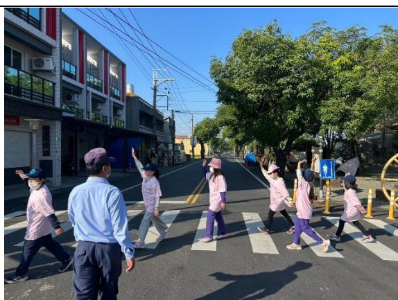
說明：5 參與食農教育-舉手過馬路-實例