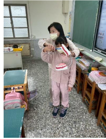
說明：貝氏刷牙法-教具指導