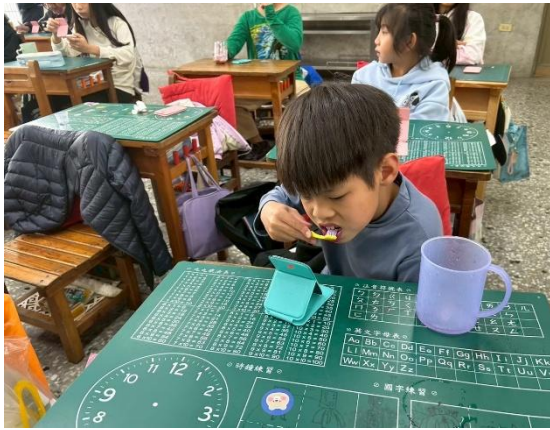
說明：門牙也要刷喔！