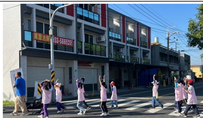
說明：6 參與食農教育-舉手過馬路-實例