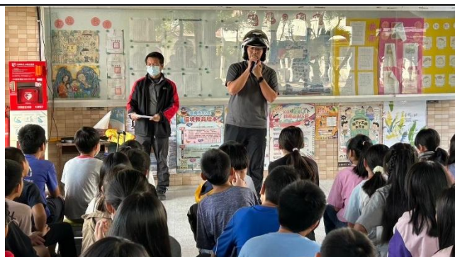
說明：3 交通安全-騎車請戴安全帽