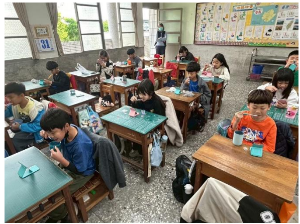
說明：我在刷左上後牙舌側面