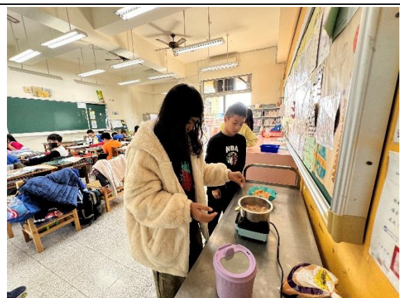
說明：6 午餐加菜囉~安全健康又美味