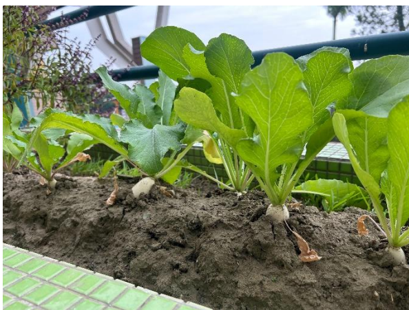
說明：5 收成(九層塔、白蘿蔔)