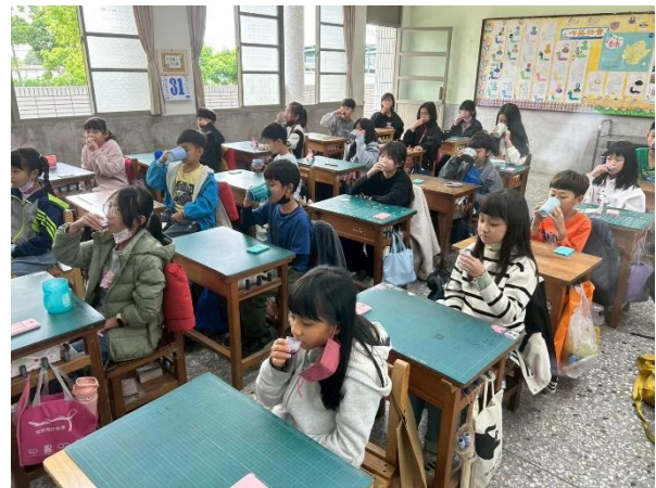
說明：潔牙後搭配漱口水