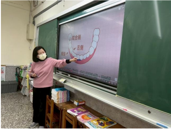
說明：刷出正確的位置