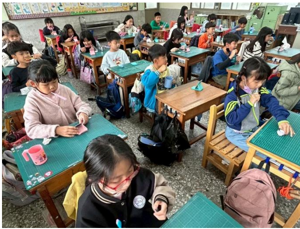
說明：我在刷右下後牙頰側面