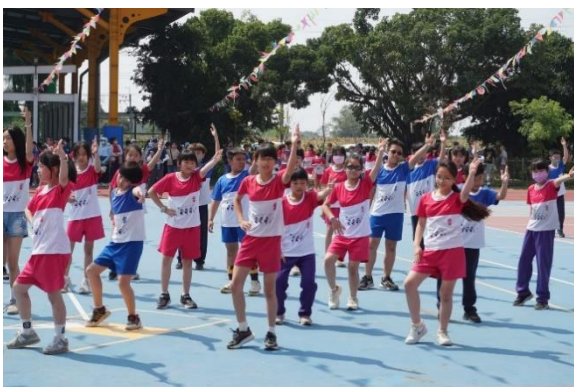
說明：高年級大會舞表演