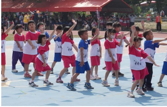
說明：低年級活力律動操