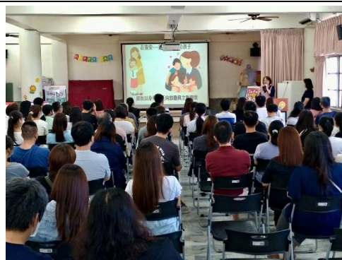
說明：健促六大議題宣導- 輔導主任