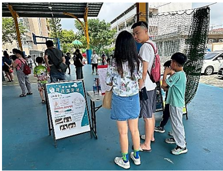
說明：宣導貝氏刷牙法-家長仔細閱讀