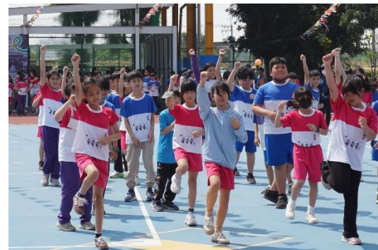
說明：中年級大會舞表演