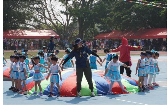
說明：幼兒園活力律動操