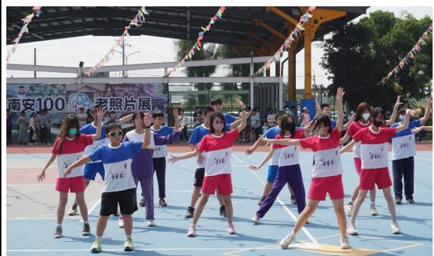
說明：高年級大會舞表演