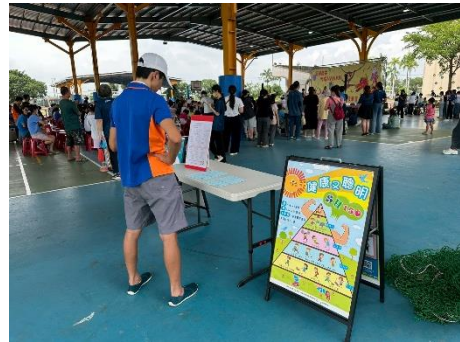
說明：宣導 SH150-家長仔細閱讀