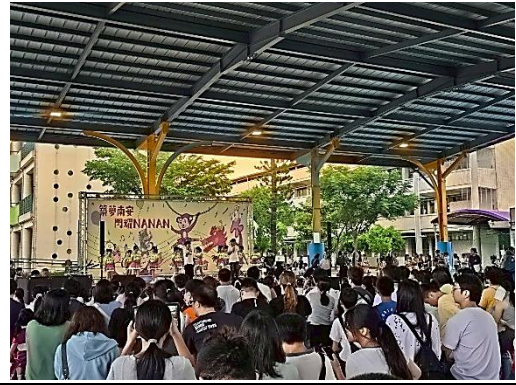
說明：家長熱情參與，觀賞學生精彩演出