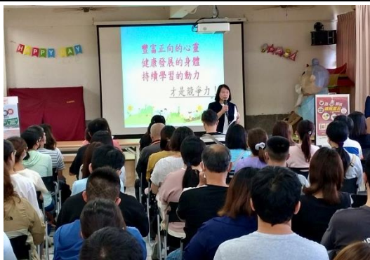
說明：健促六大議題宣導- 校長