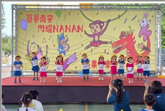
說明：海豚班-大近視-台語歌謠