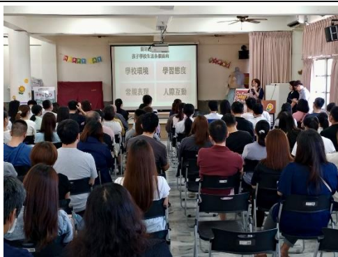
說明：健促六大議題宣導- 輔導主任