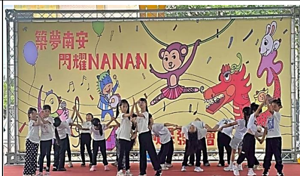
說明：二年級帶動唱