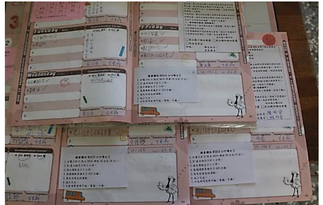
說明：聯絡簿轉知家長健康小秘訣宣導單