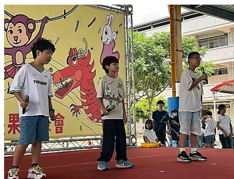
說明：五年級歌唱表演