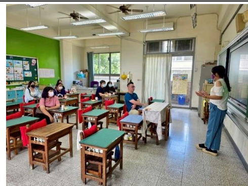
說明：健促六大議題宣導- 導師