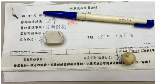
說明：聯絡簿轉知家長健康小秘訣宣導單