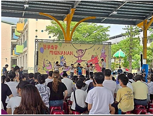
說明：家長熱情參與，觀賞學生精彩演出