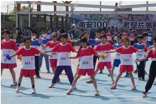
說明：中年級大會舞表演