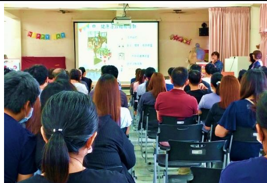
說明：健促六大議題宣導- 學務主任