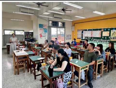
說明：健促六大議題宣導- 導師