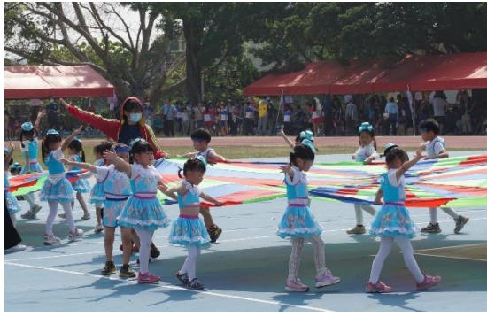
說明：幼兒園活力律動操