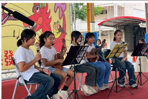
說明：烏克麗麗彈唱