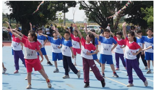
說明：低年級活力律動操