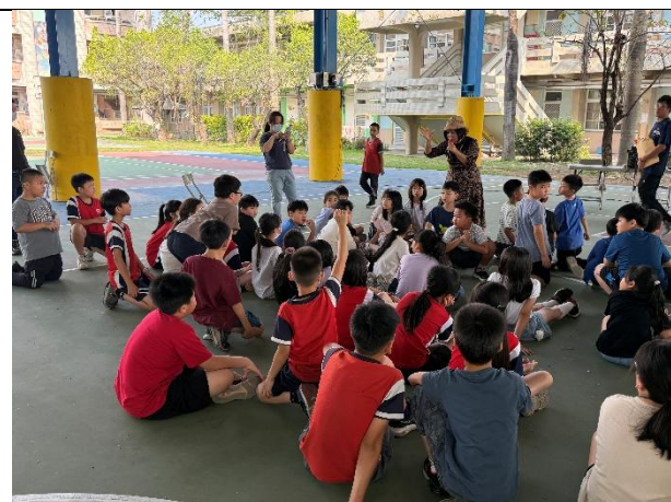
照片說明：有獎徵答