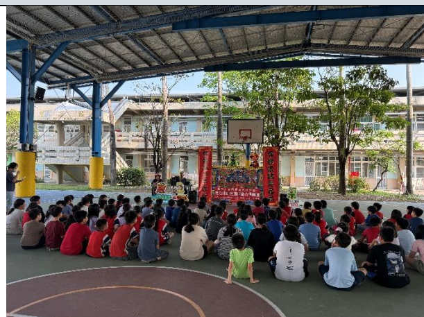
照片說明：學生專心投入欣賞宣導