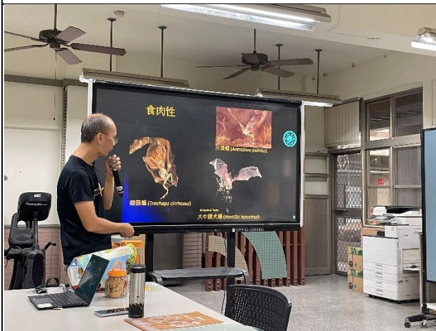
說明：教師黃金蝙蝠課程增能研習