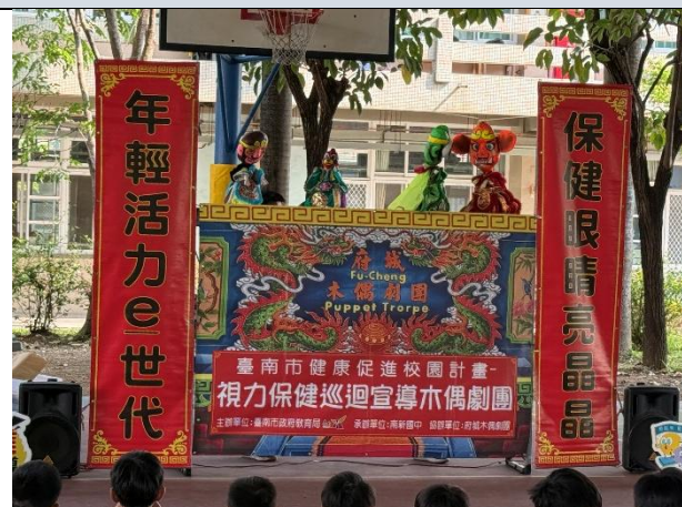
照片說明：劇團人員奮力演出