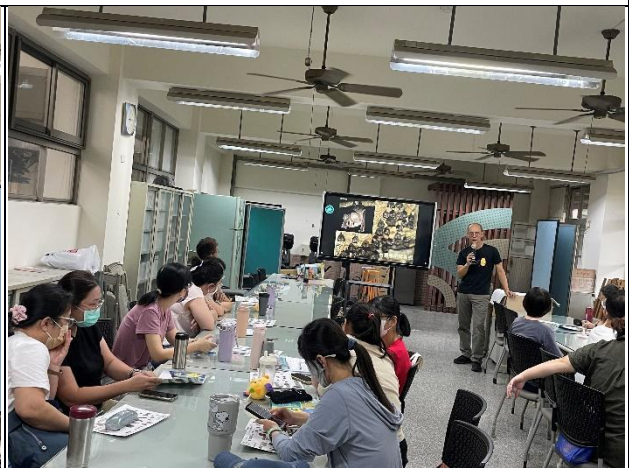
說明：教師黃金蝙蝠課程增能研習