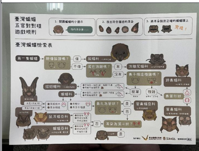
說明：教師黃金蝙蝠課程增能研習