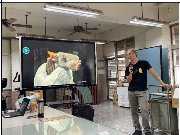
說明：教師黃金蝙蝠課程增能研習