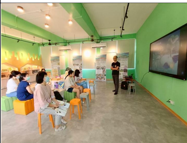
說明：黃金蝙蝠館志工增能研習