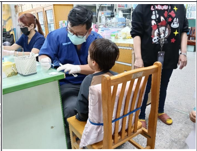
說明：幼兒園學生牙齒塗氟