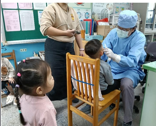
說明：幼兒園塗氟及口腔檢查實施紀錄