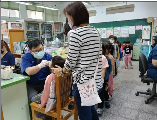
說明：幼兒園學生牙齒塗氟