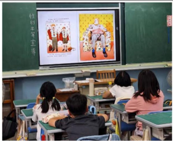
說明：114 學年第二學期三年級教學成果 朱家故事繪本教學