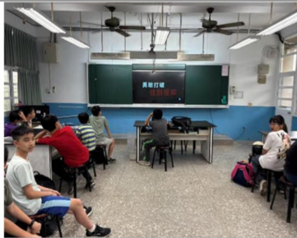
說明：114 學年第一學期六年級教學成果 影片教學：職業不分性別