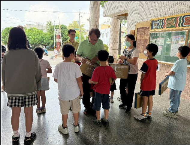
說明：快樂行善團送月餅