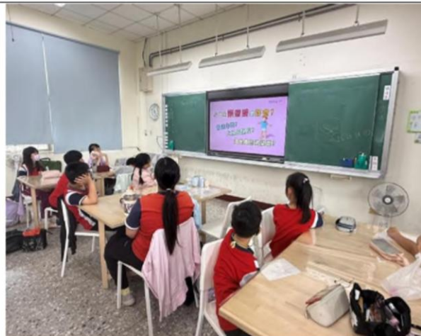
說明：114 學年第一學期五年級教學成果 影片教學：引導孩子正確看待情感