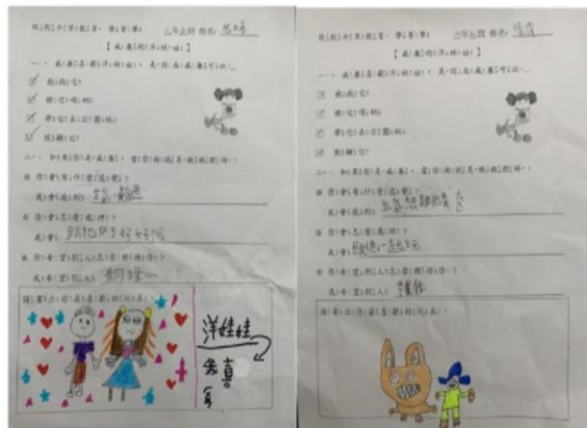
說明：114 學年第一學期二年級教學成果 繪本學習單：威廉的洋娃娃