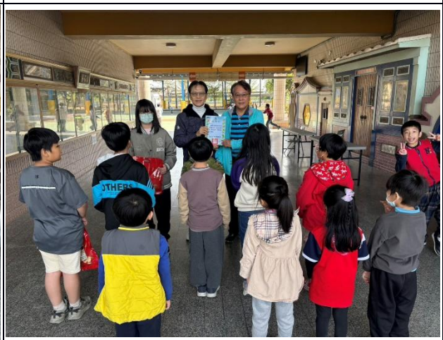
說明：快樂行善團送暖新年菜