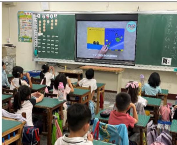
說明：114 學年第一學期一年級教學成果 繪本教學：介紹不同家庭組成