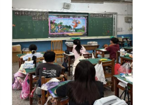
說明：114 學年第二學期四年級教學成果 龍阿蠻繪本：性別歧視的消除