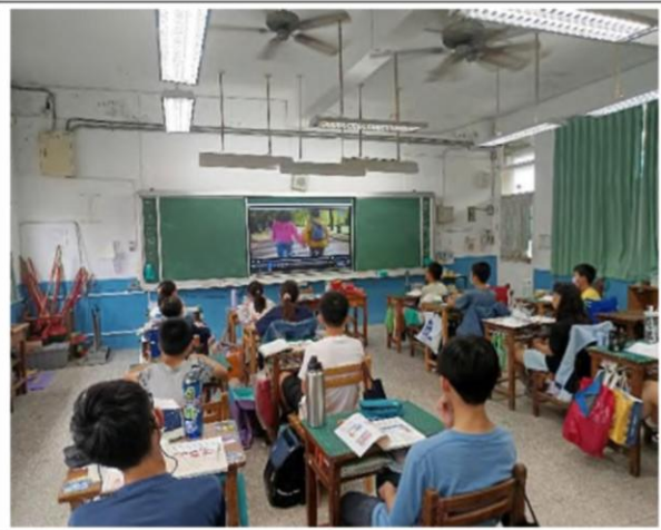
說明：114 學年第二學期六年級教學成果 學習判斷危險情境與練習拒絕及求救方式