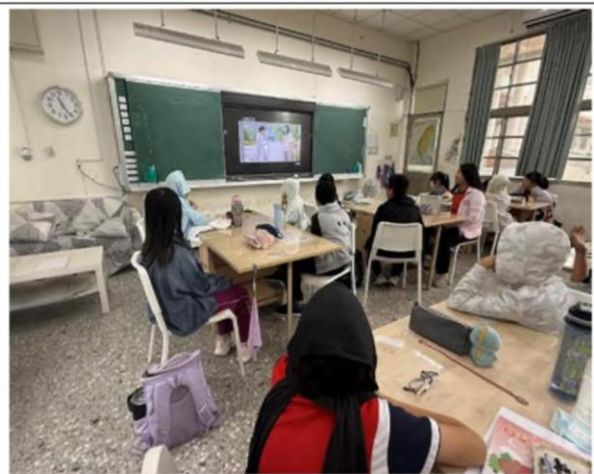
說明：114 學年第二學期五年級教學成果 評判媒體廣告是否有性別刻板印象