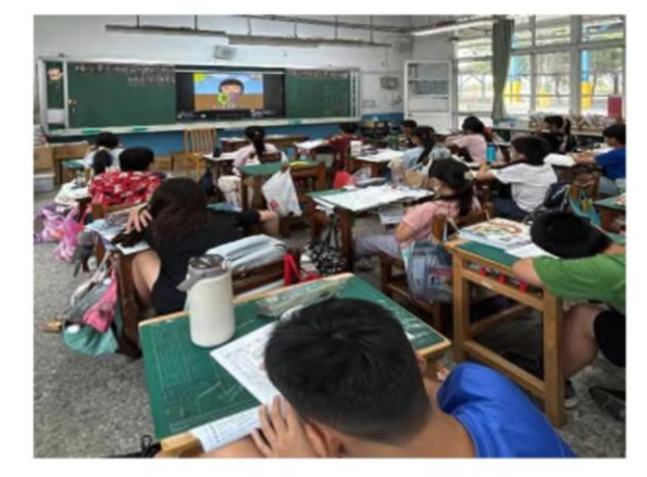
說明：114 學年第一學期四年級教學成果 身體界線與身體自主權宣導