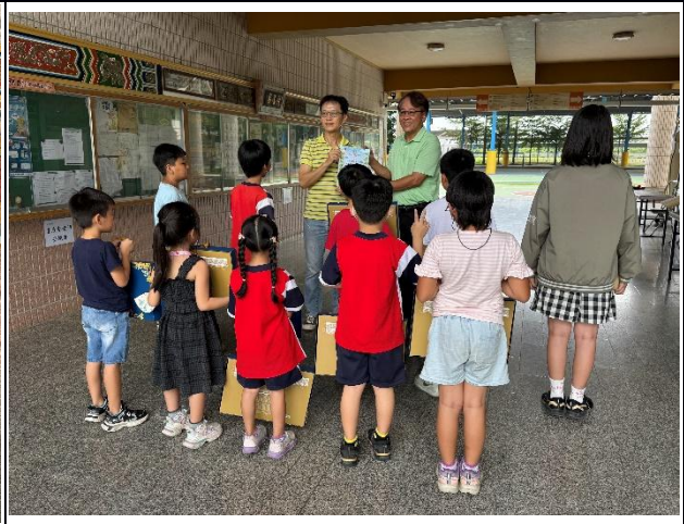
說明：快樂行善團送月餅