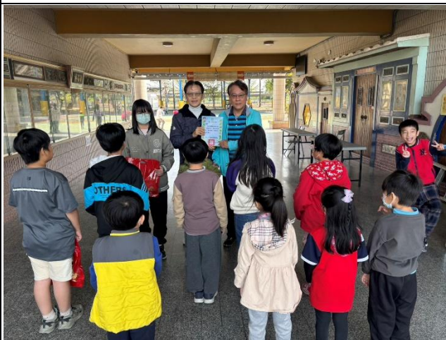
說明：快樂行善團送暖新年菜