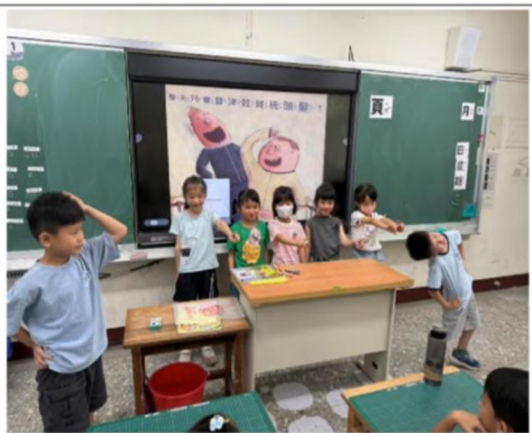
說明：114 學年第二學期一年級教學成果 繪本教學：介紹男女特質/性別刻板印象