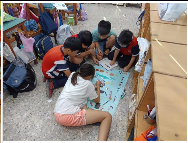
說明：高年級-設計菜單