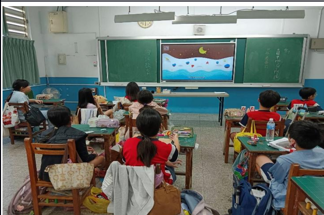
說明：六年級-海洋教育