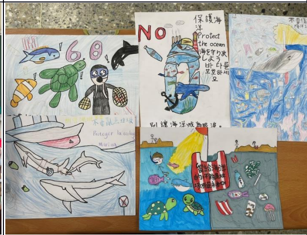
說明：五年級-製作海洋教育宣導海報