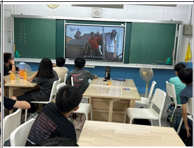
說明：高年級-認識蔗糖製作