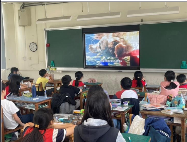
說明：五年級-海洋教育