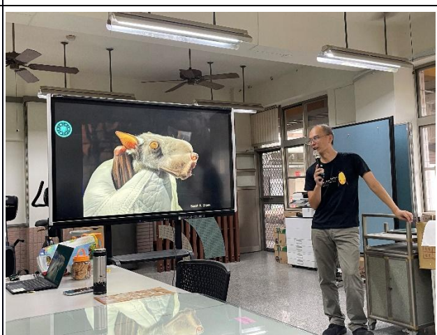
說明：教師黃金蝙蝠課程增能研習