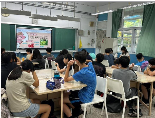
說明：高年級-白蓮霧產地. 挑選技巧