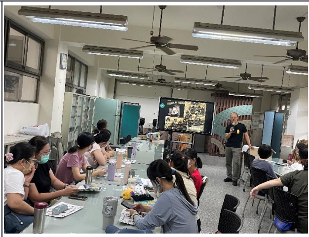
說明：教師黃金蝙蝠課程增能研習