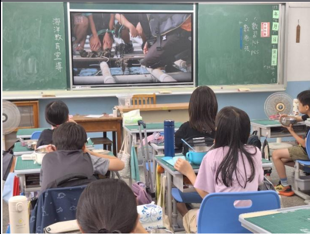
說明：三、四年級-海洋教育