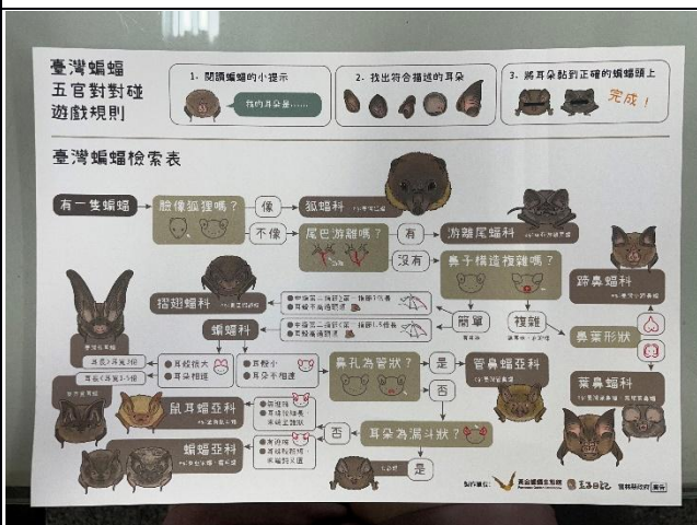
說明：教師黃金蝙蝠課程增能研習