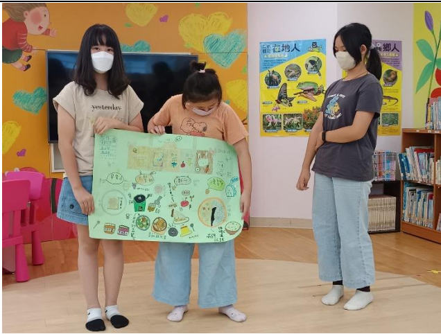
說明：高年級-設計菜單