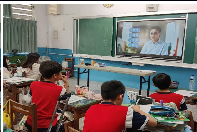
說明：六年級-知海.親海.愛海.護海