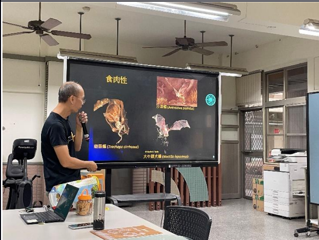
說明：教師黃金蝙蝠課程增能研習