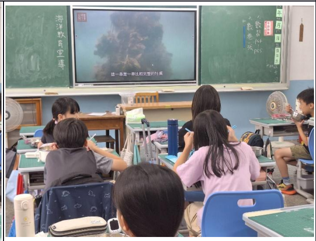
說明：三、四年級-海洋教育