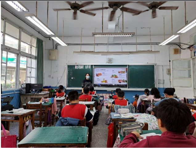
說明：中年級-食農教育