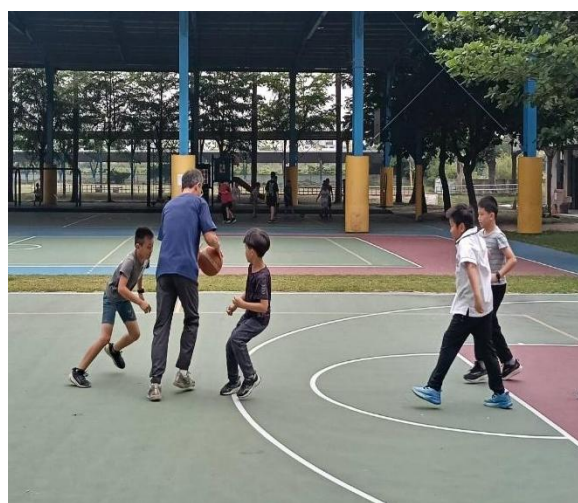
說明：下課時間主任帶領學生打籃球