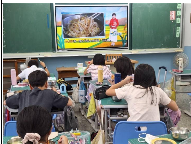
說明：5 月-跟著巷弄走，吃遍府城味