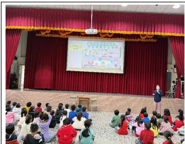
說明：登革熱防治宣導健康飲食宣導