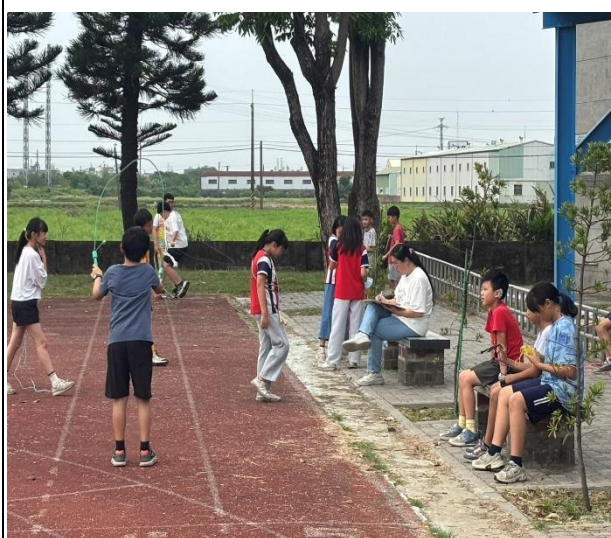
說明：晨間活動-導師帶領學生一起跑跳