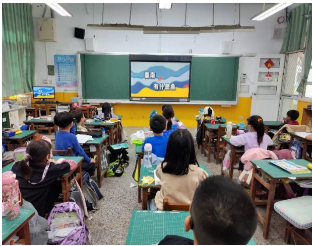
說明：12月-魚兒來報到，午餐中的海洋小英雄(豆魚蛋肉類)