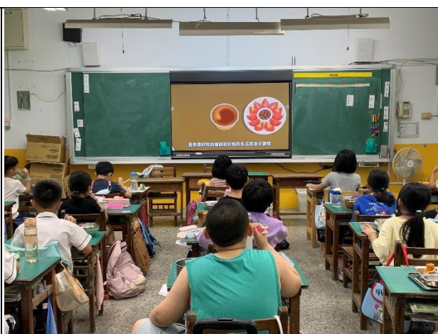
說明：5 月-跟著巷弄走，吃遍府城味