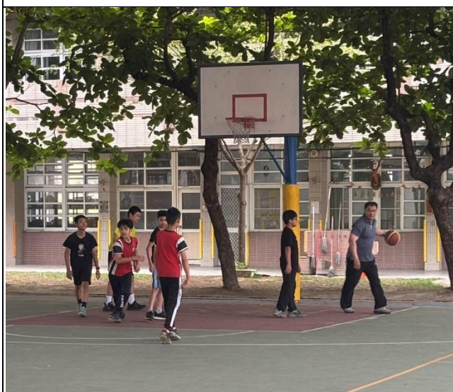
說明：晨間活動-導師帶領學生一起打球