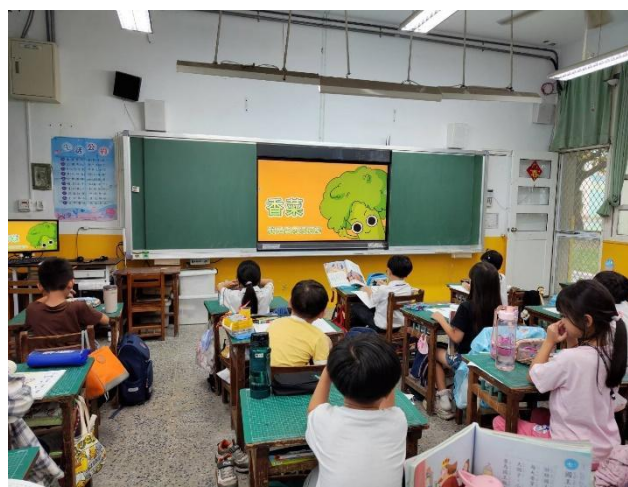
說明：11月-賦予料理靈魂的天然辛香料(蔬菜類)