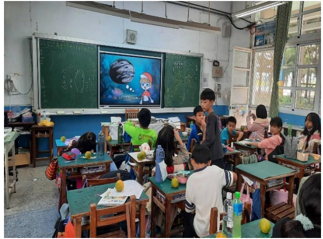
說明：12月-魚兒來報到，午餐中的海洋小英雄(豆魚蛋肉類)