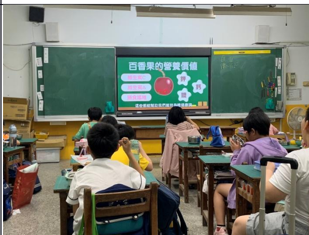
說明：4 月-探索漿果的迷人世界(水果類)