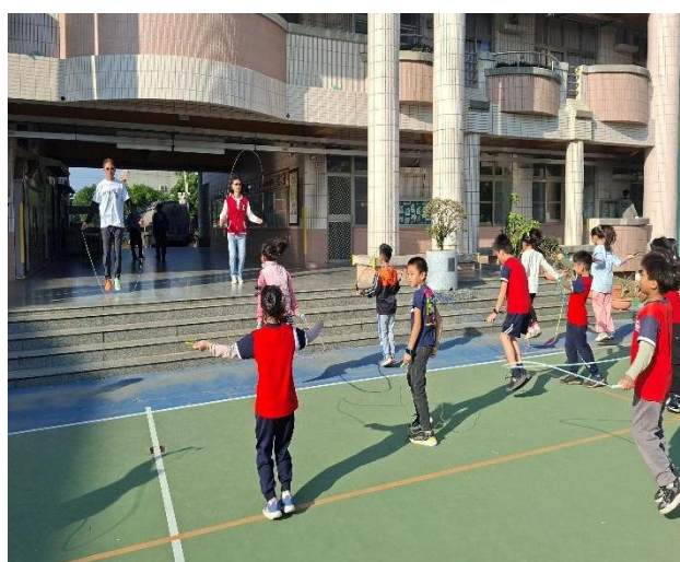
說明：下課時間校長帶領學生一起跳繩