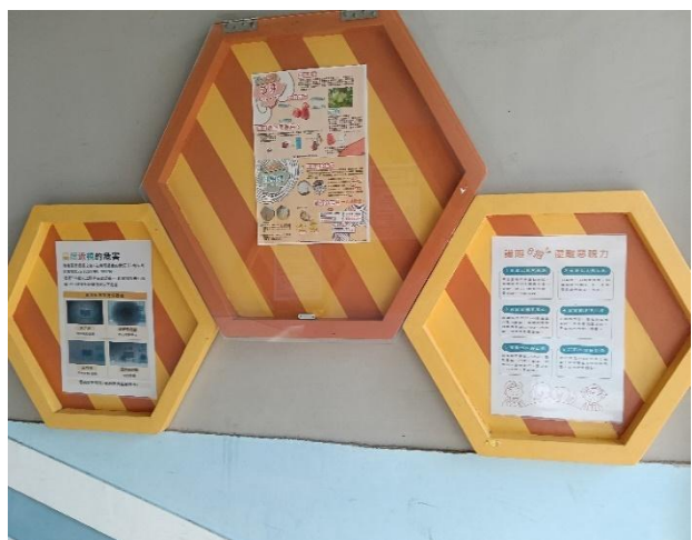
說明：健康廊道-張貼各式健康資訊。