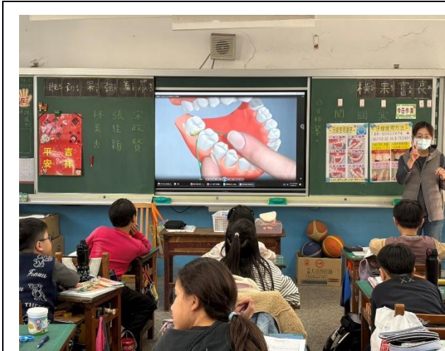
說明：護理師指導學生使牙線使用技巧