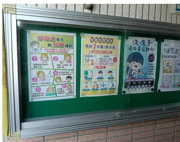
說明：健康專欄-張貼各式健康資訊。