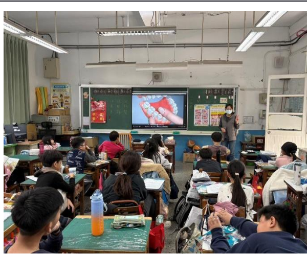
說明：護理師指導學生使牙線使用技巧