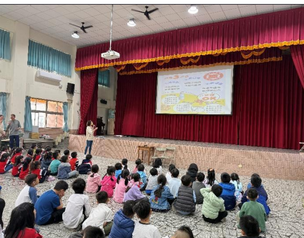
說明：健康飲食宣導