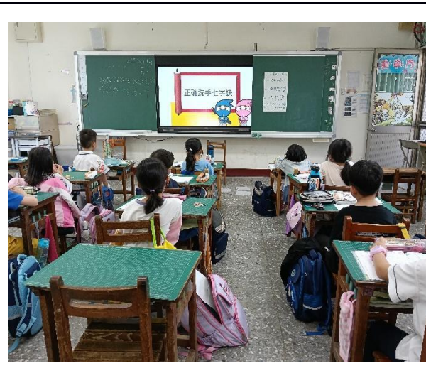
說明：理師入班對學生進行洗手衛教