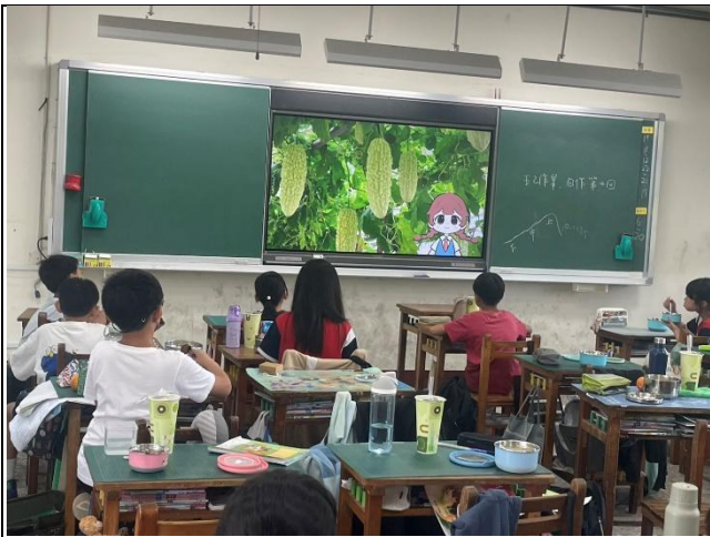
說明：3月-食材小勇士的味蕾闖關挑戰