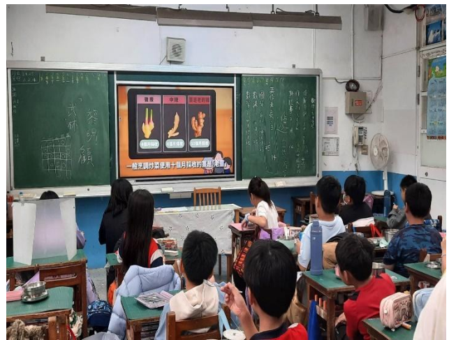
說明：11月-賦予料理靈魂的天然辛香料(蔬菜類)