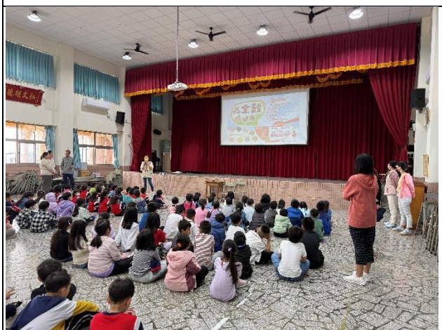
說明：健康飲食宣導