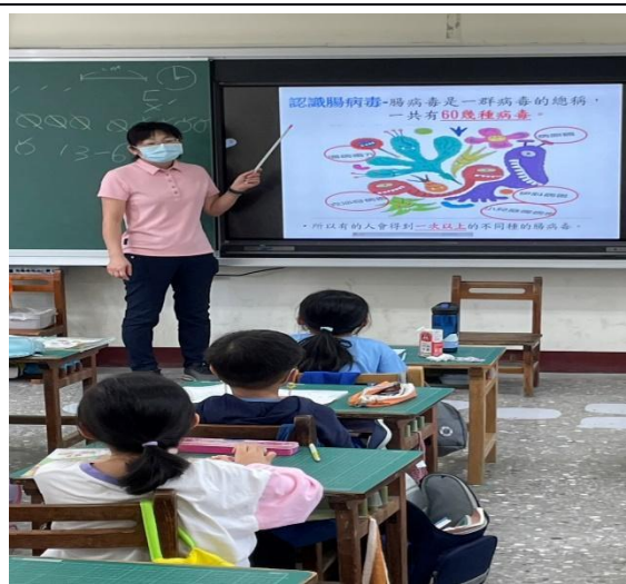
說明：理師入班對學生進行腸病毒衛教