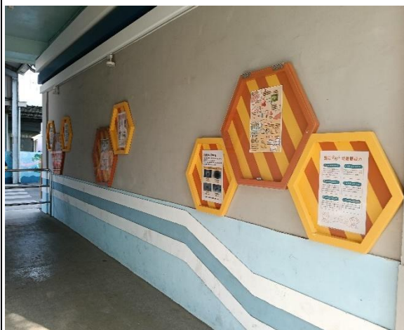
說明：健康廊道-張貼各式健康資訊。