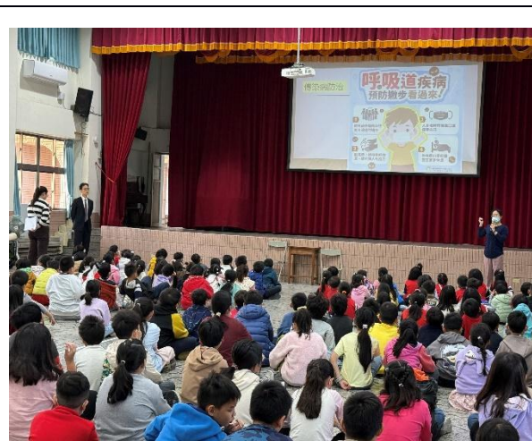
說明：傳染病防治宣導