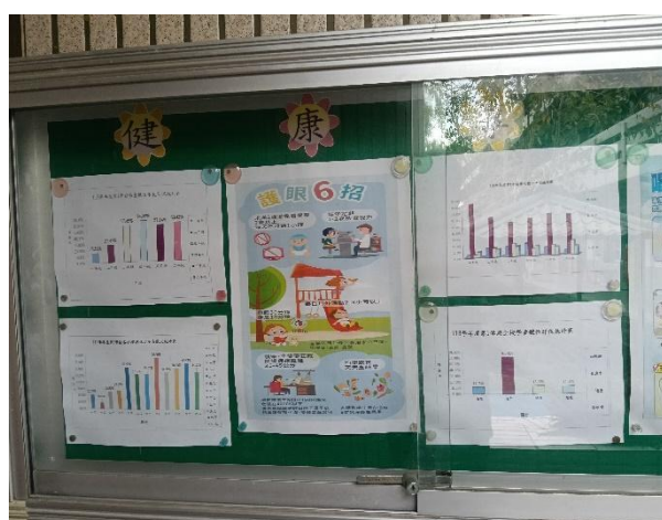
說明：健康專欄-張貼各式健康資訊。