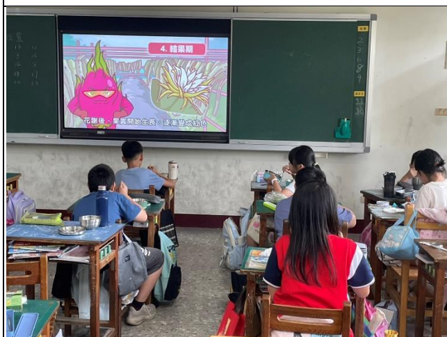
說明：4 月-探索漿果的迷人世界(水果類)