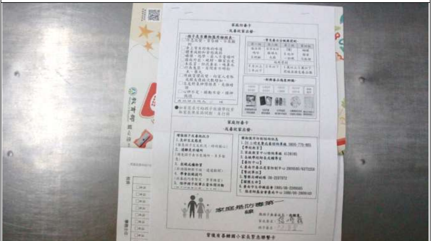
5. 聯絡簿-張貼家庭防毒卡商訊息