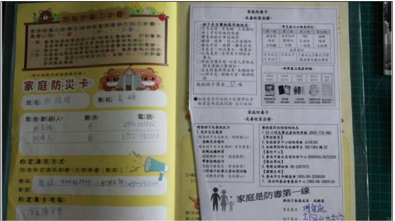
4. 聯絡簿-張貼家庭防毒卡商訊息