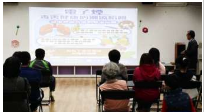
17. 班親會-校長向家長進行電子菸的危害宣導