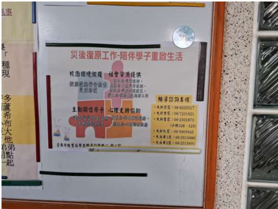
10. 公佈欄張貼宣導「災後復原工作~陪伴學子重啟生活」訊息