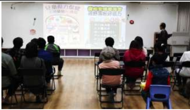
12. 班親會-校長向家長進行視力保健及口腔保健宣導