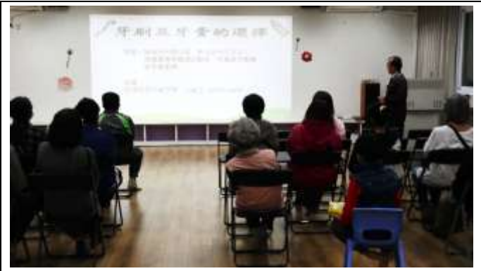
13. 班親會-校長向家長進行口腔保健宣導