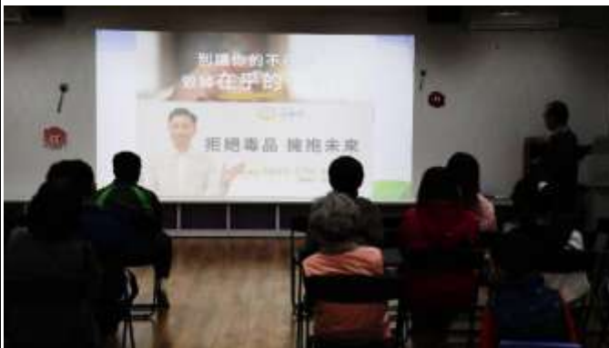
16. 班親會-校長向家長進行遠離毒品宣導