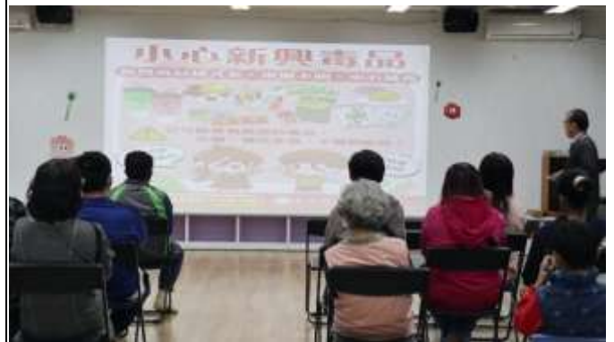
15. 班親會-校長向家長進行防範新興毒品宣導