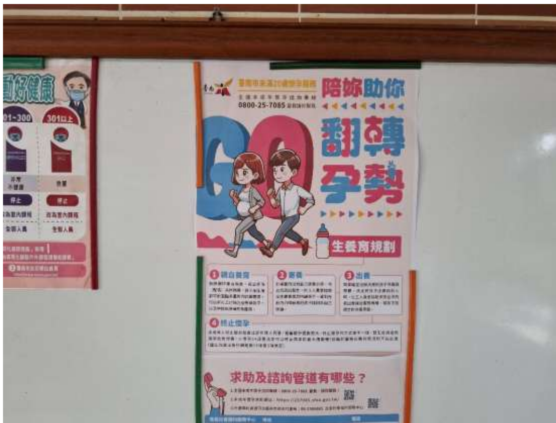
11. 公佈欄張貼宣導「未滿20歲懷孕處遇服務及防治教育宣導」訊息