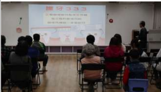
14. 班親會-校長向家長進行口腔保健宣導