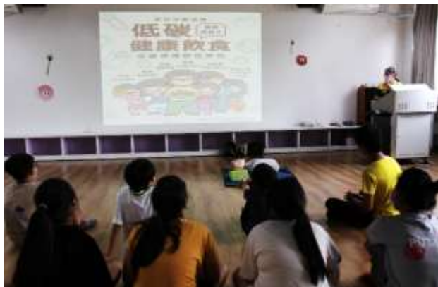
23. 結合衛生所辦理衛教宣導-低碳飲食