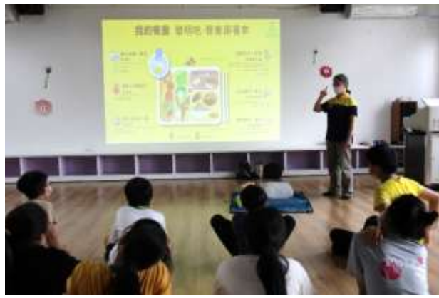
25. 結合衛生所辦理衛教宣導-低碳飲食