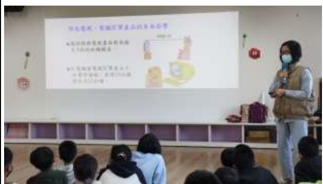
12. 結合衛生所辦理衛教宣導-視力保健