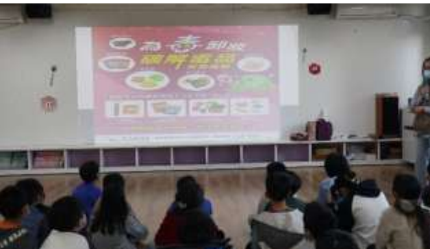
9. 結合衛生所辦理衛教宣導-防制藥物濫用