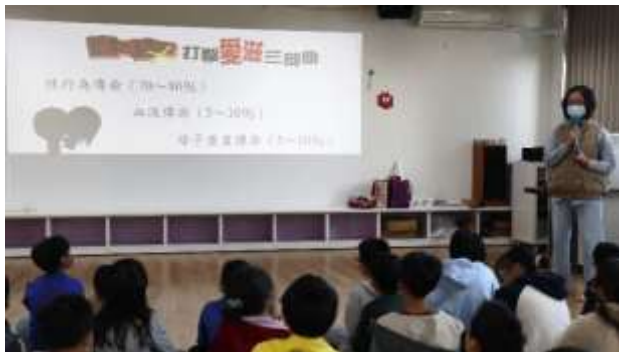
7. 結合衛生所辦理衛教宣導-愛滋病防治