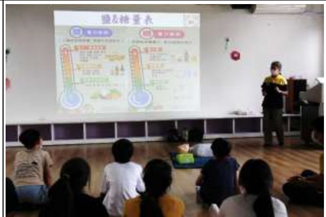
26. 結合衛生所辦理衛教宣導-低碳飲食