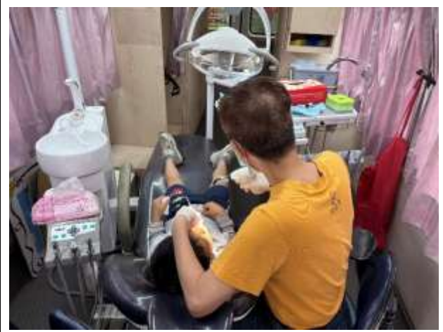
22. 結合醫療院所牙醫師及口腔巡迴車蒞校進行口腔保健保養