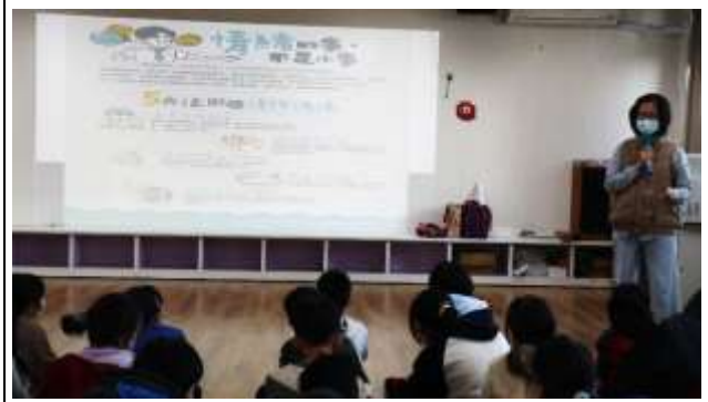
14. 結合衛生所辦理衛教宣導-心理健康促進