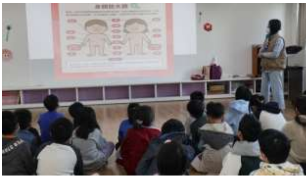
5. 結合衛生所辦理衛教宣導-性教育