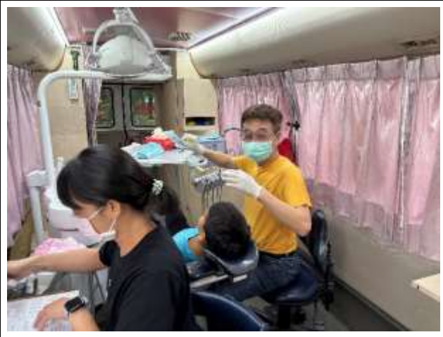
20. 結合醫療院所牙醫師及口腔巡迴車蒞校進行口腔保健保養