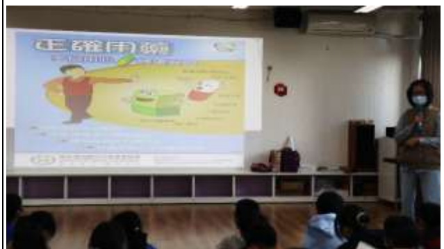
16. 結合衛生所辦理衛教宣導-正確用藥