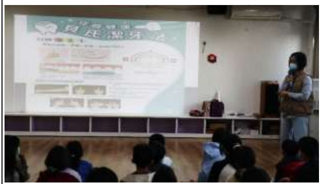
14. 結合衛生所辦理衛教宣導-口腔保健