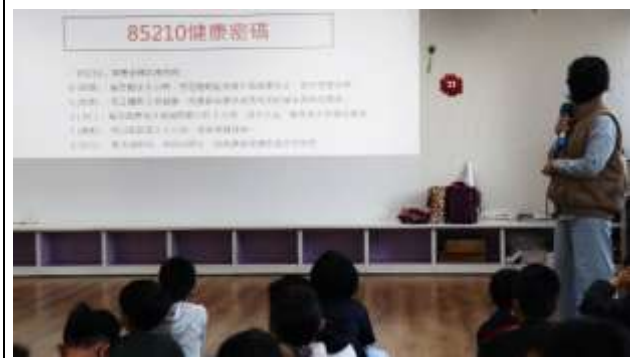
18. 結合衛生所辦理衛教宣導-健康體位