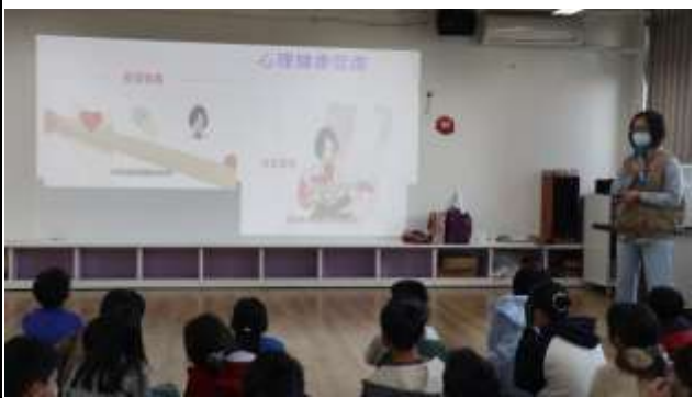
15. 結合衛生所辦理衛教宣導-心理健康促進