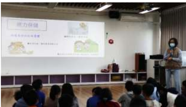
11. 結合衛生所辦理衛教宣導-視力保健