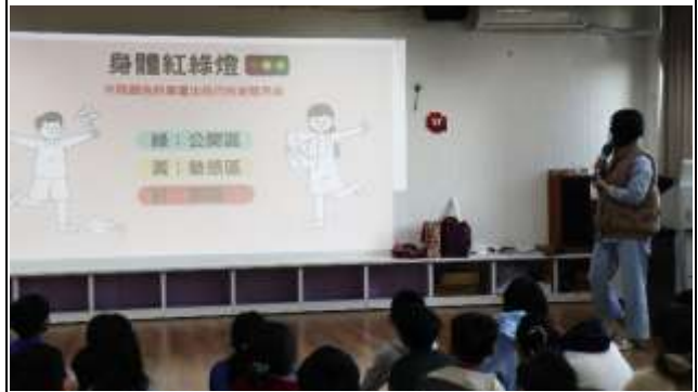
6. 結合衛生所辦理衛教宣導-性教育