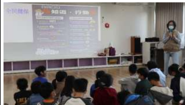
15. 結合衛生所辦理衛教宣導-全民健保