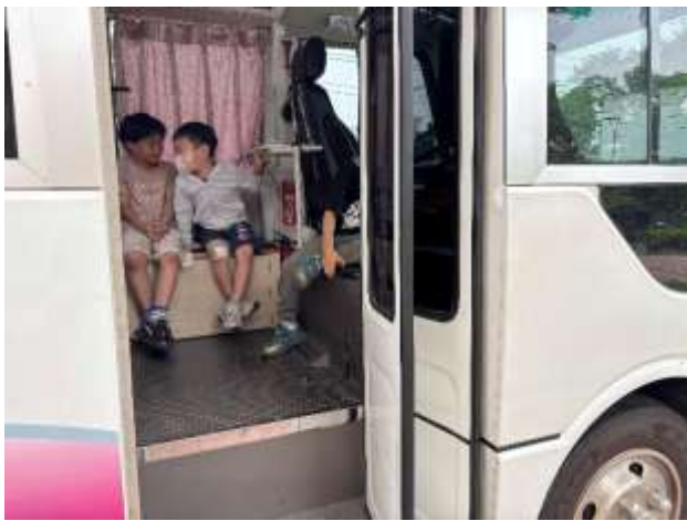
21. 結合醫療院所牙醫師及口腔巡迴車蒞校進行口腔保健保養