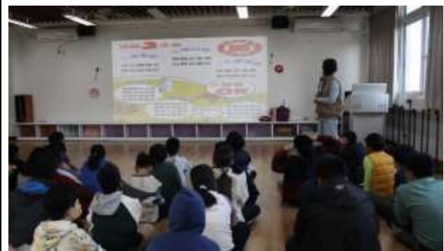
17. 結合衛生所辦理衛教宣導-健康體位