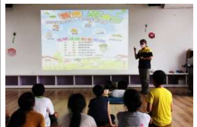
24. 結合衛生所辦理衛教宣導-低碳飲食