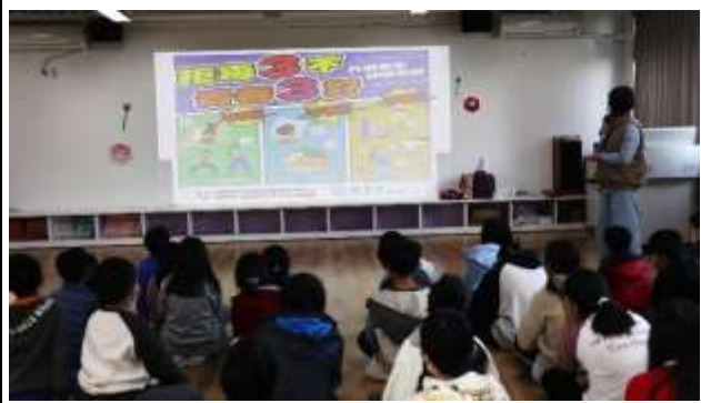
10. 結合衛生所辦理衛教宣導-防制藥物濫用