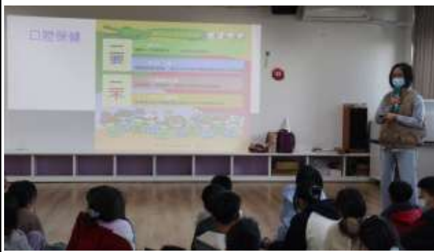
13. 結合衛生所辦理衛教宣導-口腔保健