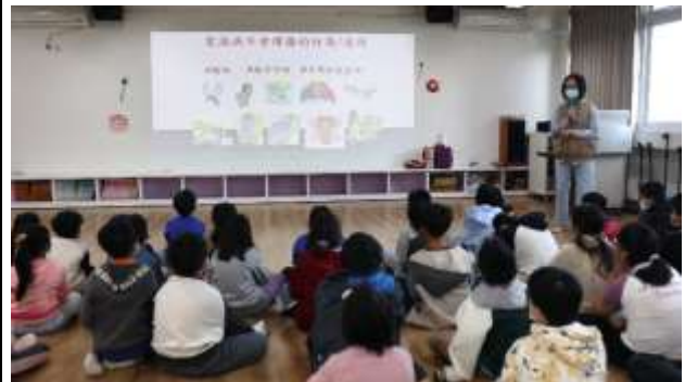
8. 結合衛生所辦理衛教宣導-愛滋病防治