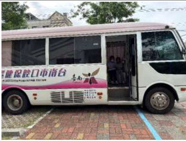
19. 結合醫療院所牙醫師及口腔巡迴車蒞校進行口腔保健保養