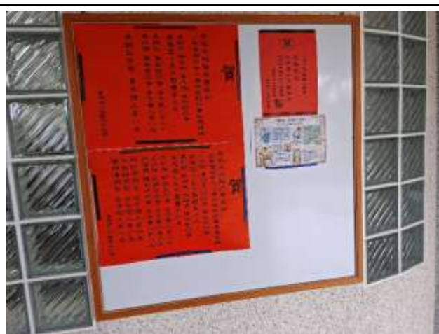
6. 牆壁規劃榮譽榜專用公佈欄