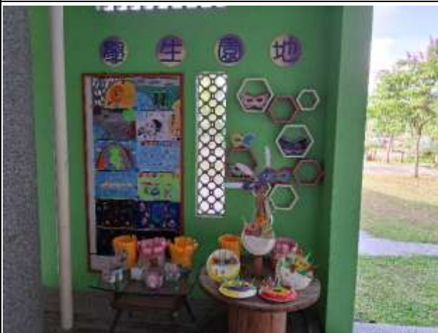
13. 利用裝置藝術學習角輪流布置各班學生藝術深耕的教學作品