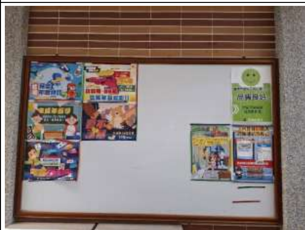
7. 牆壁規劃學務組宣導專用公佈欄