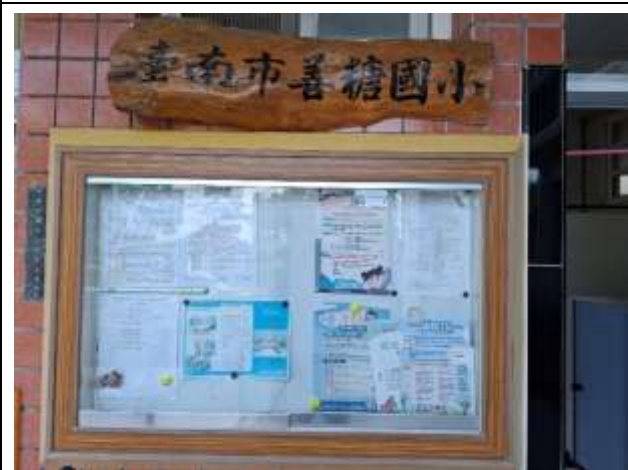
9. 幼兒園走廊牆壁規劃幼兒園專用公佈欄