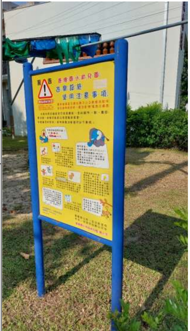
15. 遊戲器材區規劃設立各項安全使用須知