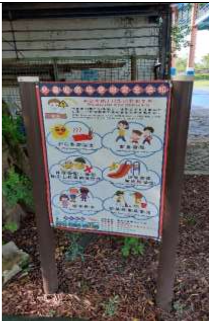
14. 遊戲器材區規劃設立各項安全使用須知