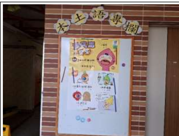
5. 牆壁規劃本土語專用公佈欄