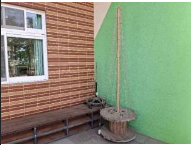
11. 利用回收品製作裝置藝術布置於學習角