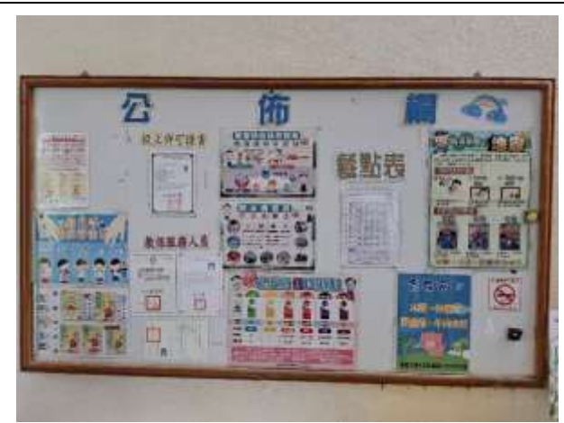
10. 幼兒園走廊牆壁規劃幼兒園專用公佈欄