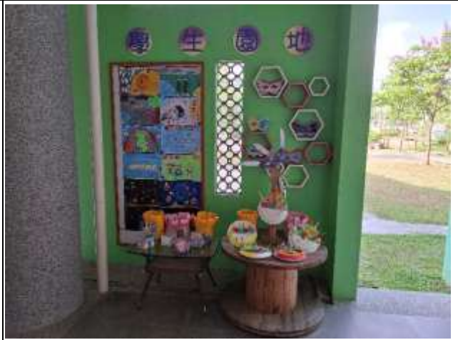
12. 利用回收品製作裝置藝術布置於學習角