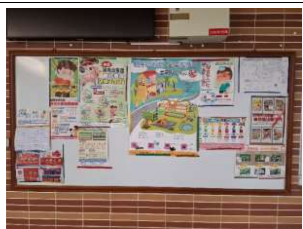
8. 牆壁規劃護理師宣導專用公佈欄