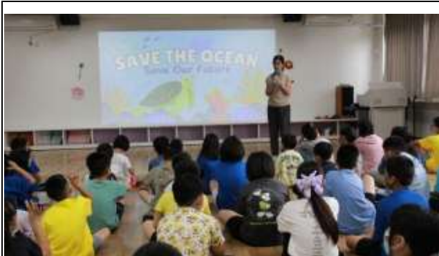
7. 海洋保育~救救海洋