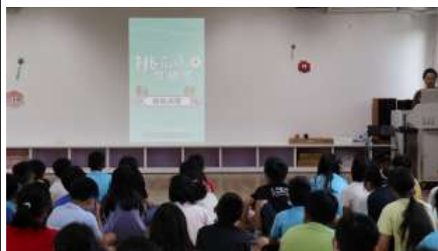
26. 搜尋~綠色消費開始