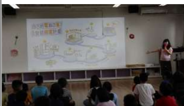
16. 能源教育週宣導「自己的電自己省」