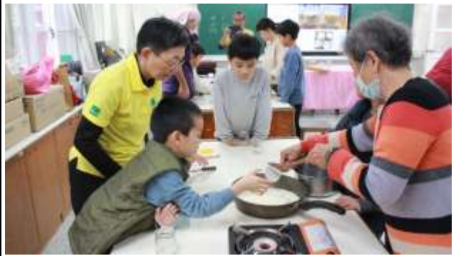
3. 食農教育~1/26手做台版米布丁