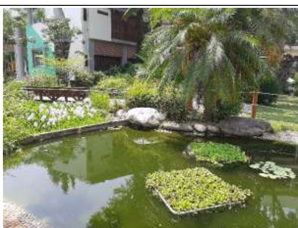
4. 回收水進行校園生態池的補充用水