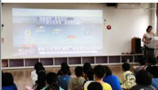
11. 過度捕撈 數量遽減 資源枯竭