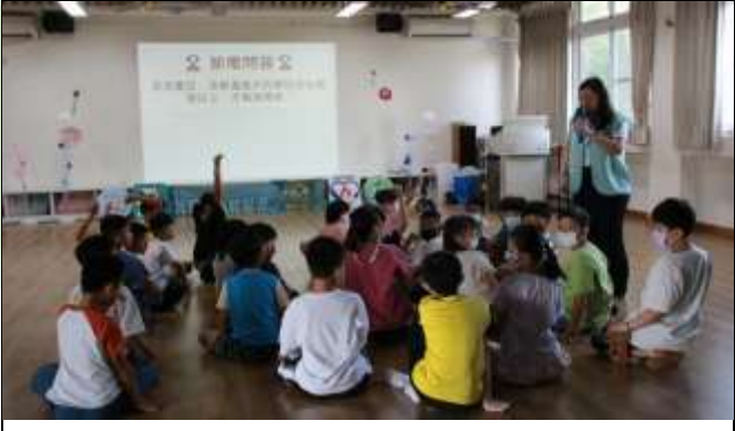
10. 經發局校園節電省能學習單