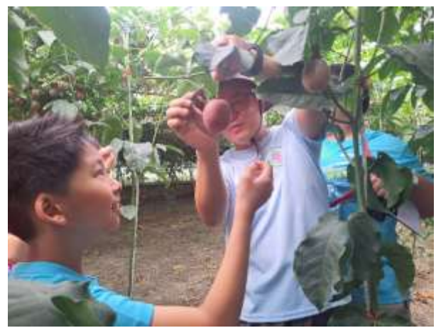
14. 食農教育~現採百香果