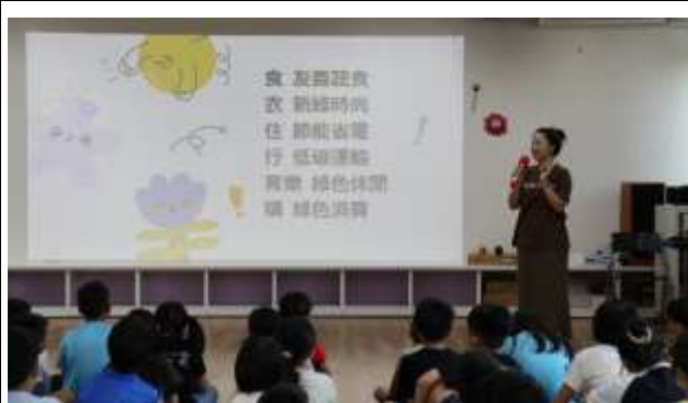
20. 食-友善蔬食 衣-新綠時尚 住-節能省電 行-低碳運輸 育樂-綠色休閒 購-綠色消費