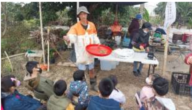
6. 食農教育~1/28農場體驗-樹豆介紹