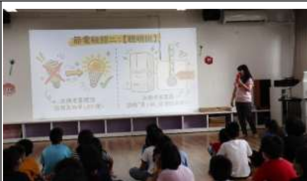
15. 能源教育週宣導「節電秘招-聰明挑」