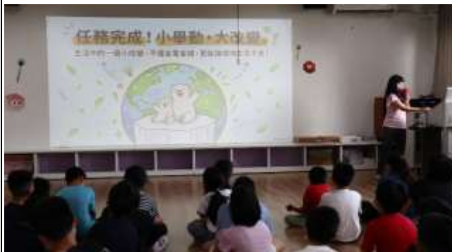
17. 能源教育週宣導「生活小改變 環境生生不息」