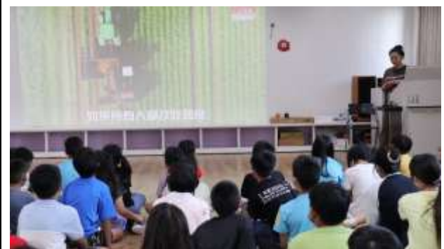
23. 如果所有人都改吃蔬食