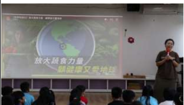
21. 蔬食 顧健康又愛地球