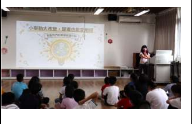
12. 於能源教育週時宣導「小舉動 大改變 節電也能愛地球」