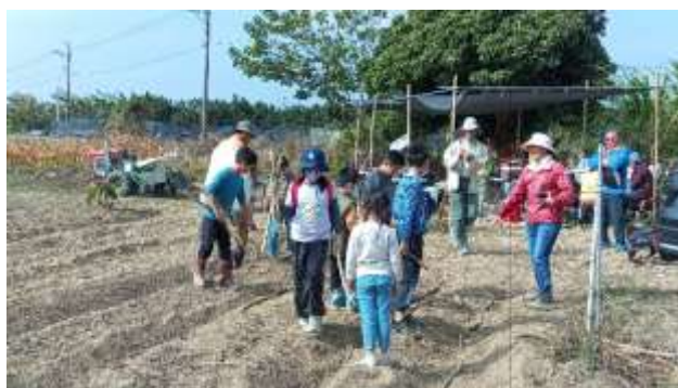
8. 食農教育~1/28農場體驗-種植白甘蔗