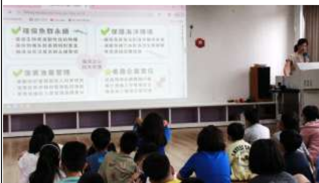
13. 海洋之心四大守護