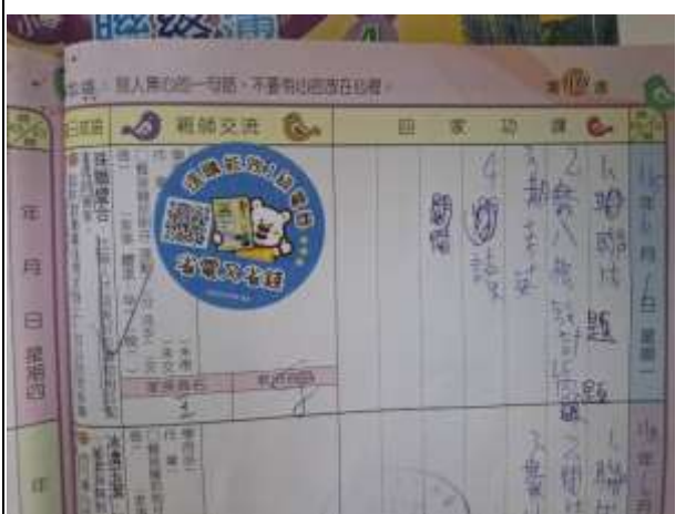
18. 能源教育週於聯絡簿張貼「選購能效1級電器 省電又省錢」貼紙宣導