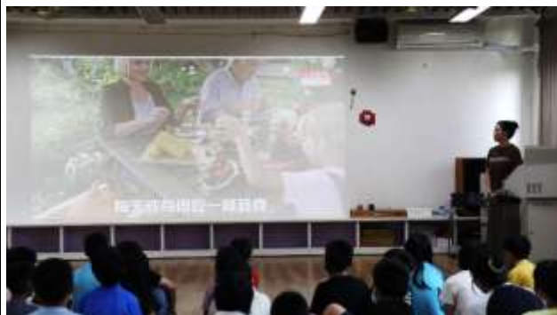
24. 每天或每週吃一餐蔬食