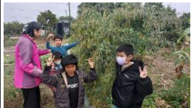
7. 食農教育~1/28農場體驗-採收樹豆