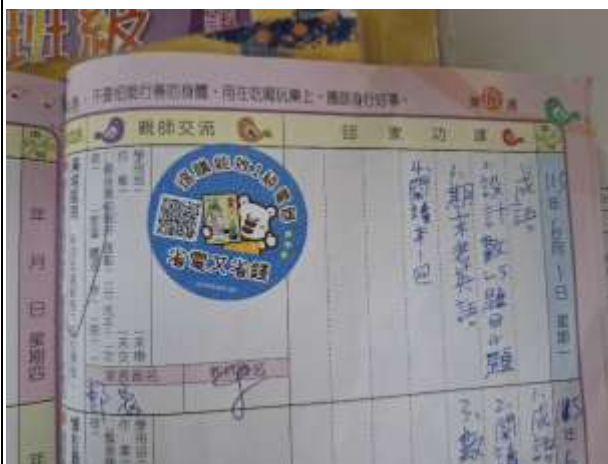
19. 能源教育週於聯絡簿張貼「選購能效1級電器 省電又省錢」貼紙宣導