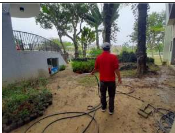
2. 回收水進行裸露地表噴水減少揚塵