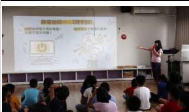
14. 能源教育週宣導「節電秘招-隨手關」