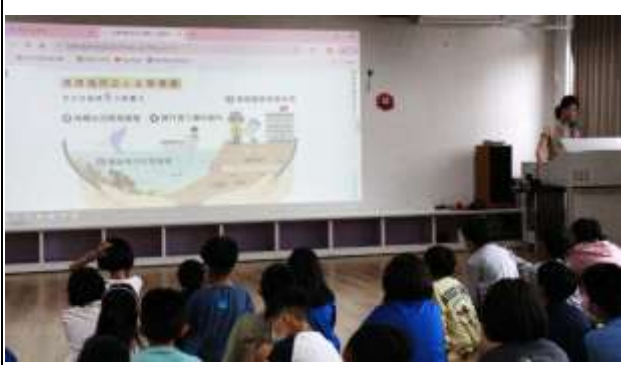
14. 海洋之心生態標章推動的影響力