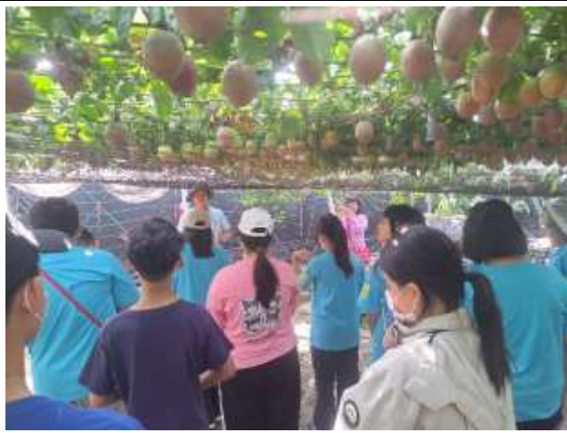
11. 食農教育~百香果園簡介