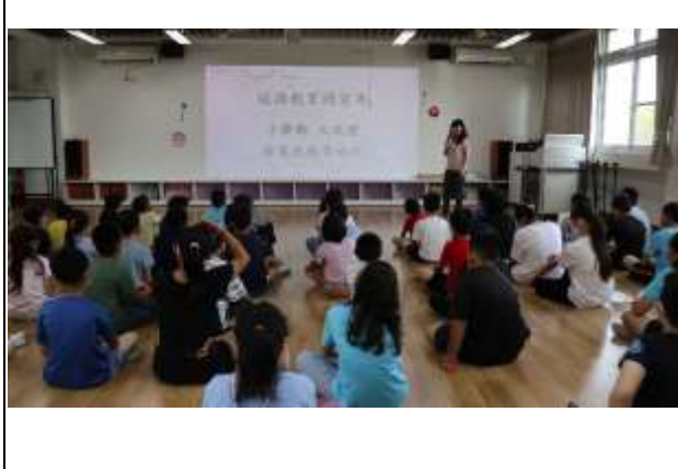
11. 經發局校園節電省能宣導活動，學童了解節電省能知識