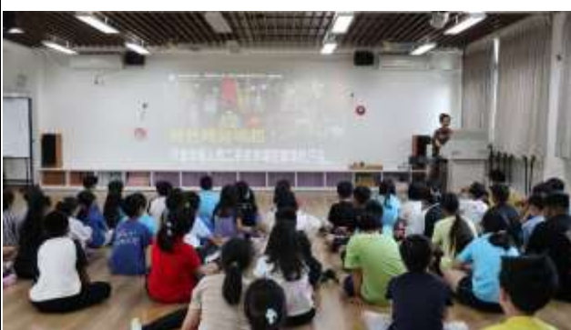
22. 綠色時尚 選購二手衣降低汙染