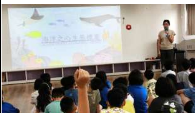
12. 介紹海洋之心生態標章