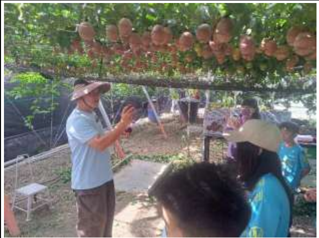
12. 食農教育~百香果簡介