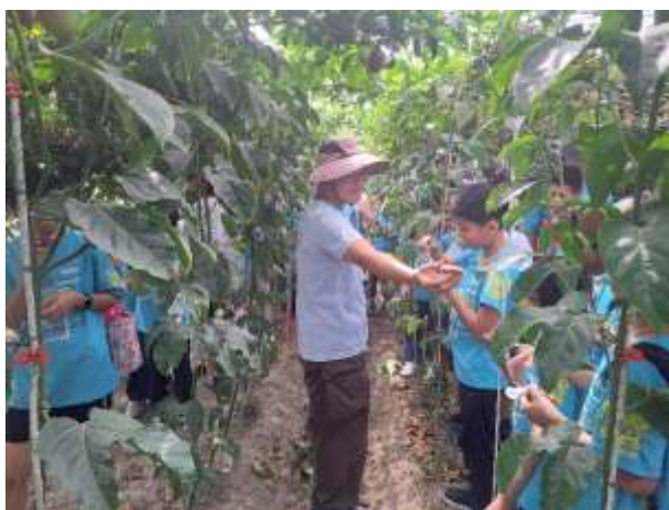
15. 食農教育~現採現品嚐百香果