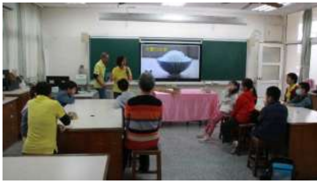
2. 食農教育~1/26米寶的故事