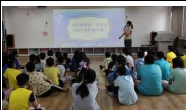
8. 你的每頓飯決定海洋能不能恢復生機