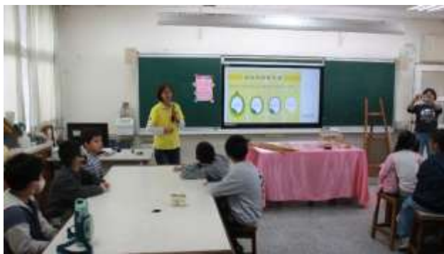
4. 食農教育~1/27米寶的兄弟姊妹