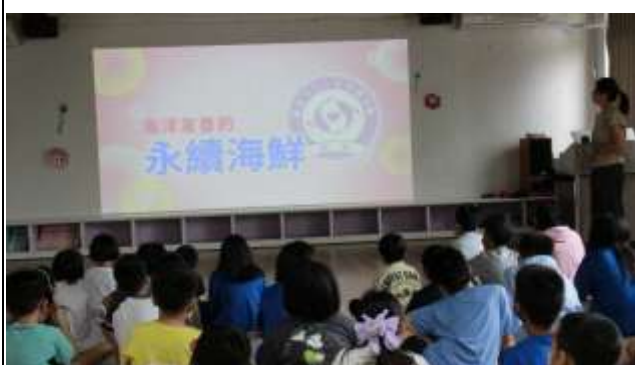
9. 海洋友善的-永續海鮮標章食材