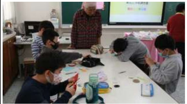
5. 食農教育~1/27製作米的冰箱貼(磁鐵)