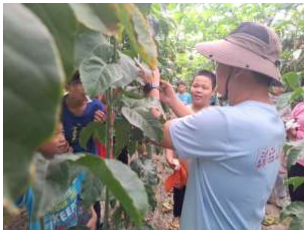
13. 食農教育~現採百香果