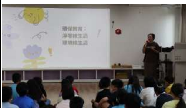
19. 環保教育~淨零綠生活 環境綠時尚