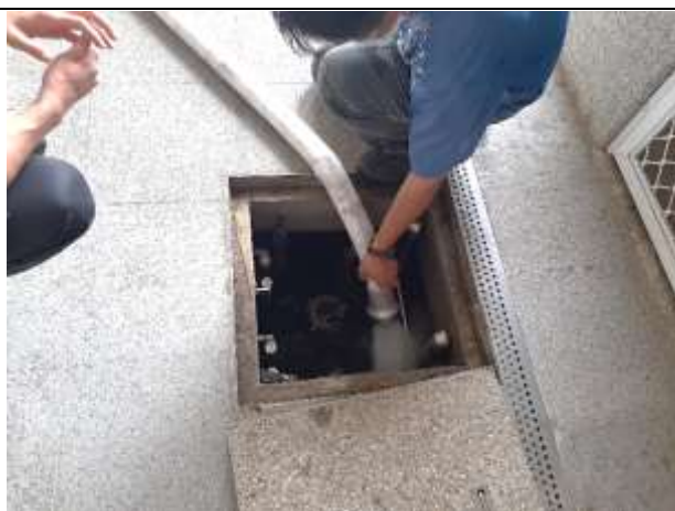
1. 筏式建築蓄積雨水回收再利用