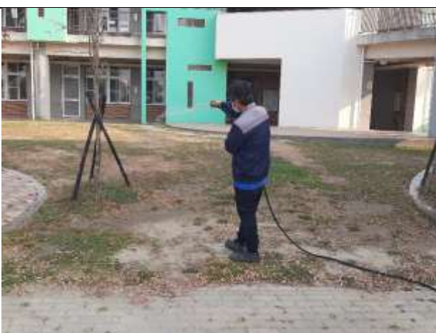
3. 利用回收水進行植栽澆灌