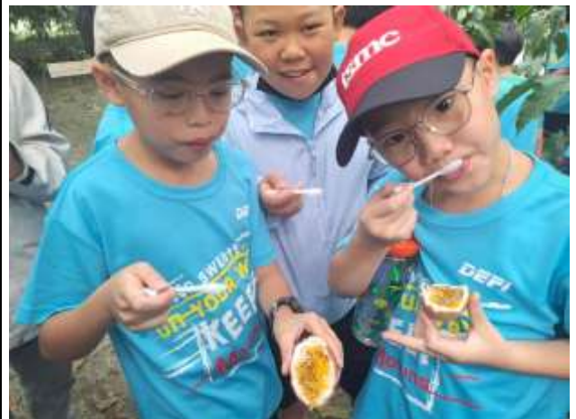
16. 食農教育~品嚐百香果