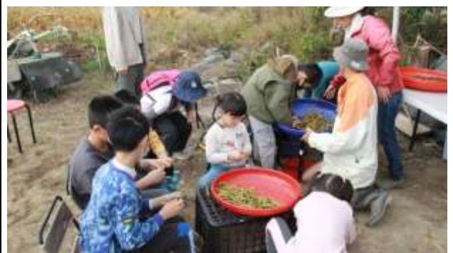
9. 食農教育~1/28農場體驗-剝樹豆實作