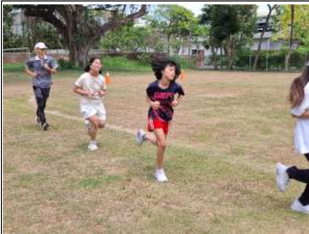
11. 說明:教師體育課時與學生進行體能活動