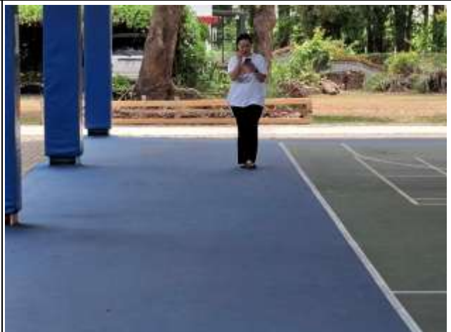
16. 說明:教師餐後步行運動進行體能活動