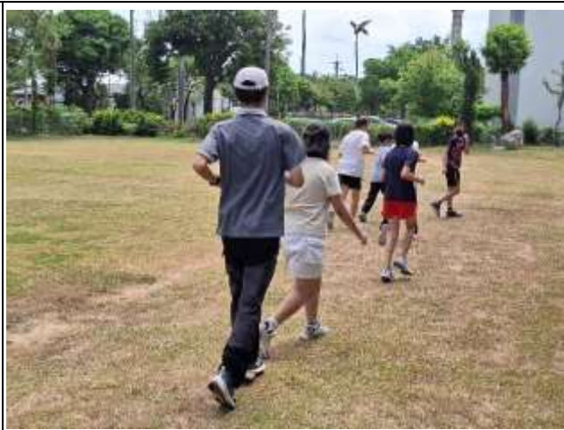
12. 說明:教師體育課時與學生進行體能活動