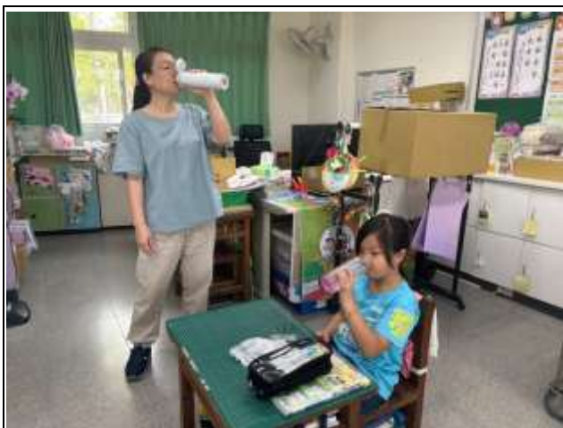
5. 說明：師生每日喝足白開水