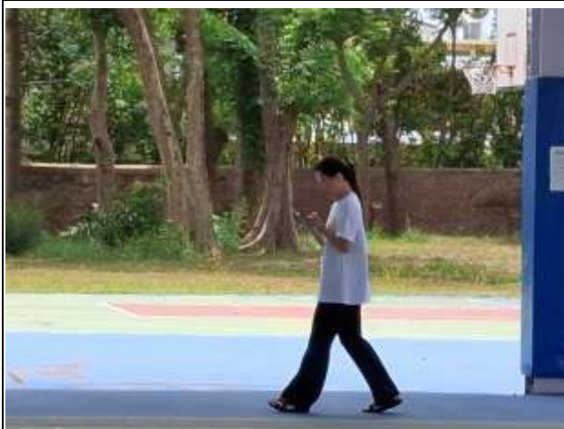
15. 說明:教師餐後步行運動進行體能活動