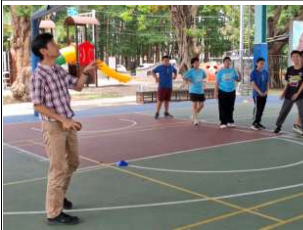
13. 說明:教師體育課時與學生進行體能活動