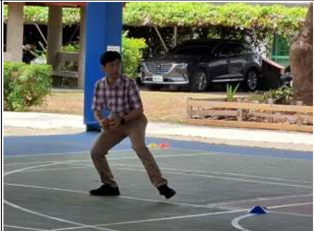
14. 說明:教師體育課時與學生進行體能活動