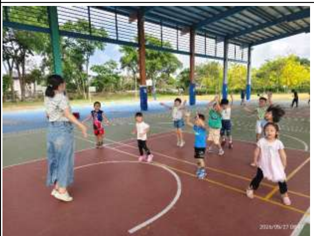
10. 說明：教師體育課時與學生進行體能活動