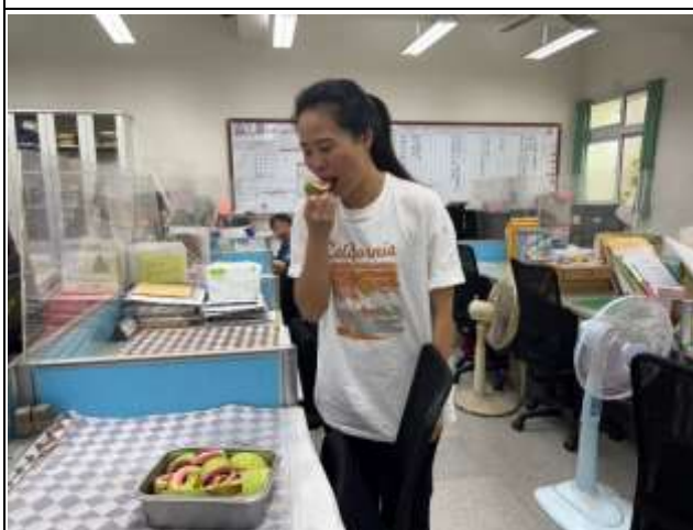
7. 說明：多備蔬果分享同事