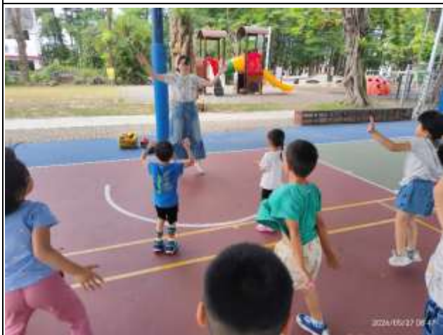
9. 說明：教師體育課時與學生進行體能活動