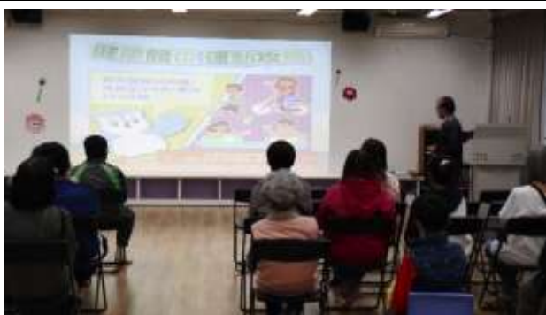
說明：校長進行健康體位宣導~健康體位之運動攻略