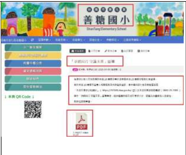
說明：善糖國小學校網頁公布欄公告宣導~台南市未滿20歲懷孕服務資訊