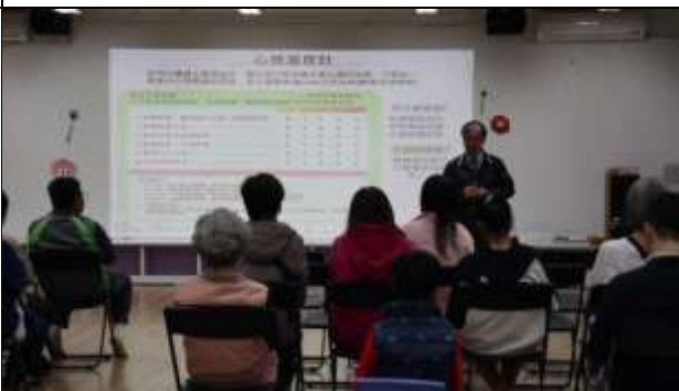
說明：校長進行正向心理健康宣導~心情溫度計之使用介紹