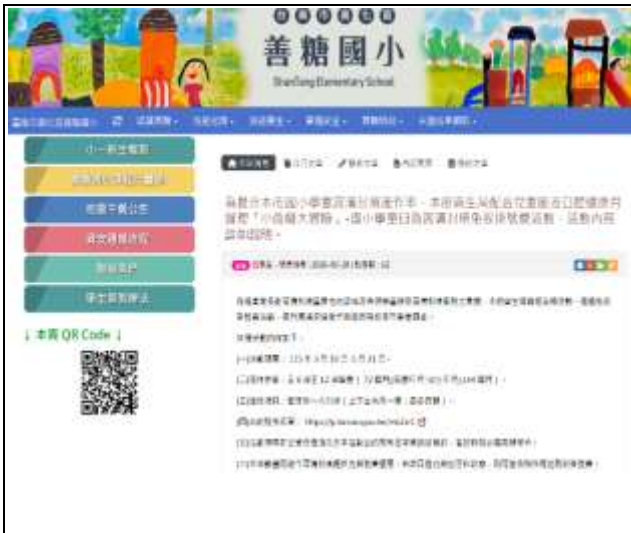
說明：善糖國小學校網頁公布欄公告宣導~本市學童白齒窩溝封填免收掛號費活動