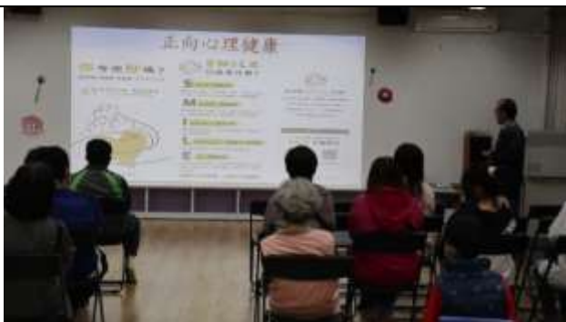
說明：校長進行正向心理健康宣導~你今天好嗎?