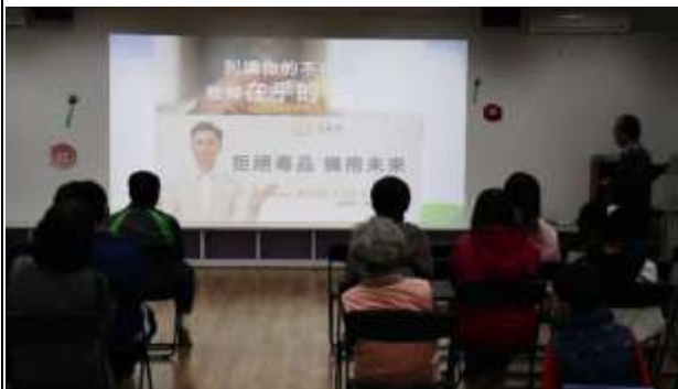
說明：校長進行防制學生藥物濫用宣導~別讓你的不在乎毀掉在乎的一切