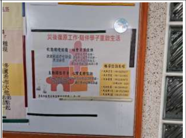
說明：善糖國小學校公布欄公告正向心理宣導~陪伴學子重啟生活