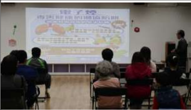
說明：校長進行菸癮防治宣導~毒害健康的潮流陷阱~電子菸