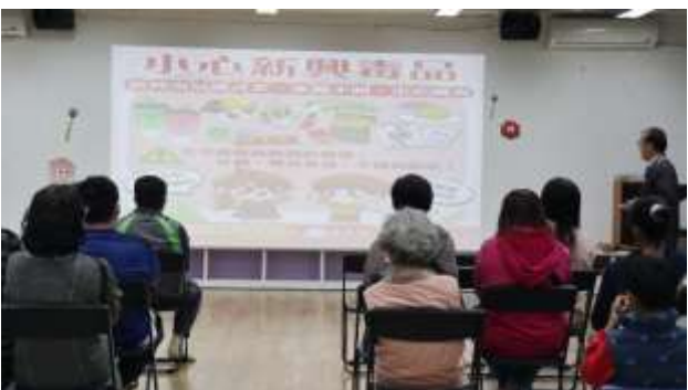
說明：校長進行防制學生藥物濫用宣導~小心新興毒品