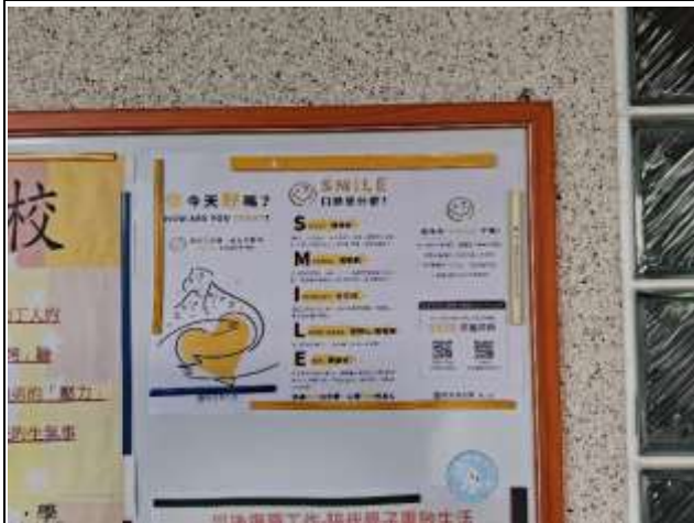
說明：善糖國小學校公布欄公告正向心理宣導~你今天好嗎?