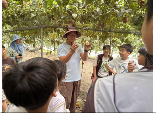
▲說明：親子實地走訪善化區百香果園