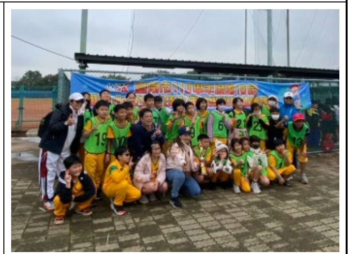
▲說明：113學年度五年壬班參加樂樂棒球市賽榮獲五年級組第二名