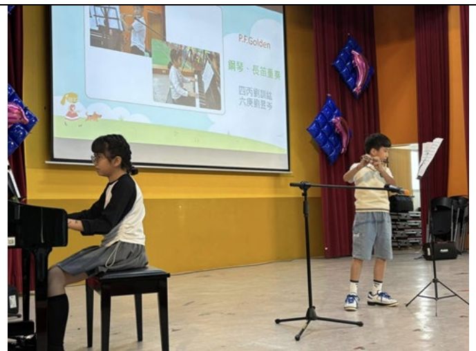
▲說明：學生鋼琴、長笛合奏「P. F. GOLDEN」