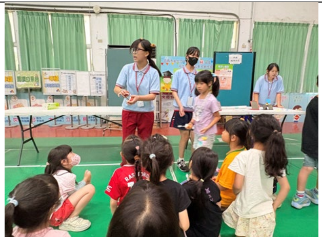
▲說明：「第三關」貝式刷牙法教學/「第四關」牙線教學