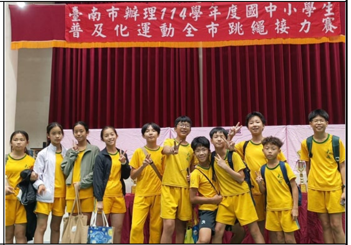
▲說明：六年丙班代表學校參加全市跳繩比賽，榮獲六年級組第4名佳績