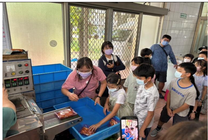
麵包廠包裝機體驗活動