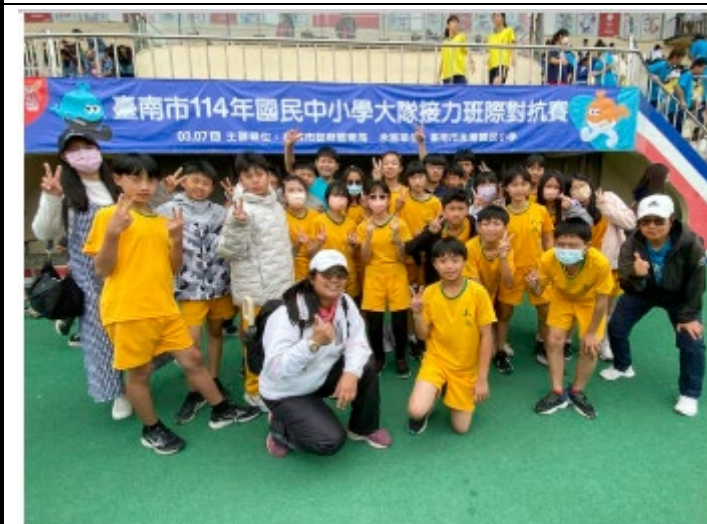
▲說明：參加114年國民中小學大隊接力班際對抗賽