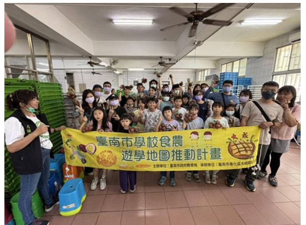
▲說明：自己製作愛玉百香特色飲品/親子同行-大成國小「臺南市學校食農遊學地圖推動計畫」成功