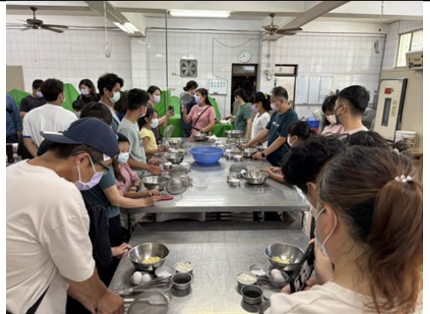
▲說明：親子大成麵包廠製作糕餅🍪-在地芝麻小餅乾