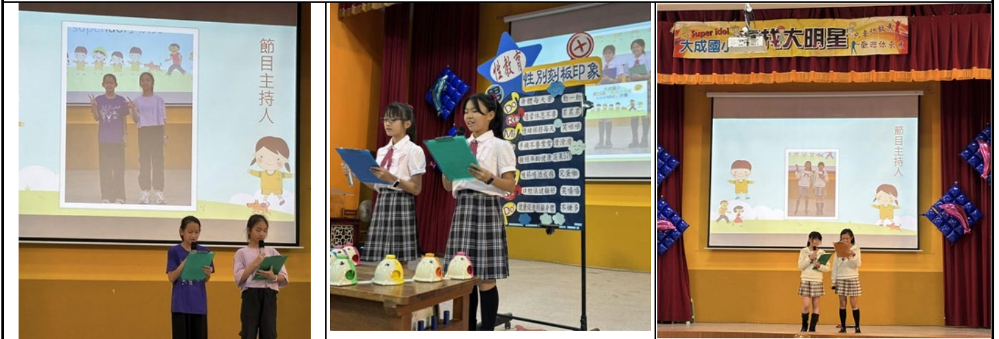
▲說明：「尋找大明星」小小主持人台風穩健、毫不怯場，展現大將之風