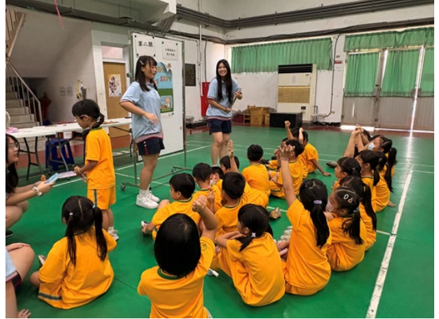
▲說明：「第一關」正確洗手及戴口罩教學/「第二關」視力保健教學