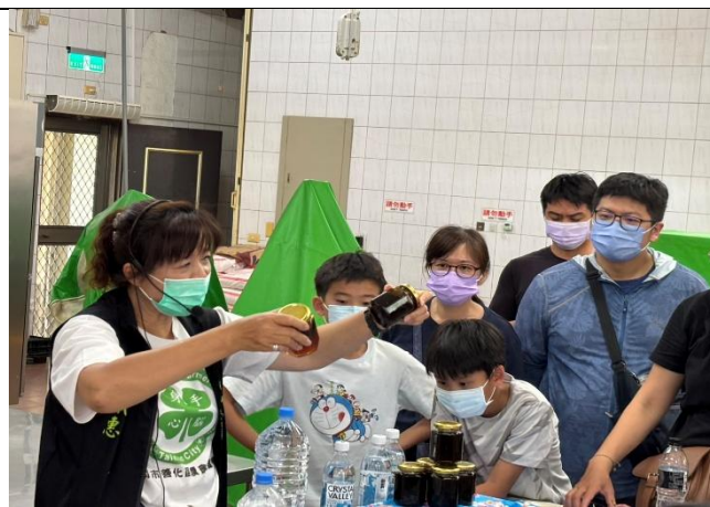
愛玉實作及百香飲品調配活動