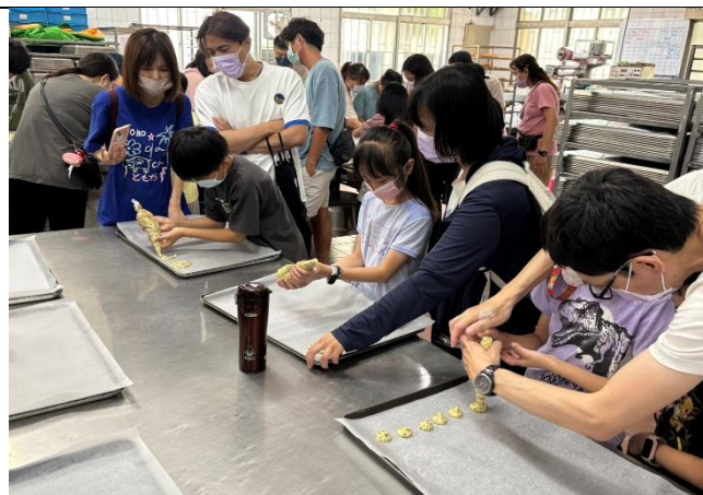
善化特產芝麻特色餅乾實作