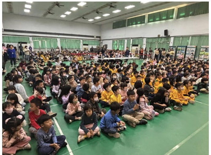
▲說明：台上精彩萬分，台下目不轉睛！滿場的小朋友聚精會神，完全被台上的大明星俘虜啦！