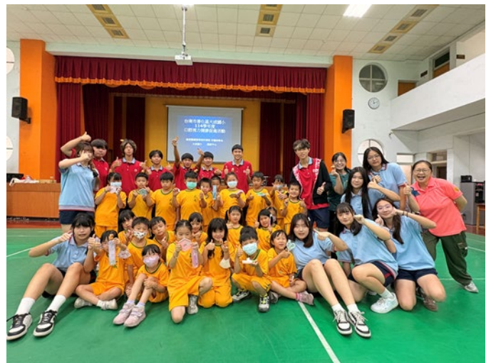
▲說明：「第四關」牙線教學/用滿滿的燦爛微笑，為這次的闖關活動畫下完美句點