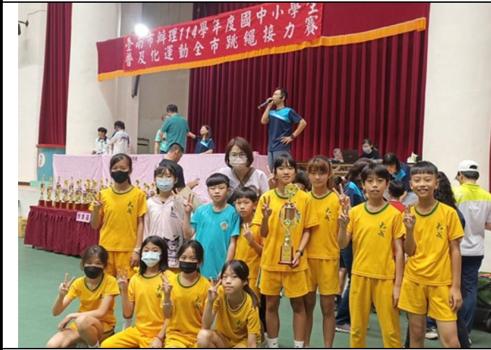
▲說明：五年壬班代表學校參加全市跳繩比賽，榮獲五年級組第2名佳績