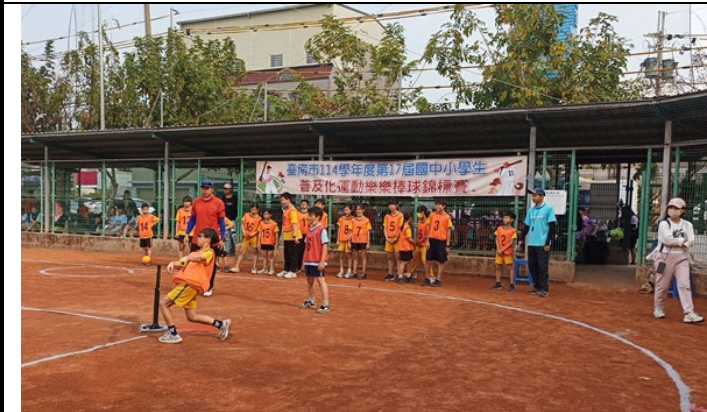
▲說明：六年壬班、五年庚班代表學校參加全市樂樂棒球比賽，六年級組榮獲優勝小選手表現優異榮獲六年級組優勝