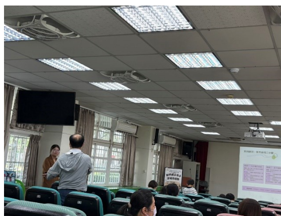
照片說明：家長分享自己的教育觀