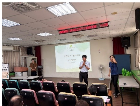
照片說明：校長開場致詞