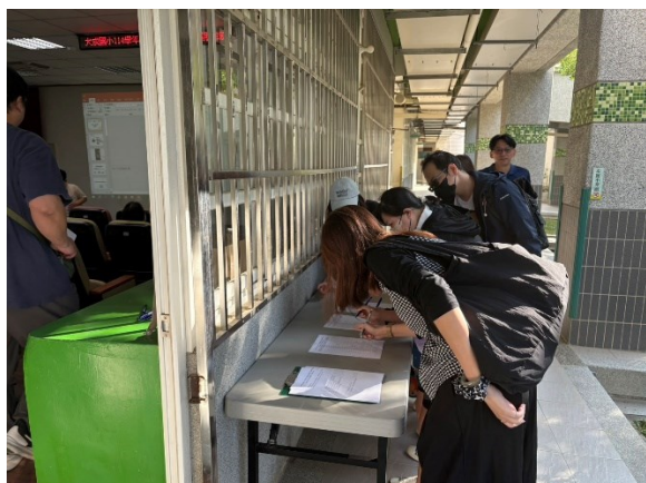
照片說明：家長報到