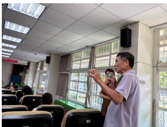
照片說明：家長說明特殊的孩子更需要正確的價值觀，家長要更有耐心。