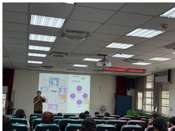
照片說明：講師專心課程講習