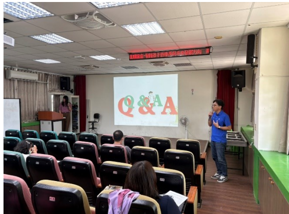
照片說明：輔導主任結論及感謝講師