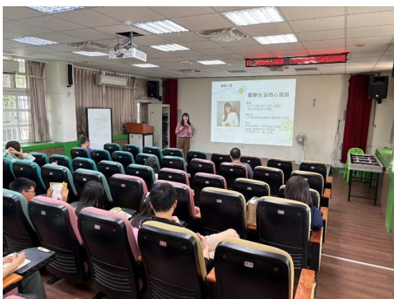
照片說明：講師自我介紹