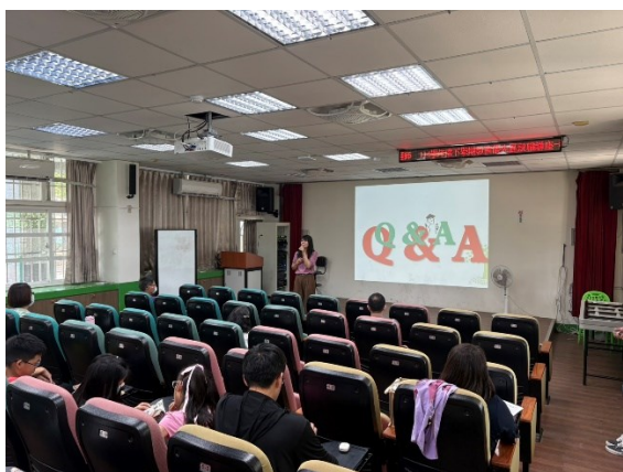
照片說明：講師與家長溝通時間