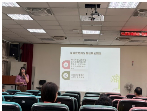
照片說明：家長專心聆聽課程