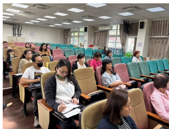
照片說明：親子專心聽講共同成長