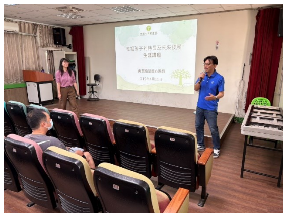
照片說明：主任開場介紹講師