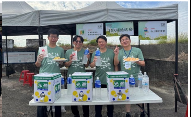
▲ 說明：大成國小鐵腿團參加全興盃路跑活動，親師生交流，提升全民運動風氣