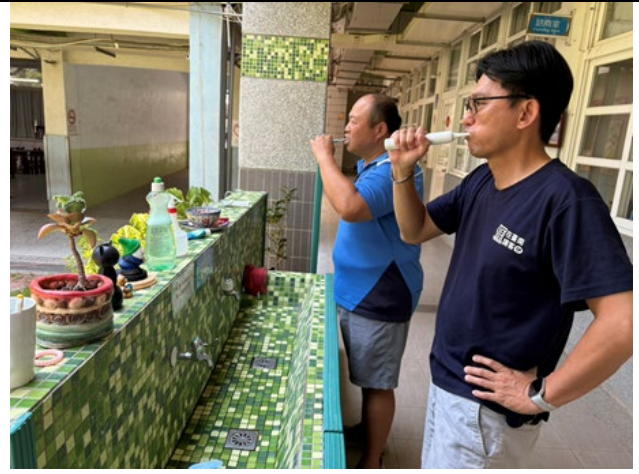
▲說明：老師們也帶頭做好榜樣！教職員們齊心落實『飯後刷牙』跟著學生們一起建立良好的健康習慣，從『齒』健康！