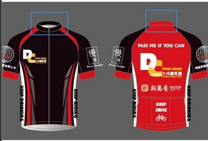
▲說明：設計製作專屬於大成鐵馬團成員的車衣