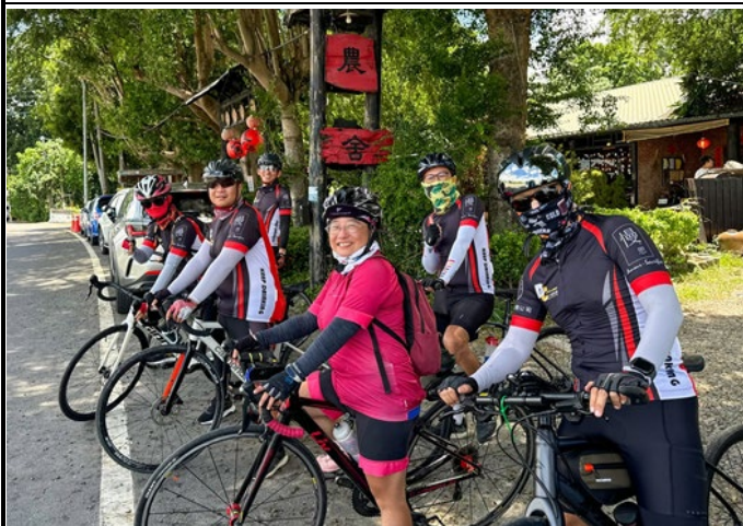
▲說明：輪躍台南百K山線漫遊