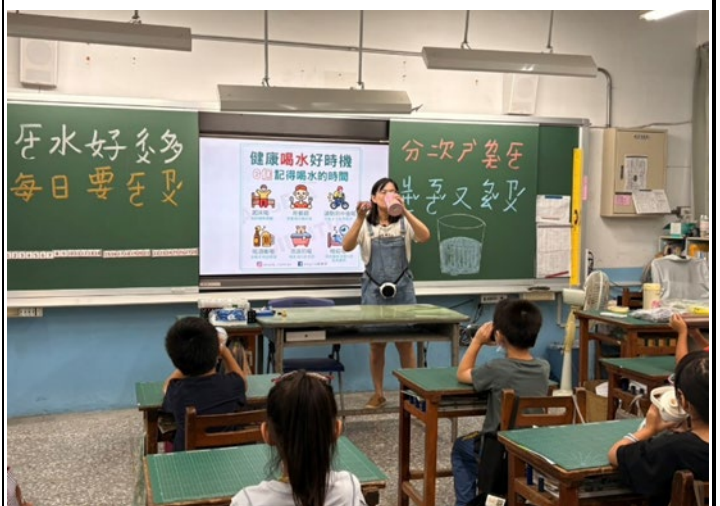
▲說明：老師以身作則，和孩子們一起愛上喝水、活力滿分