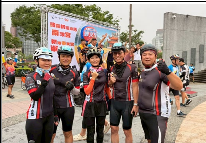
▲說明：大成鐵馬團的成員們一起報名參加「諸羅祈福鐵馬~南故宮新港奉天宮單車遊」