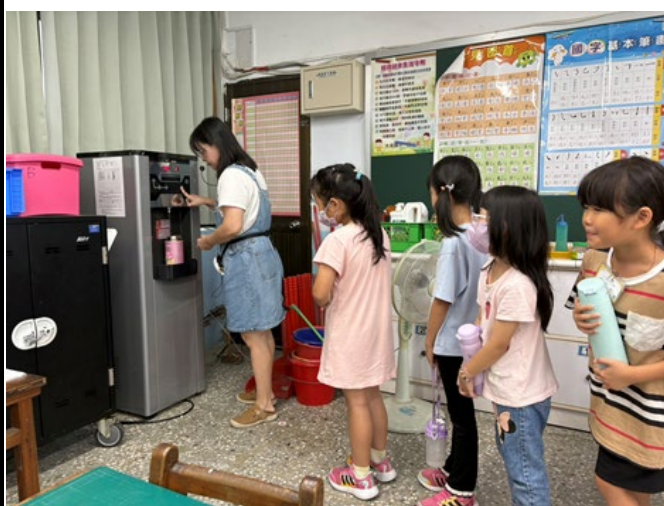
▲說明：「85110」零含糖飲料，多喝水多健康