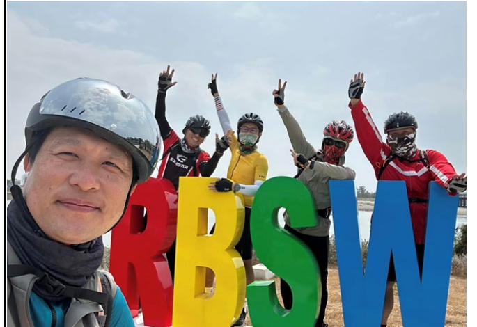
▲說明：高雄蚵仔寮鐵馬行之海鮮大餐等著我