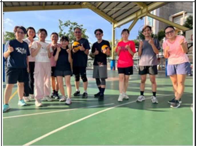
▲ 說明：教師排球社群，週三下午的球技交流，也是心靈的紓壓時光