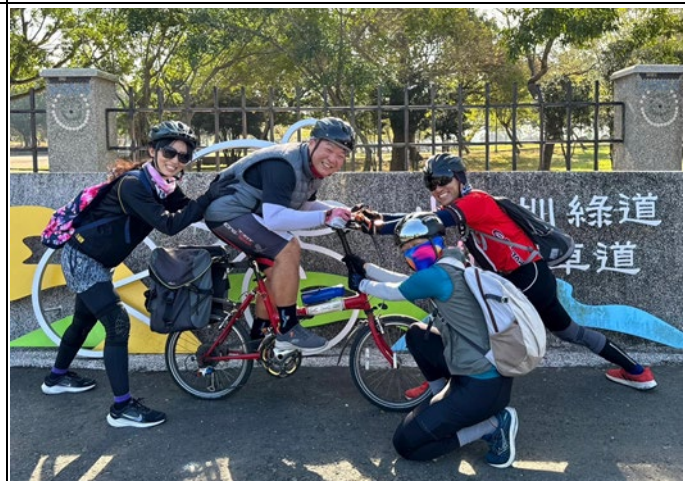
▲說明：174 翼騎士-一趟說走就走的騎程