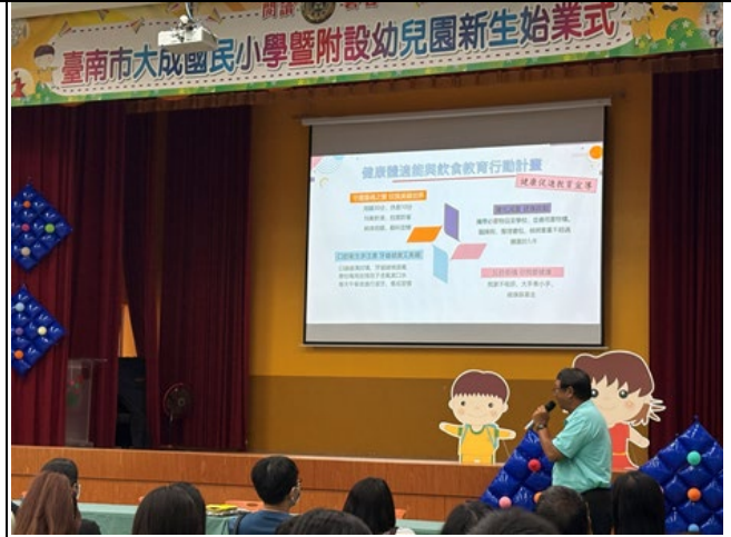
▲說明：大成國小新生始業式，校長與主任向家長傳達健康促進議題