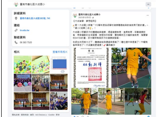
▲說明：成立大成國小粉絲團報導校園大小事、傳達健康訊息