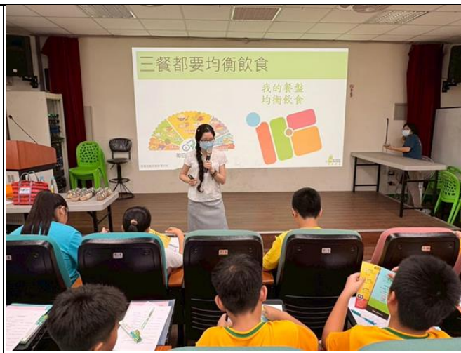
▲邀請衛生局營養師蒞校進行健康體位宣導