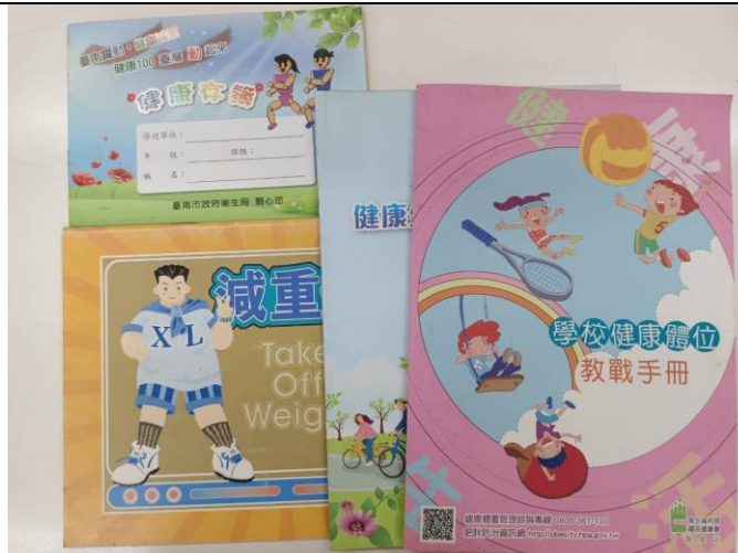
▲健康體位相關文宣供學童參考