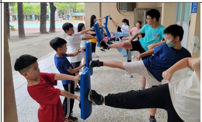
▲學生運動性課後社團多元豐富-圖為桌球社、羽球隊、武術社、跆拳道上課集錦