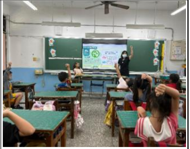
▲ 教師運用營養知識海報進行主題教學，並於餐前引導學生觀賞『餐前五分鐘』飲食教育影片，落實健康飲食素養