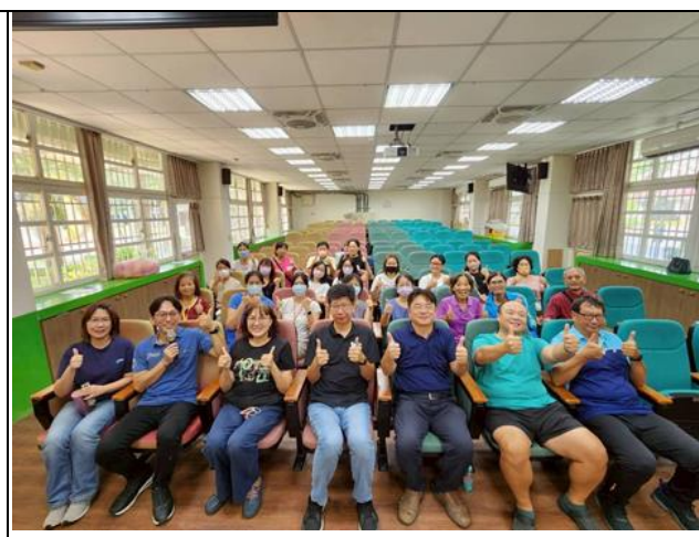
▲校長帶領行政團隊招募志工，不定期聚會，向志工分享健康生活概念