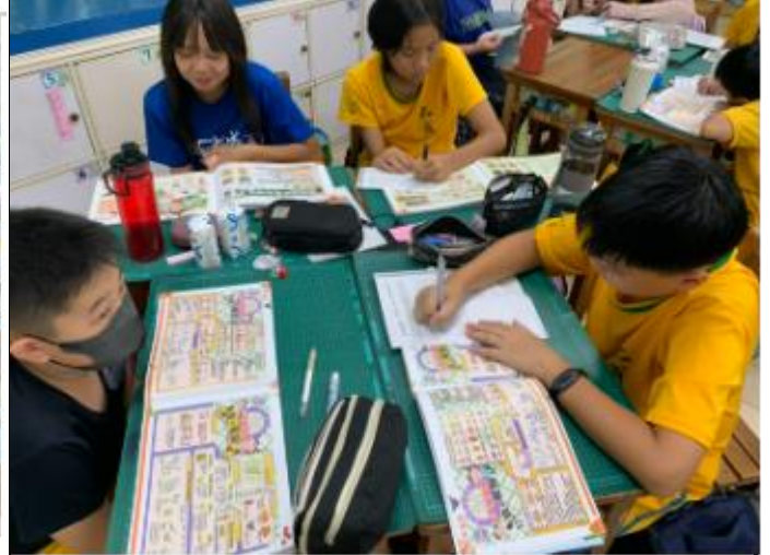
▲ 學生透過營養專書閱讀，連結每日營養午餐的食材體驗，深刻認識在地食材，將飲食教育與生活經驗相融合