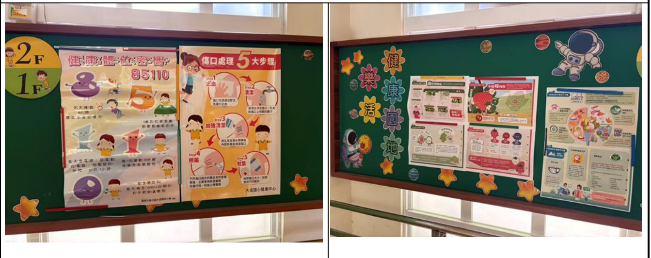
▲於校園公佈欄設置健康體位專區，張貼主題海報與衛教資訊，積極營造健康支持性環境