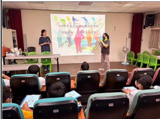
▲邀請善化區衛生所營養師蒞校進行健康體位宣導