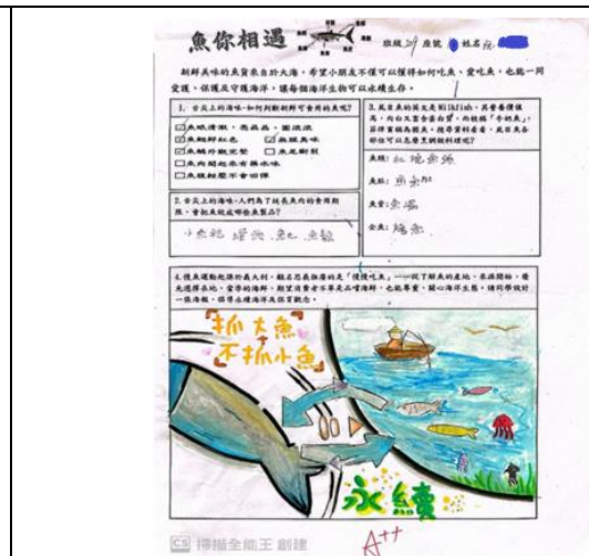
▲ 透過「餐前5分鐘專書」班級書箱推動飲食教育閱讀，將健康飲食素養融入晨讀、相關學科及跨域課程，讓健康飲食教育在校園深度扎根