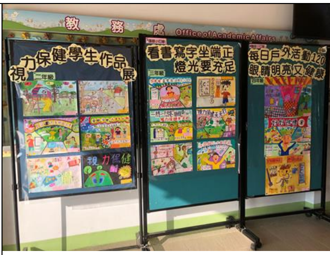
▲辦理校內健康促進繪畫比賽，不同年段以不同主題呈現