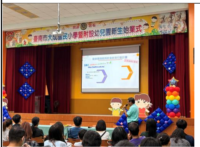
▲利用新生始業式契機，由主任向新生家長宣導『健康體適能飲食行動計畫』，親師攜手奠定學童健康成長基石