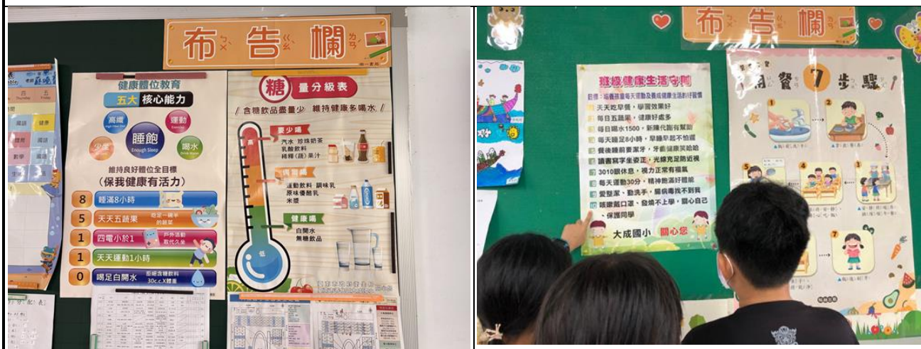
▲公佈欄張貼健康體位、糖量分級表及『大成國小健康守則』主題海報，透過支持性環境的營造，深化學童良好健康素養