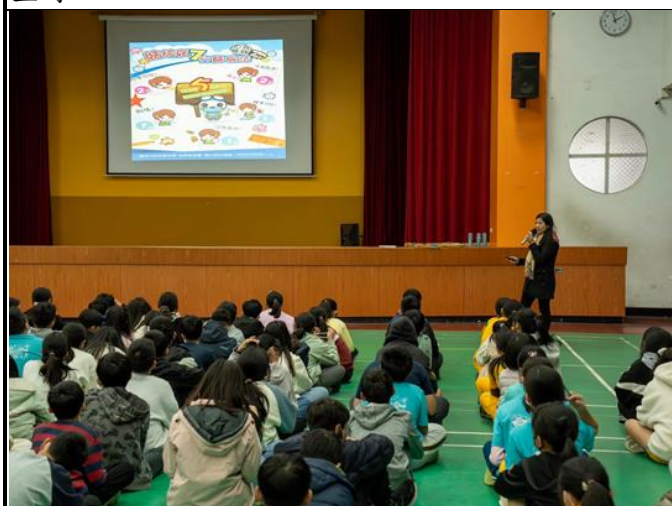
▲積極連結社區醫療資源，邀請善化區衛生所護理師蒞校進行健康體位宣導攜手守護學童健康