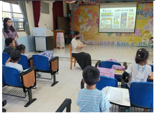
說明：課後照顧班-宣導[護眼密碼—積極改變用眼習慣]