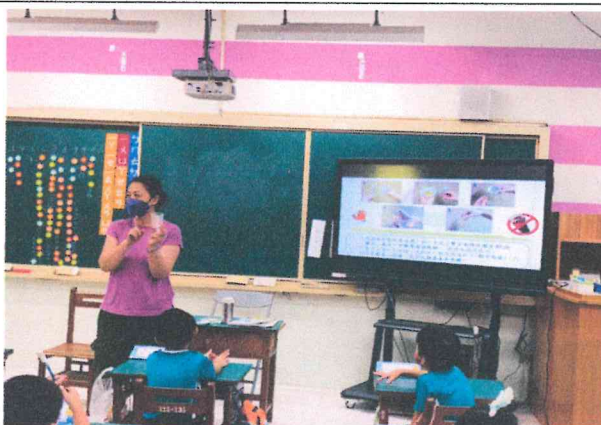
一甲師生健檢說明