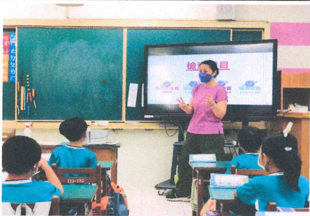
一甲師生健檢說明