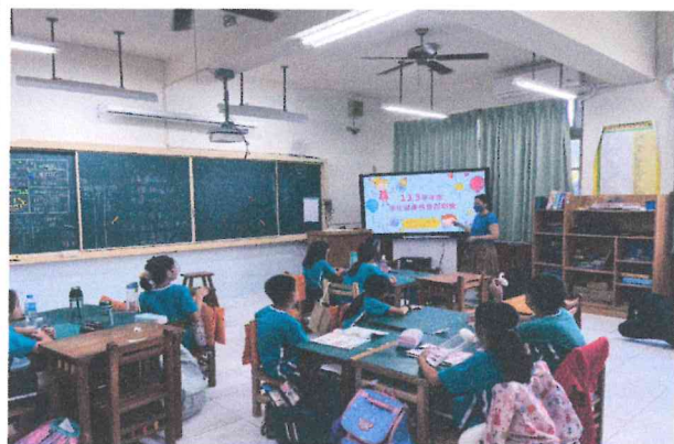
四甲師生健檢說明