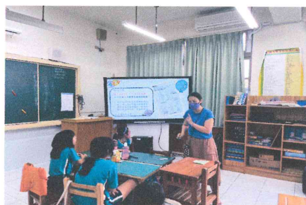
四甲師生健檢說明