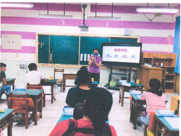
班親會安排健檢說明