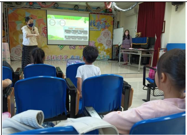
說明：課後照顧班-認識[眼睛結構][近視與遠視]