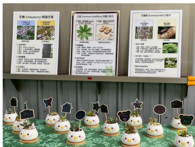
郵局植樹活動~種植多肉植物美化校園