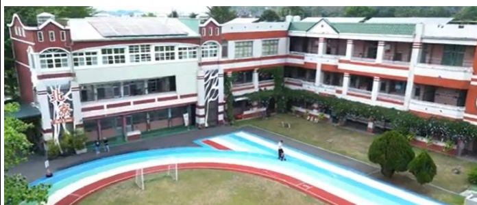
學校建築一二樓被大鄧伯花所圍繞