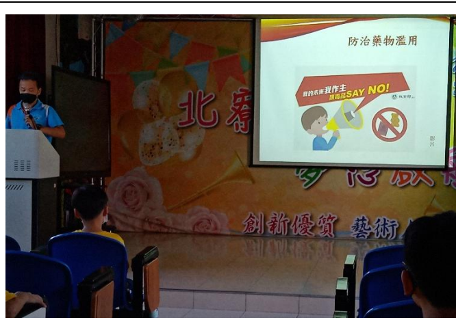
防治藥物濫用宣導