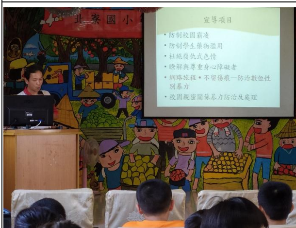
藥物濫用防制宣導