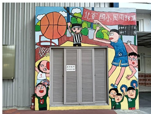
學生彩繪球場牆面