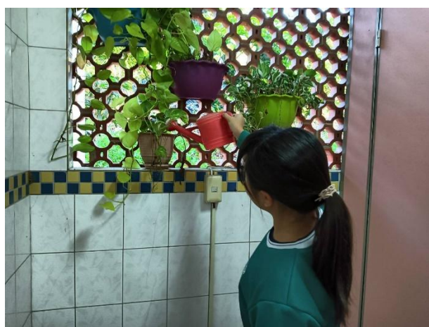
學生參與綠化校園廁所環境