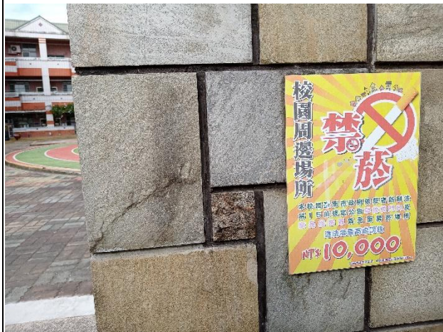
校園有周邊場所禁菸標誌