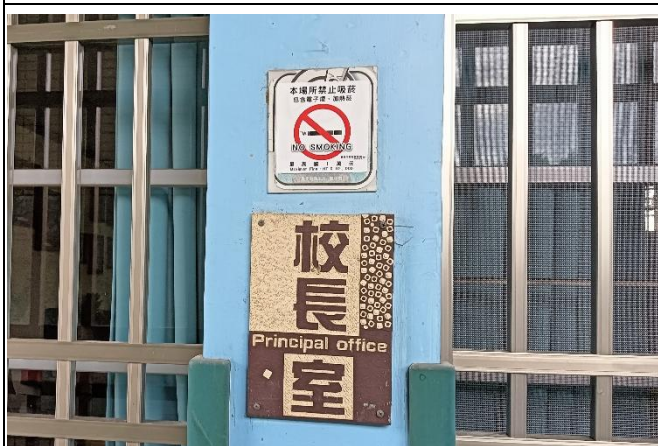
校長室、辦公室有禁止吸菸標誌