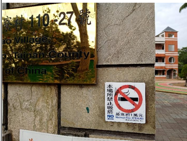
校門口有禁止吸菸標誌