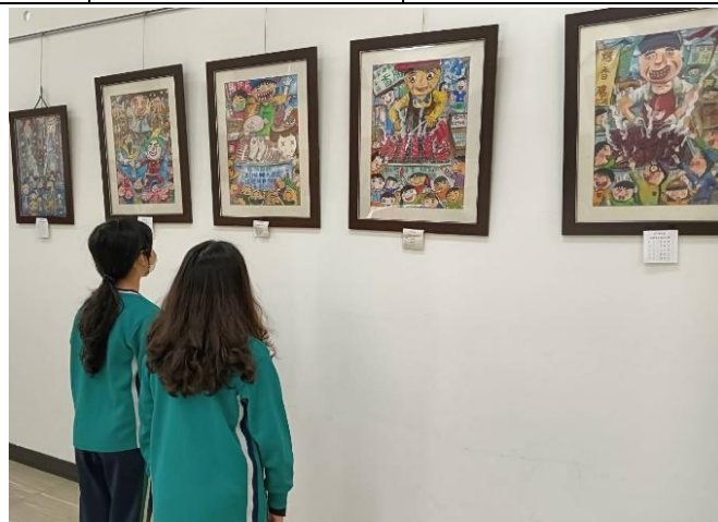
學生優良美術作品展示