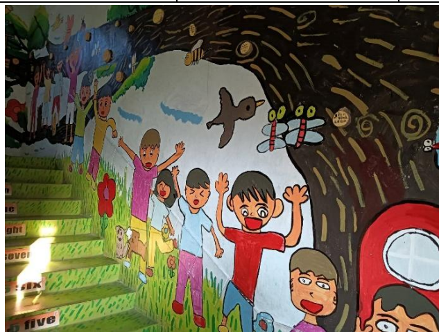
學生彩繪校園走廊