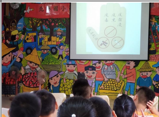
友善校園反毒宣導