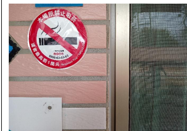
教室門口有禁止吸菸標誌