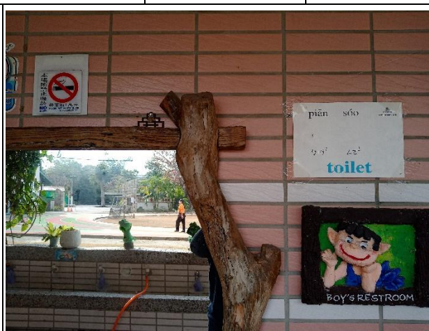
廁所門口有禁止吸菸標誌