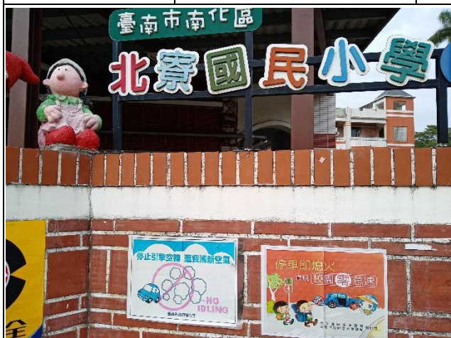
校門口有停車怠速標誌