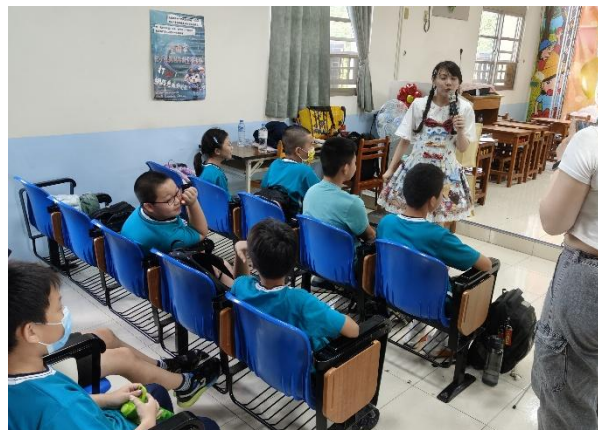
兒少性剝削防制宣導