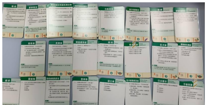
防疫寶盒題目卡（均衡飲食、肥胖防治、視力保健、腸病毒、牙齒保健……）