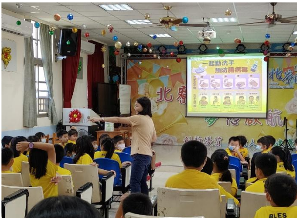
勤洗手預防腸病毒