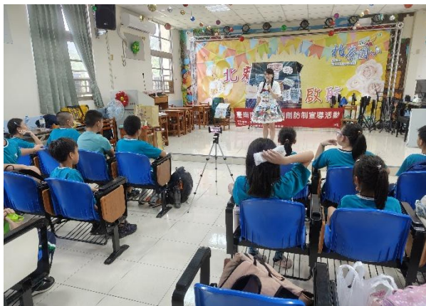
兒少性剝削防制宣導