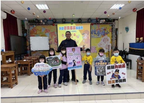
毒品菸害防制宣導