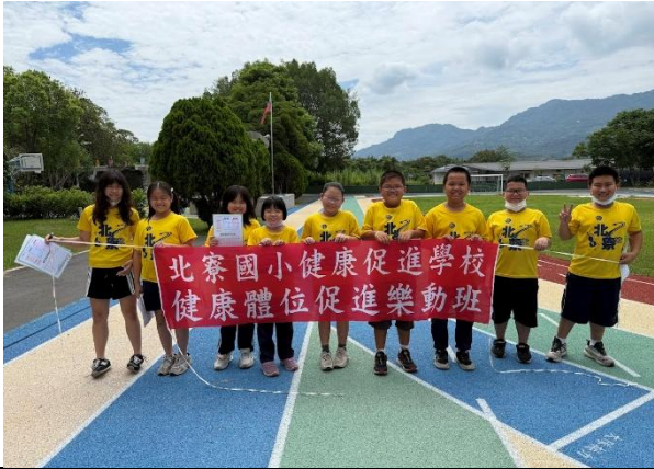
中年級樂動班成員