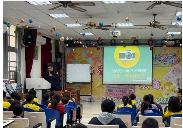
兒少性剝削防制宣導