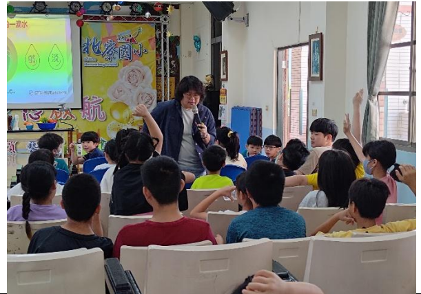
水資源對人類的重要性