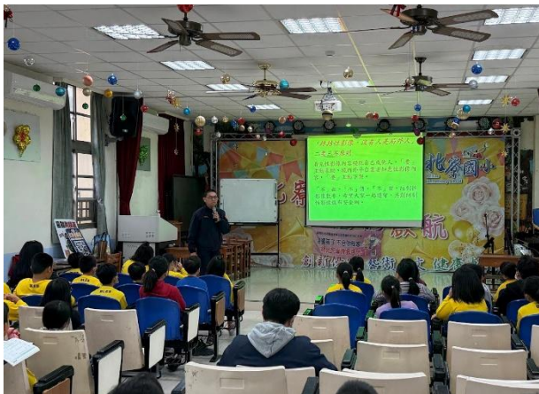
兒少性剝削防制宣導