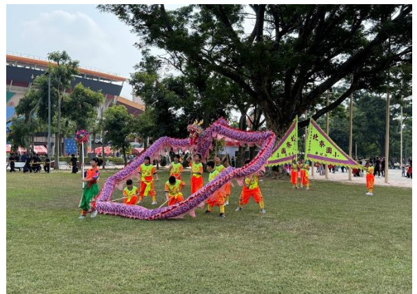
比賽前也要努力練習