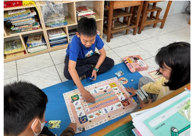
學生念防疫題目，進行桌遊遊戲