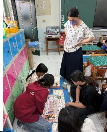
護理師介紹大富翁玩法