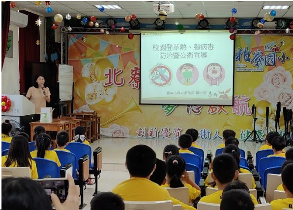
衛生所進行各項宣導