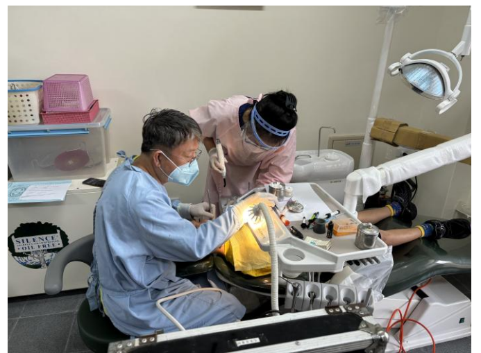
說明：校內診療床讓幼兒園也享有醫療資源