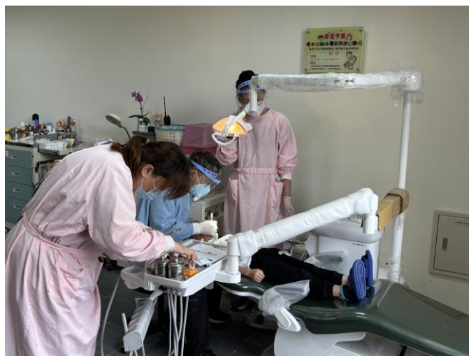
說明：校內診療床讓幼兒園也享有醫療資源