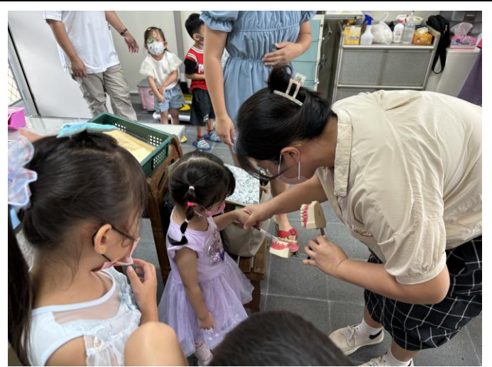
說明：校內診療床讓幼兒園也享有醫療資源