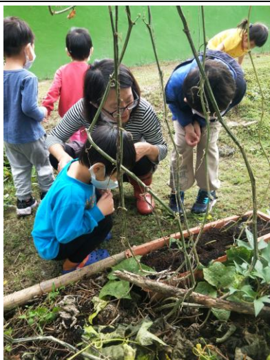
說明：校內自給農園計畫納入幼兒園學生