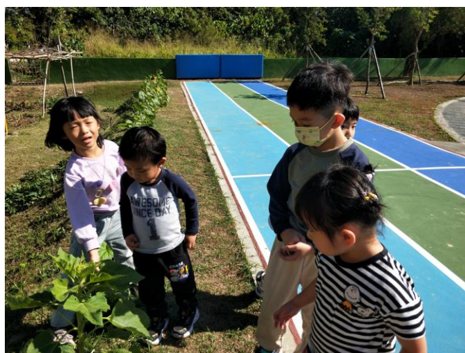
說明：校內自給農園計畫納入幼兒園學生