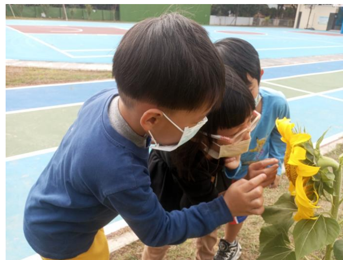
說明：校內自給農園計畫納入幼兒園學生