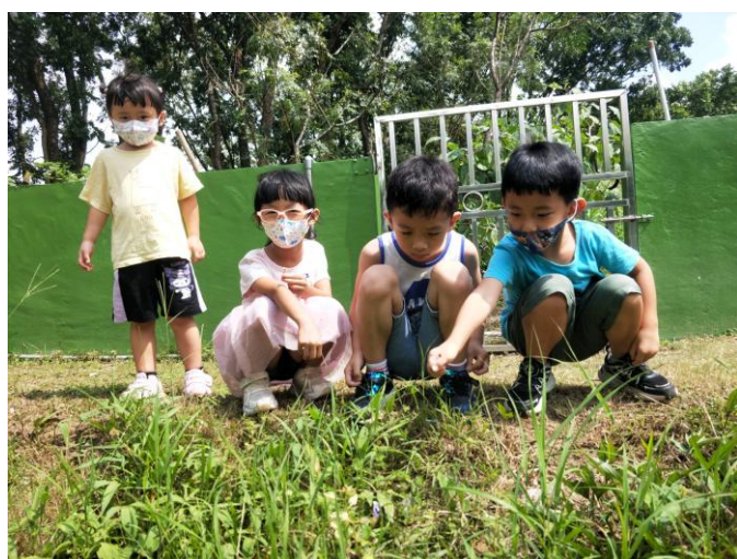
說明：校內自給農園計畫納入幼兒園學生