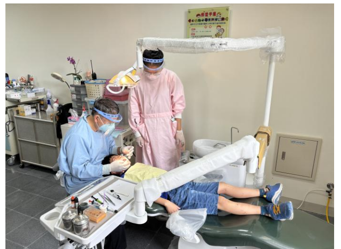
說明：校內診療床讓幼兒園也享有醫療資源