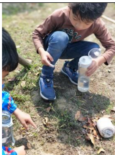
說明：校內自給農園計畫納入幼兒園學生