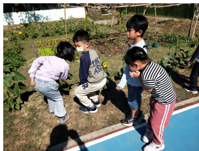
說明：校內自給農園計畫納入幼兒園學生