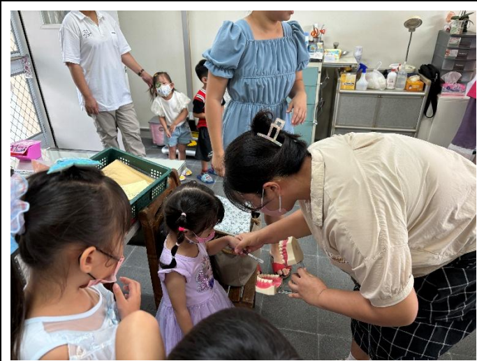
說明：校內診療床讓幼兒園也享有醫療資源